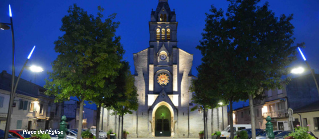
Place de l'Église