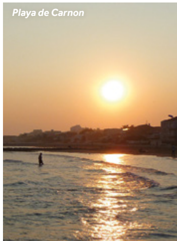
Playa de Carnon

Mercado: de mediados de junio a principios de septiembre, martes, jueves y sábados por la mañana, en la calle du Levant