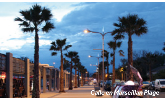
Calle en Marseillan Plage

Puesto que se trata de una cuenca, cruce tomando todas las precauciones y no lo atraviese si los vientos son muy fuertes o si hay mala visibilidad. El capitán del puerto de Marseillan puede facilitarle las previsiones meteorológicas; tan solo tiene que llamar al +33 (0)6 12 20 35 35 o en Bouzigues al +33 (0)6 79 37 27 35, o al +33 (0)4 67 46 34 97 en Sète. Permanezca en los canales indicados. No se pueden realizar anclajes, y tampoco utilizar duchas ni los aseos mientras esté en el Étang de Thau; utilice las instalaciones del puerto exclusivamente.