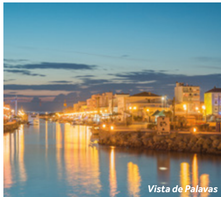
Vista de Palavas

Restaurante: "Le Phare", situado arriba del faro.