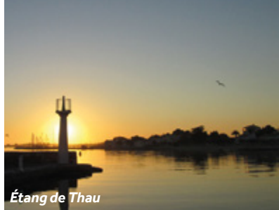
Étang de Thau

El Étang de Thau es una enorme laguna de agua salada que se separa del mar Mediterráneo por un pequeño tramo de arena. Aunque es el hogar de una gran variedad de vida marina, como caballitos de mar, almejas y erizos de mar, las auténticas estrellas son los mejillones y las ostras. Estos moluscos se han cultivado en la zona durante siglos, y se producen más de 20 toneladas cada año. Entre Bouzigues, Mèze y Marseillan los lechos de ostras llegan hasta donde alcanza la vista. Durante su visita, asegúrese de probar estas especialidades regionales.