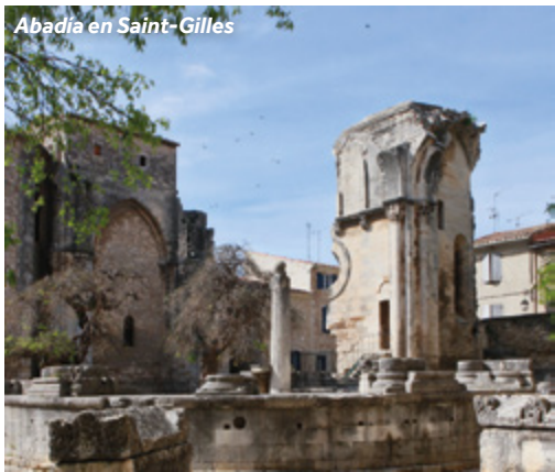
Abadía en Saint-Gilles

Mercado: jueves y domingos por las mañanas, avenida Émile Cazelles.