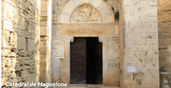
Catedral de Maguelone

Antes de llegar a Palavas-les-Flots, encontrará la catedral de Maguelone en una pequeña isla situada en el centro de la laguna. Descubra esta joya del arte románico, construida en el siglo XI. Durante casi diez siglos, esta fortaleza fue el hogar de la diócesis de Montpellier y muchos papas solían visitar este apacible lugar para reflexionar.