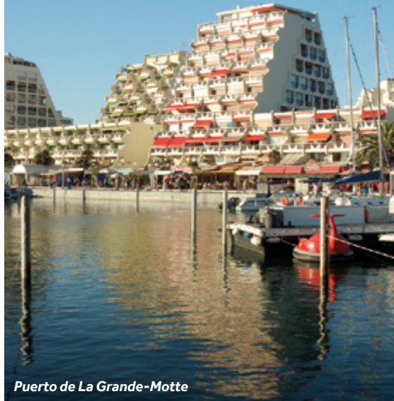
Puerto de La Grande-Motte

Mercado: domingo por la mañana y de Junio a Septiembre también los jueves - Plaza du 8er Octobre.