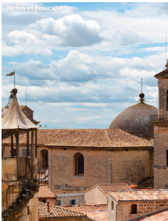
Techos en Beaucaire

Mercado: jueves y domingos por las mañanas, plaza du 8 Mai (Beaucaire) | Martes por las mañanas, avenida de la République (Tarascon).