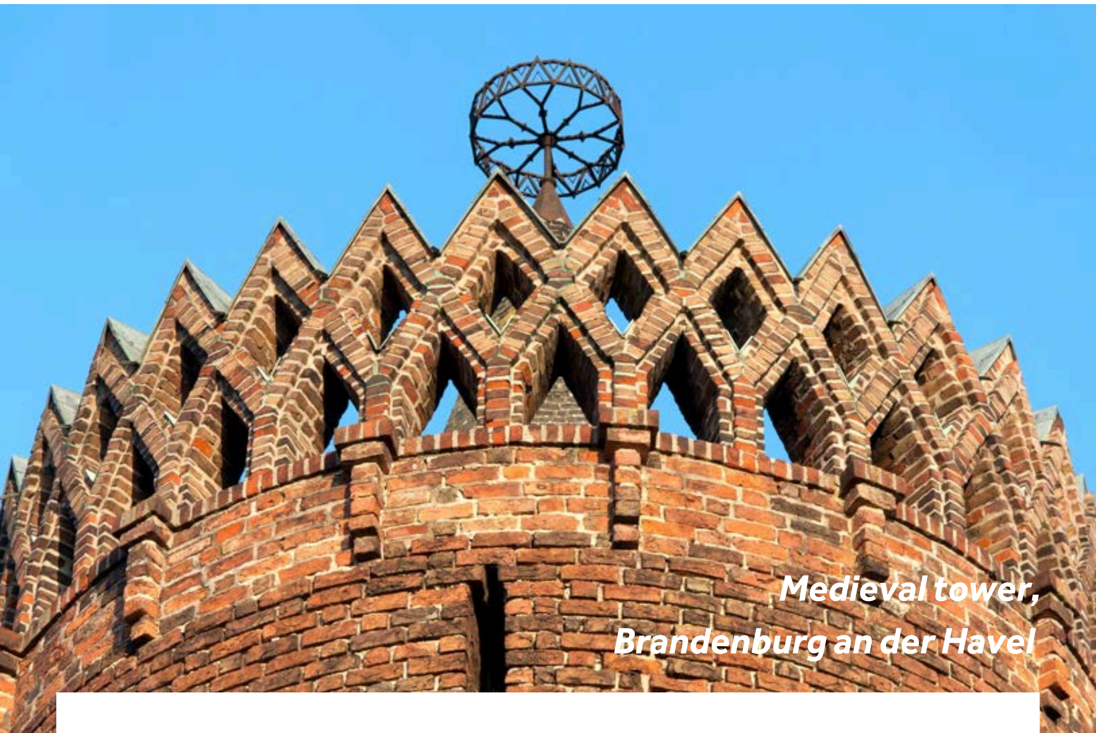
Medieval tower, Brandenburg an der Havel

Aufgrund ihrer langen Geschichte wird die Stadt auch als die “Wiege der Mark” bezeichnet. In den drei mittelalterlichen Stadtkernen findet man zahlreiche Sehenswürdigkeiten, wie den Brandenburger Dom, mehrere große Backsteinkirchen, das Altstädtische Rathaus mit dem Roland und das Paulikloster. Umgeben von einer traumhaften Fluss- und Seenlandschaft, ist Brandenburg an der Havel ein Eldorado für Freizeitkapitäne und Wassersportler.