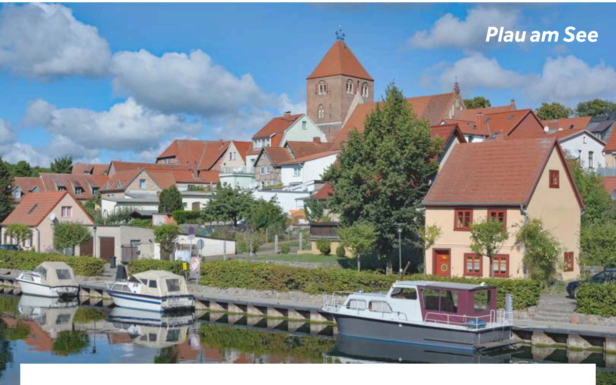
Plau am See

Der Luftkurort liegt wunderschön idyllisch direkt am Plauer See, dem drittgrößten See in Mecklenburg-Vorpommern. Begrüßt werden Sie von dem dominanten Leuchtturm, der Ihnen die Einfahrt zur Müritz-Elde-Wasserstraße gewährt. Die Stadtmarina liegt ideal, um die malerische Altstadt mit den vielen Fachwerkhäuschen zu erkunden. Empfehlenswert ist ein Besuch der St. Marienkirche aus dem 13. Jh. Steigen Sie die 120 Stufen des Kirchturms hoch und Sie werden mit einem atemberaubenden Panoramablick über die traumhafte Seenlandschaft belohnt.