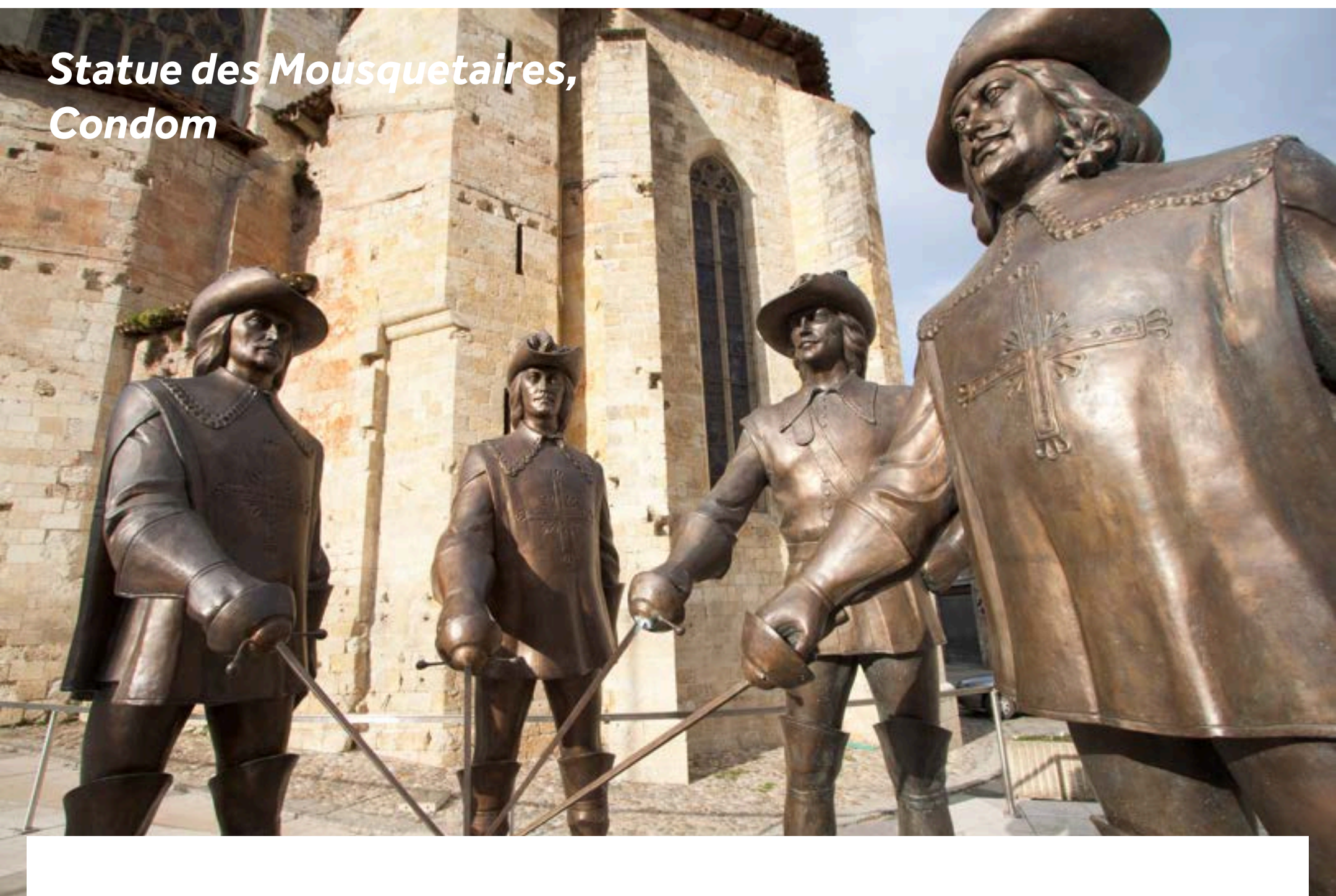
Statue des Mousquetaires, Condom

Partez à la découverte de la haute ville avec sa majestueuse cathédrale St-Pierre et son cloître. Sur la Place de la Cathédrale trône la statue du héros absolu des Gascons, D'Artagnan et ses trois mousquetaires. N'oubliez pas de déguster la boisson locale, l'Armagnac, lors de votre escale.