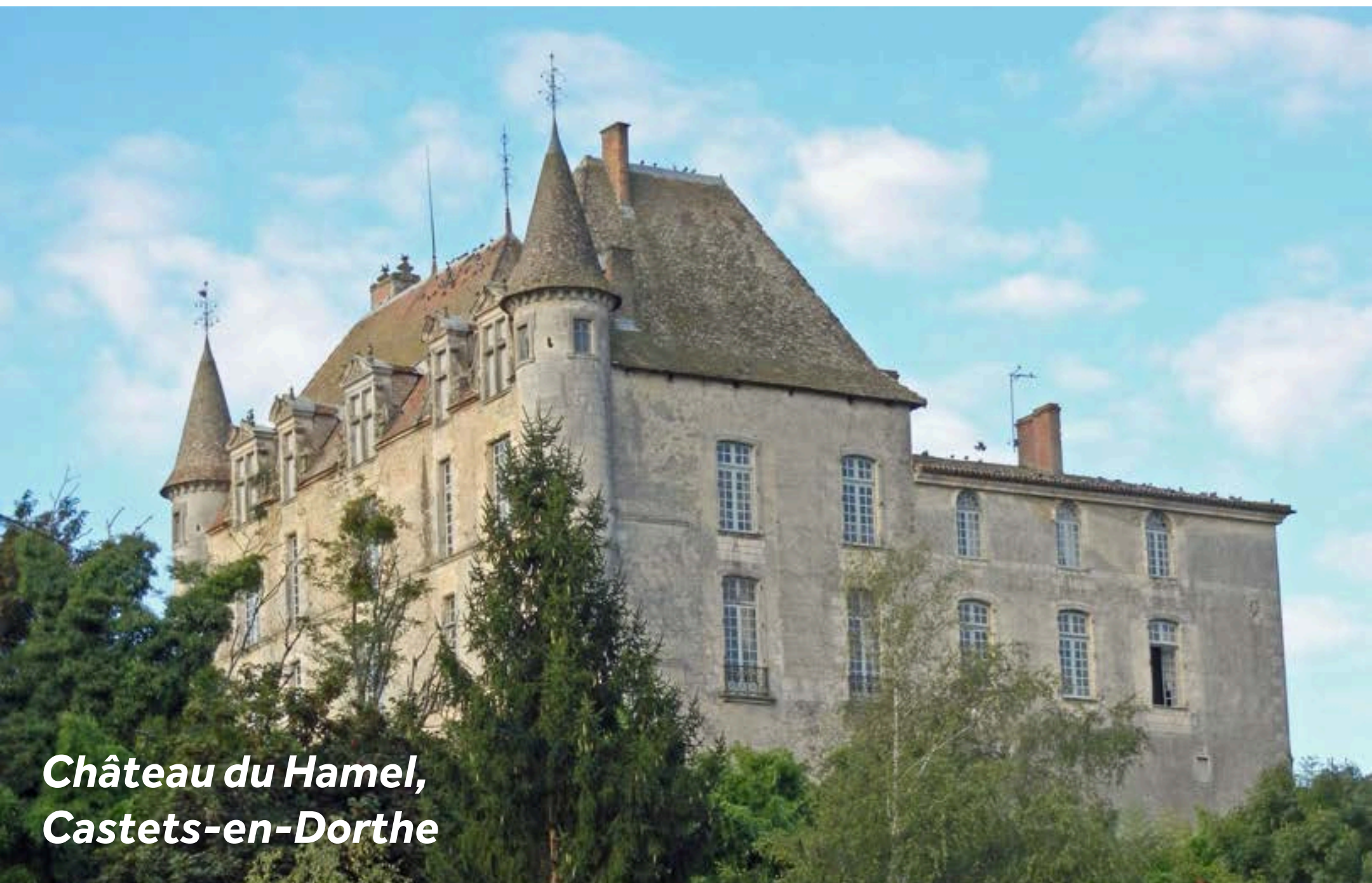
Château du Hamel, Castets-en-Dorthe

Depuis l'église St-Louis sur la place du village, vous pouvez marcher jusqu'à l'esplanade qui domine toute la vallée de la Garonne et d'où on peut admirer la jonction entre le Canal et la Garonne. Le village compte un autre édifice religieux, l'église St-Romain, située à l'est du village et qui date du XI e siècle. Le château du Hamel (XVI e siècle) est une propriété privée. Classé monument historique, il se visite uniquement sur rendez-vous en appelant les propriétaires (+33 (0) 6 64 33 79 74).