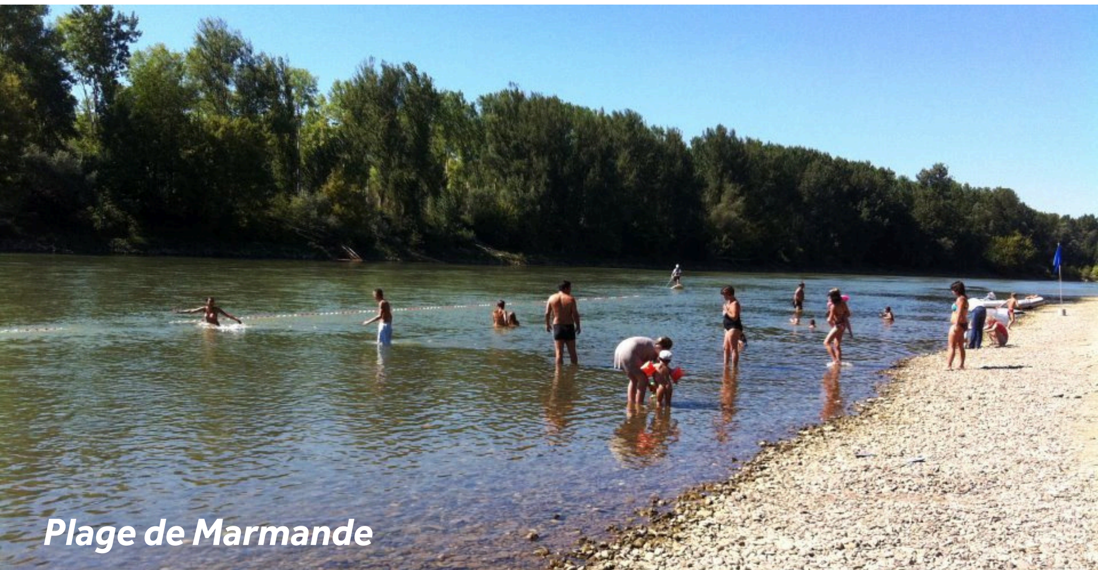
Plage de Marmande

Amarrez-vous au ponton de La Grande Route, chevauchez votre vélo et parcourez les 6km qui vous séparent de Marmande, la capitale de la tomate. Visitez son cloître du XVI e siècle et son jardin à la française qui fait partie des 'Jardins remarquables' de France. Baladez-vous sur le Chemin de Ronde derrière l'église pour découvrir quelques vestiges des fortifications médiévales de la ville. Si vous souhaitez vous rafraîchir, vous avez le choix entre la plage au bord de la rivière Garonne ou Aquaval, un complexe aqualudique avec piscine à vagues, pataugeoire et toboggan.