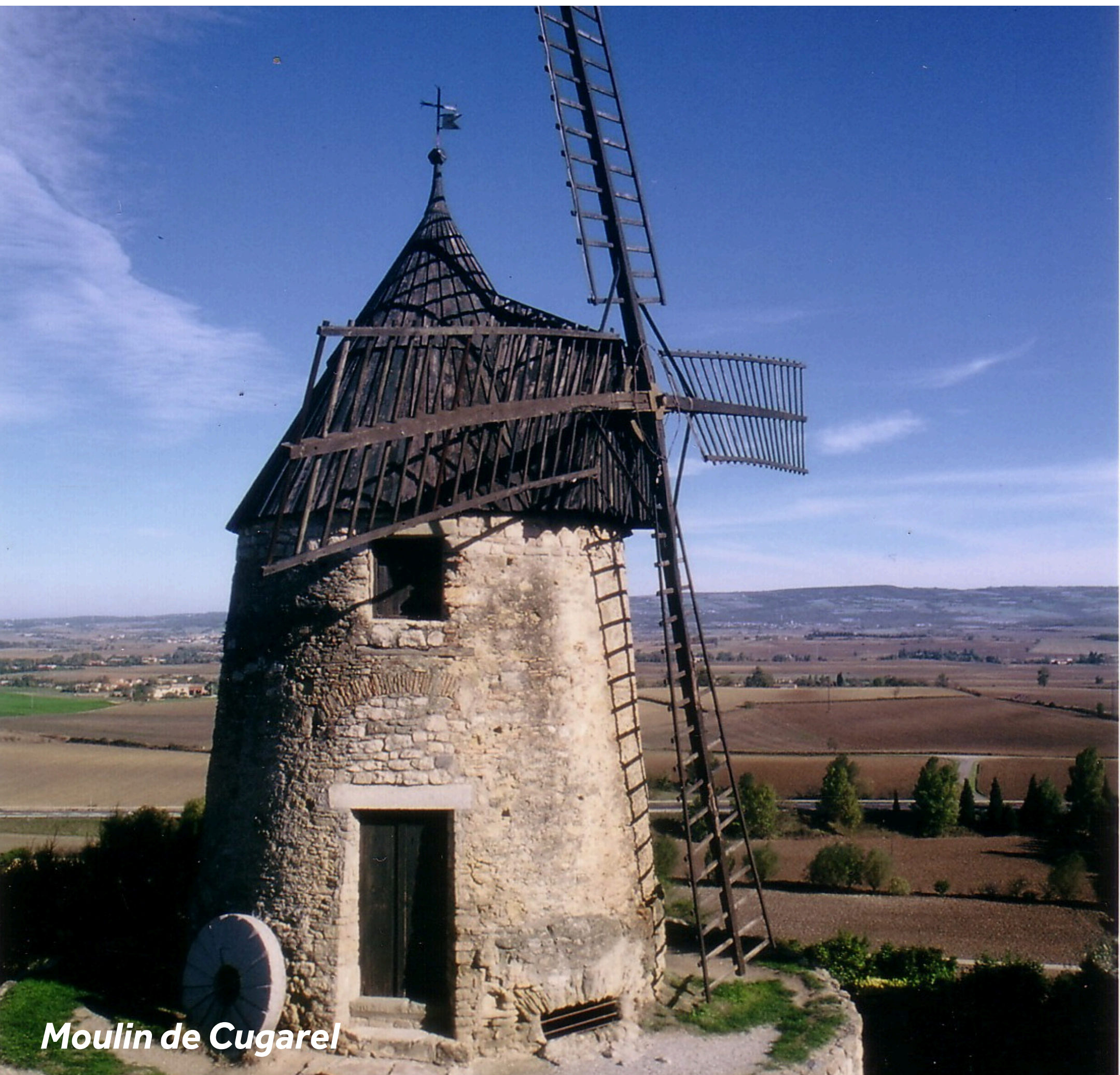
Moulin de Cugarel

La ville historique de Castelnau-dary est célèbre pour sa spécialité gastronomique : le Cassoulet, plat typique à base de haricots blancs, de porc et de canard. Lors de votre passage dans cette jolie ville, visitez le Moulin du Cugarel qui date du 17ème siècle. Prenez le temps de visiter le centre ville et découvrir ses petits commerces, et profitez d'un joli panorama sur la Montagne Noire. Vous pourrez visiter la Collégiale de St Michel, son impressionnant cloître, et découvrir son orgue qui date de l'époque baroque.