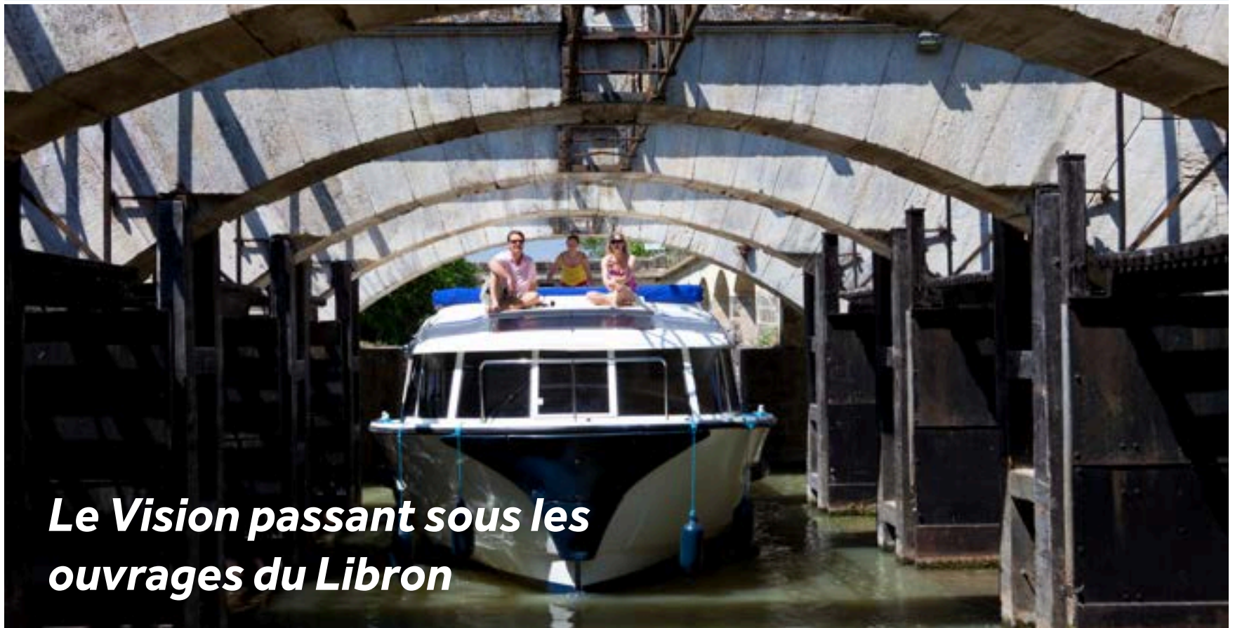
Le Vision passant sous les ouvrages du Libron

À l'est de Port Cassafières, vous passerez sous les Ouvrages du Libron, une merveille d'ingénierie construite en 1858 qui permet l'écoulement des eaux du Libron en période de crue.