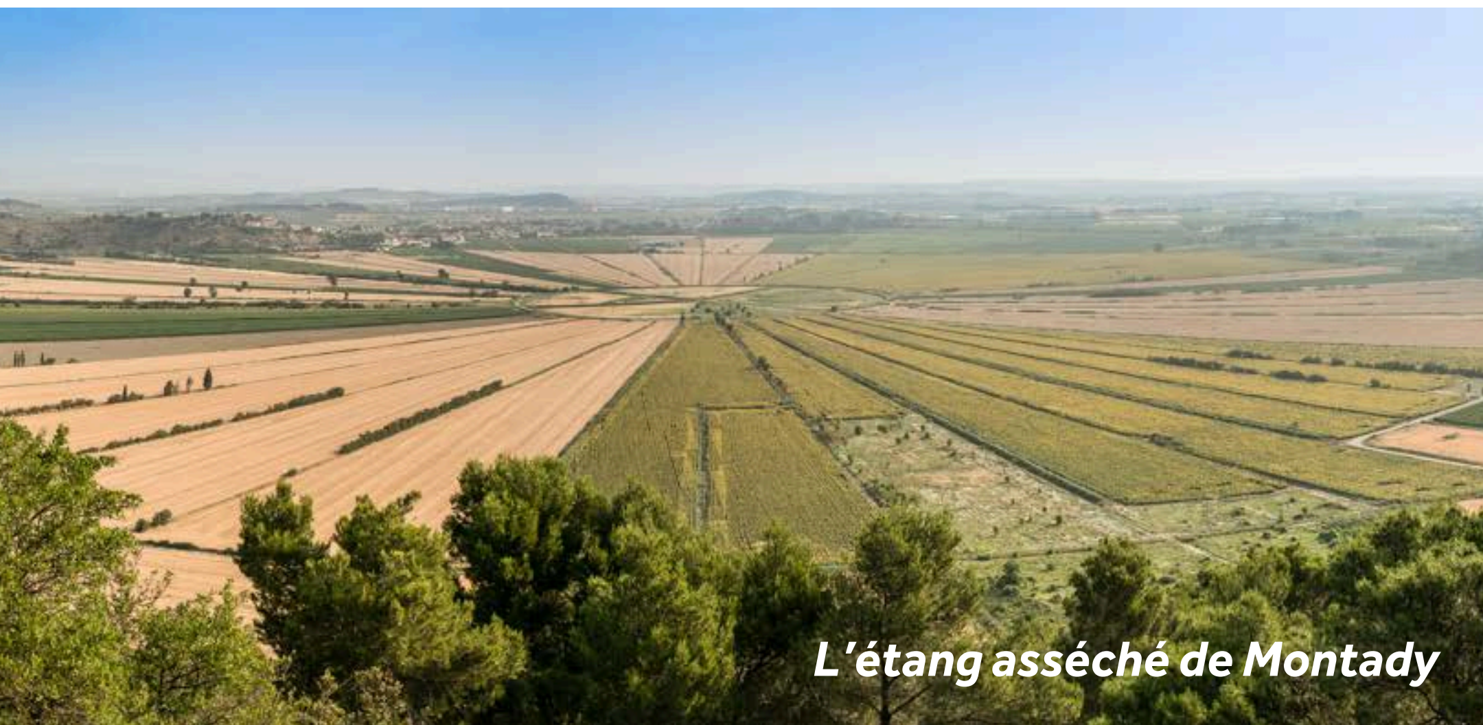
L'étang asséché de Montady

Colombiers est un joli petit village animé avec une église et de nombreux restaurants. La principale attraction reste l'Oppidum d'Ensérune, à l'extérieur du village. Ce site archéologique offre un témoignage remarquable du passé, depuis l'Âge de Bronze jusqu'à la conquête Romaine.