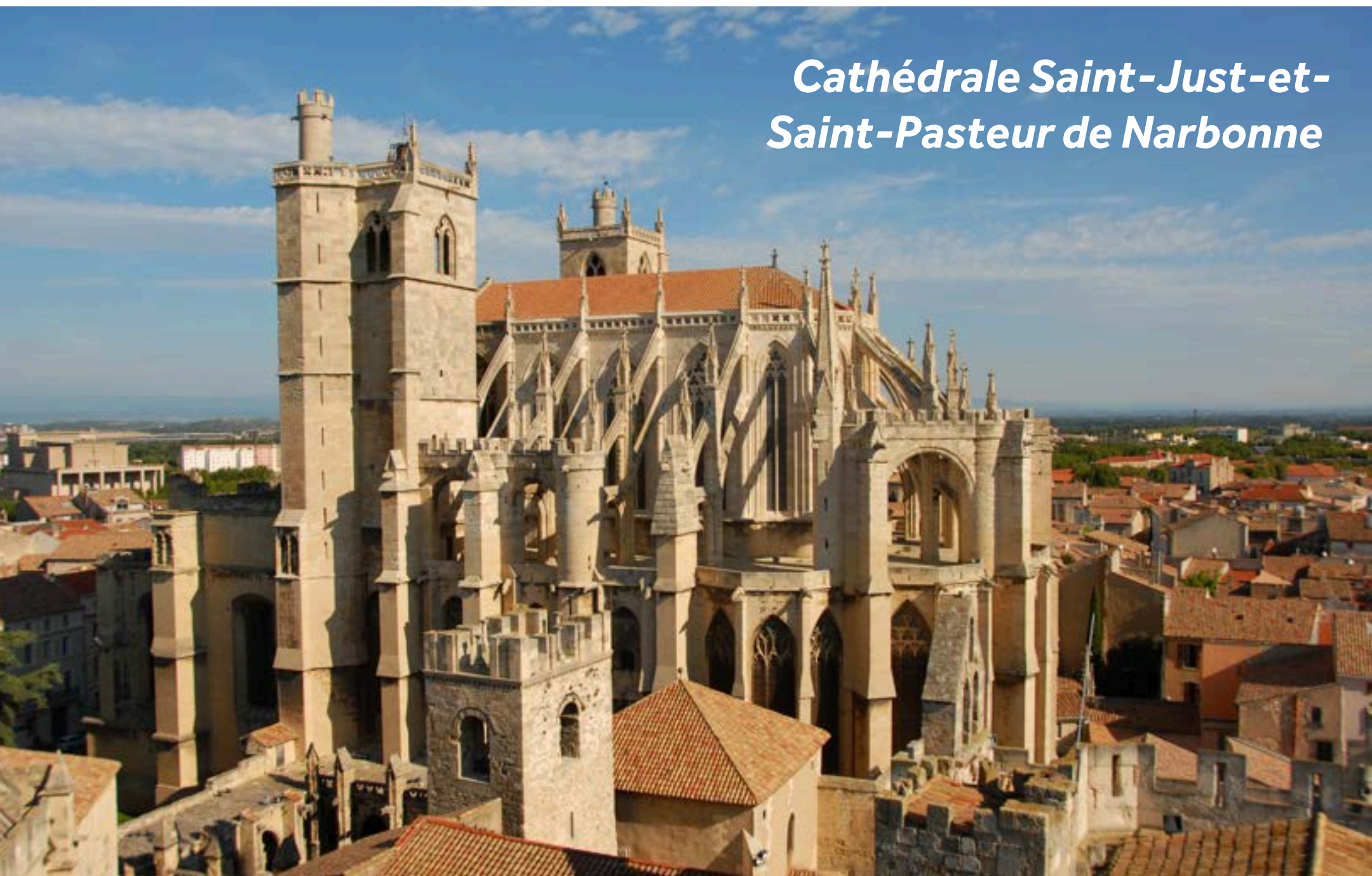
Cathédrale Saint-Just-et-Saint-Pasteur de Narbonne

Narbonne possède un patrimoine riche dans lequel les bâtiments anciens se mêlent aux petites rues et aux grands boulevards modernes et animés.