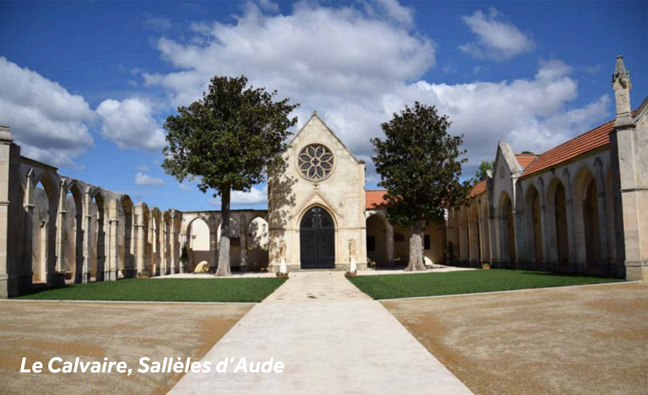
Le Calvaire, Sallèles d'Aude