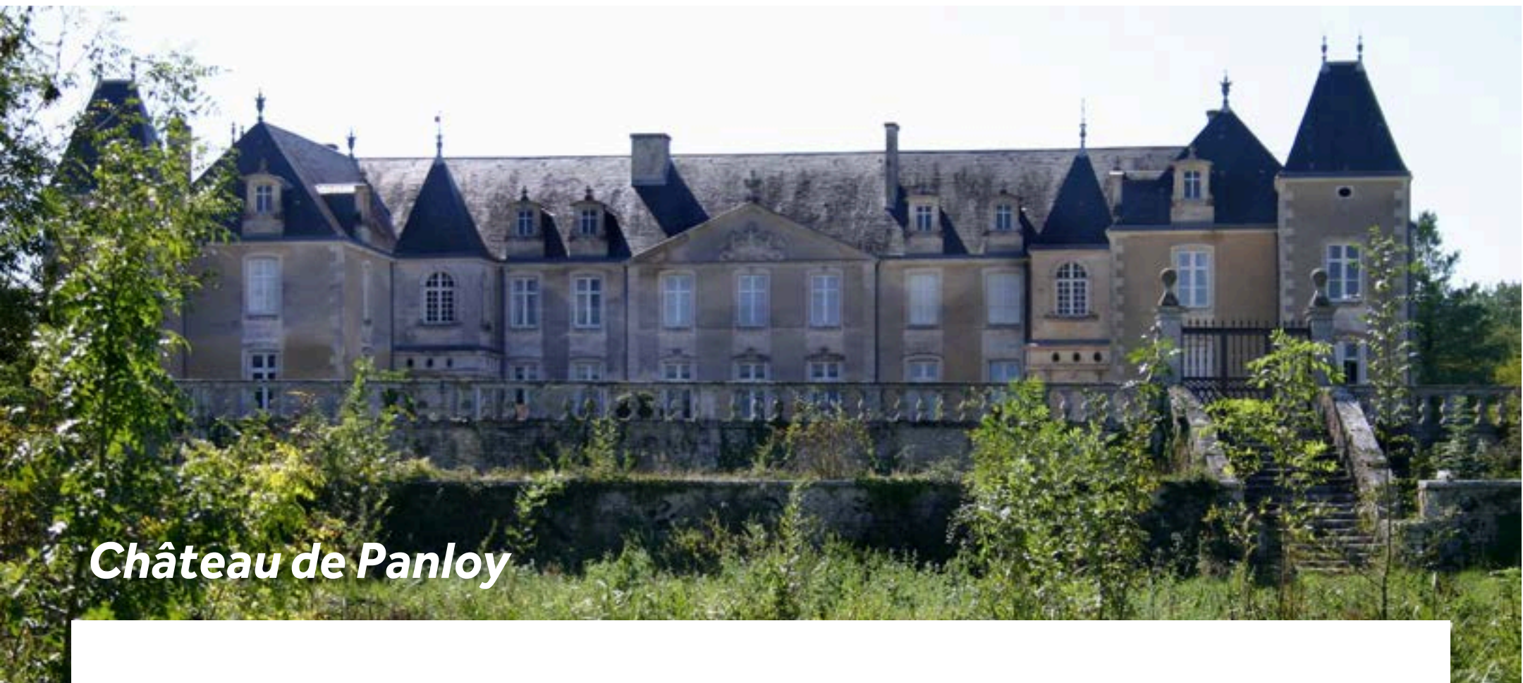
Château de Panloy

Entlang der Rue des Armateurs erwarten Sie prächtige Residenzen. Besuchen Sie das Chateau de Panloy (900m von den Anlegestellen) aus dem 13. Jahrhundert und nehmen Sie an einer Führung teil, um die Wandteppiche, Holzvertäfelungen und die Jagdgalerie zu sehen. Am Fluss gibt es einen Spielplatz, der über einen sicheren Bereich zum Schwimmen verfügt, sowie einen Kajakverleih – ein schöner Ort für ein Picknick und einen entspannten Nachmittag. Sollte Ihnen nach etwas Bewegung sein, lohnt sich ein Spaziergang oder eine Radtour nach Les Lapidales, einem alten Steinbruch, der nur 1km außerhalb der Stadt liegt. Bildhauer aus aller Welt haben hier Bildnisse in die Felsen gemeißelt.