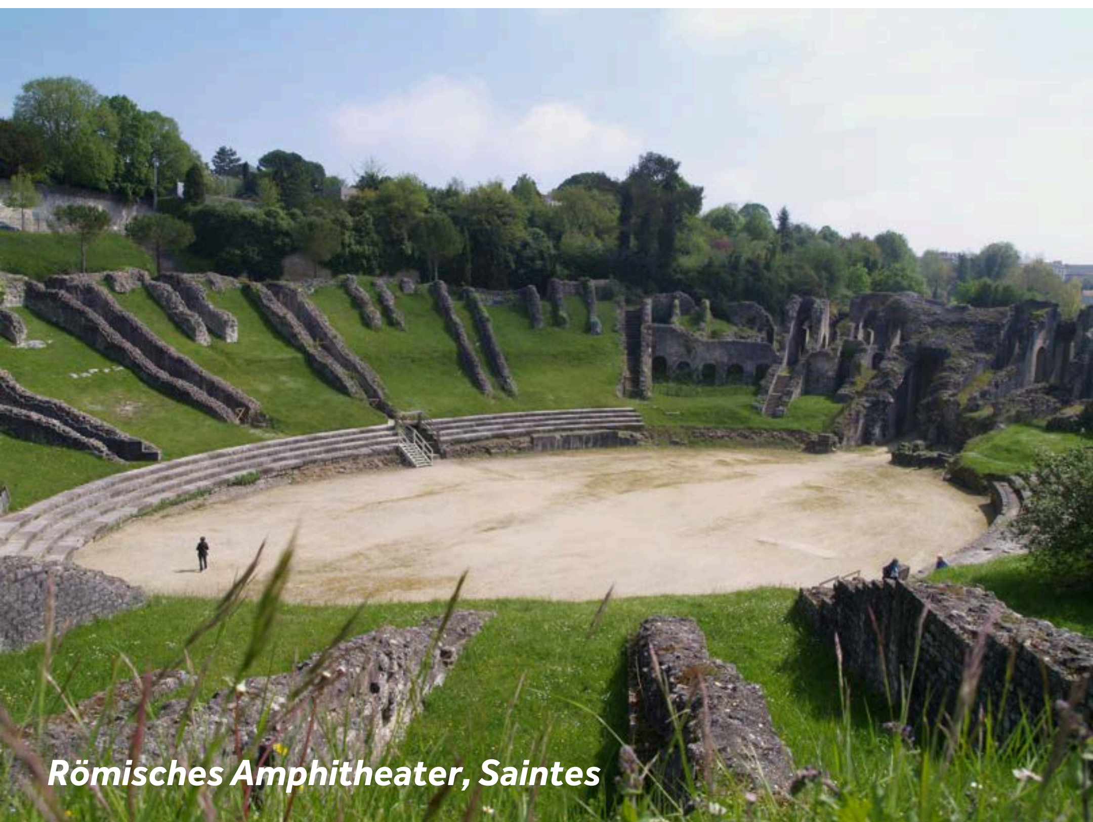
Römisches Amphitheater, Saintes

Wochenmarkt: Dienstag bis Sonntag (vormittags)