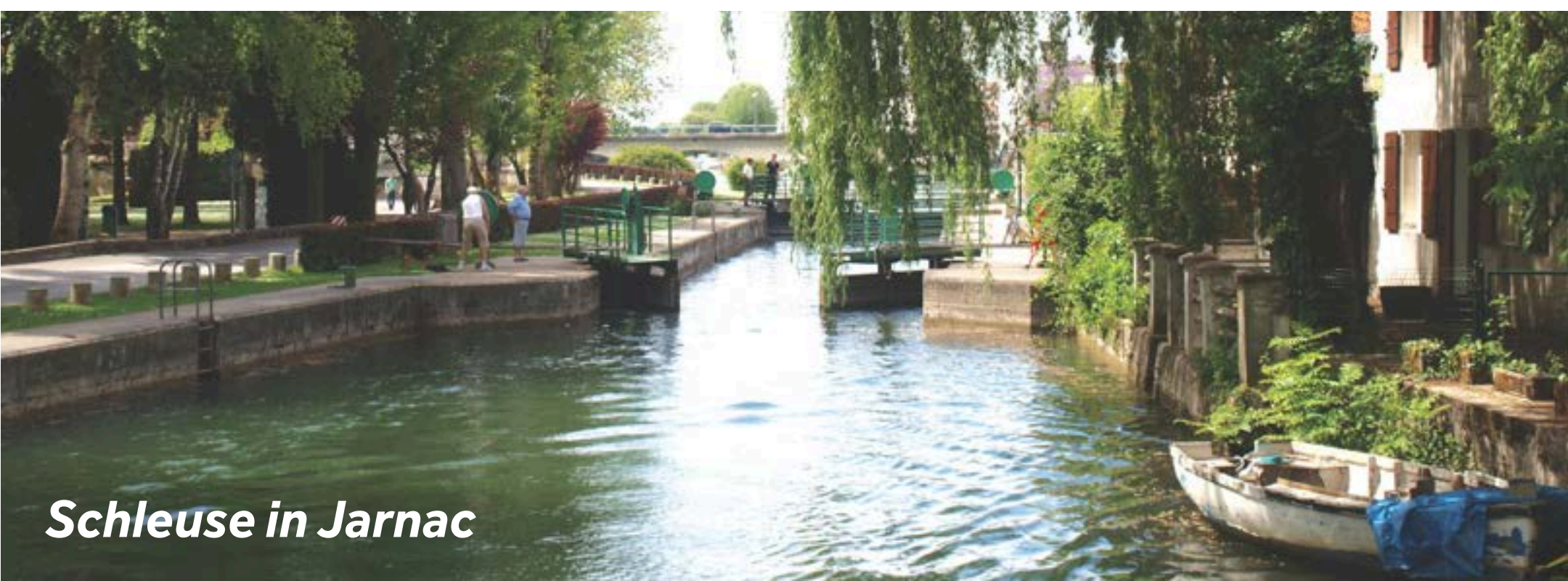
Schleuse in Jarnac

Die reiche Vergangenheit von Jarnac zeigt sich noch heute an den eleganten, weißen Häusern, die die Kais der Charente säumen. In dieser Stadt haben sich zwei große Cognac-Handelshäuser niedergelassen. Besuchen Sie das Haus Courvoisier, das sich in der Nähe der Brücke befindet. Während einer einstündigen Führung erfahren Sie alles über die Destillation, die Arbeit in den Weinbergen, die Weinkeller, die Kunst der Fassherstellung und die Alterung des ‚Elixiers der Götter‘. Jarnac ist zudem die Heimat des ehemaligen französischen Präsidenten François Mitterrand. Sein Elternhaus ist ihm zu Ehren für die Öffentlichkeit geöffnet. Hier werden die Geschenke ausgestellt, die der Präsident von Staats- und Regierungschefs aus der ganzen Welt erhalten hat. Wer es entspannt angehen lassen möchte, kann den Freizeitbereich auf der Île Madame besuchen, wo ein Komplex aus Außenpools und Erholungsflächen zum Entspannen einlädt.