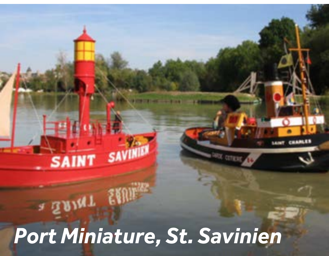
Port Miniature, St. Savinien

Spazieren Sie in die Innenstadt und entdecken Sie die Kirche und ihren Vorplatz, auf dem sich viele Heiligenstatuen befinden. Die Insel La Grenouillette bietet viele Freizeitaktivitäten: Angeln, Minigolf, Schwimmbäder, Tennis und