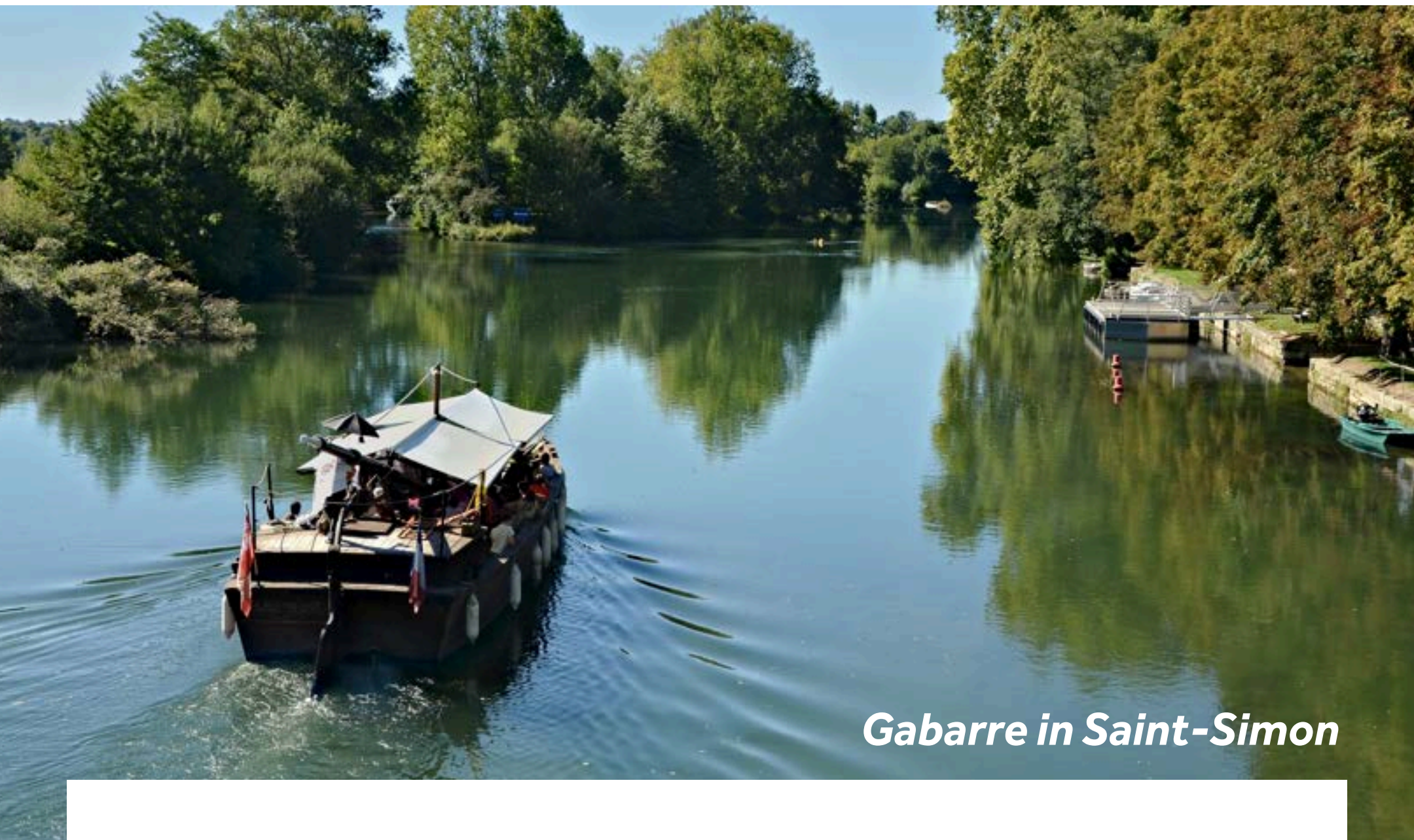
Gabarre in Saint-Simon

St. Simon war eine für den Schiffsbau sehr wichtige Stadt. Hier gab es einst drei Werften.