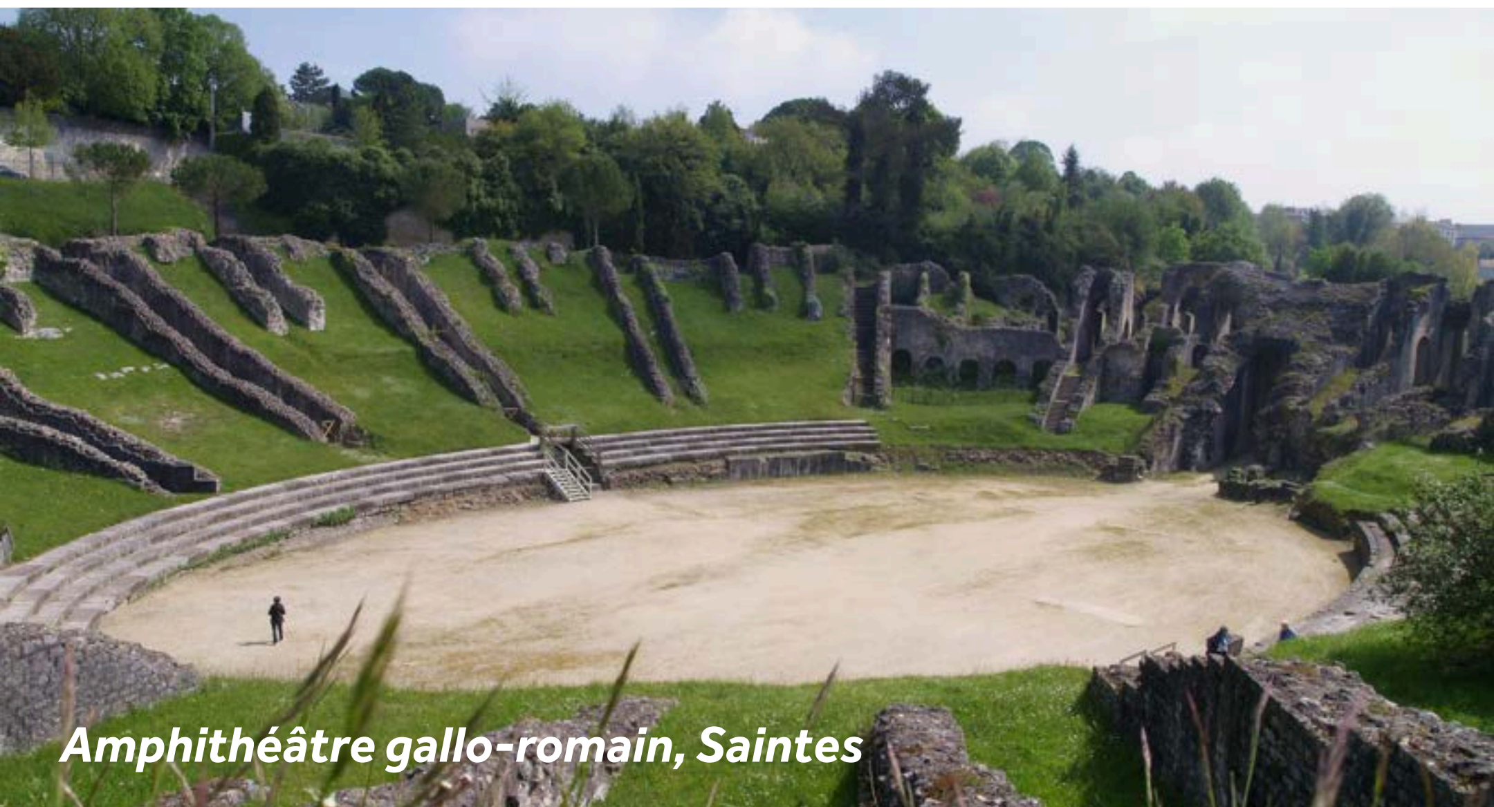
Amphithéâtre gallo-romain, Saintes