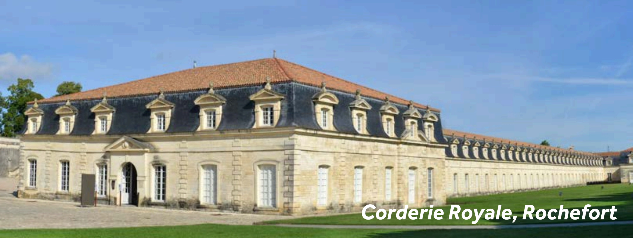
Corderie Royale, Rochefort