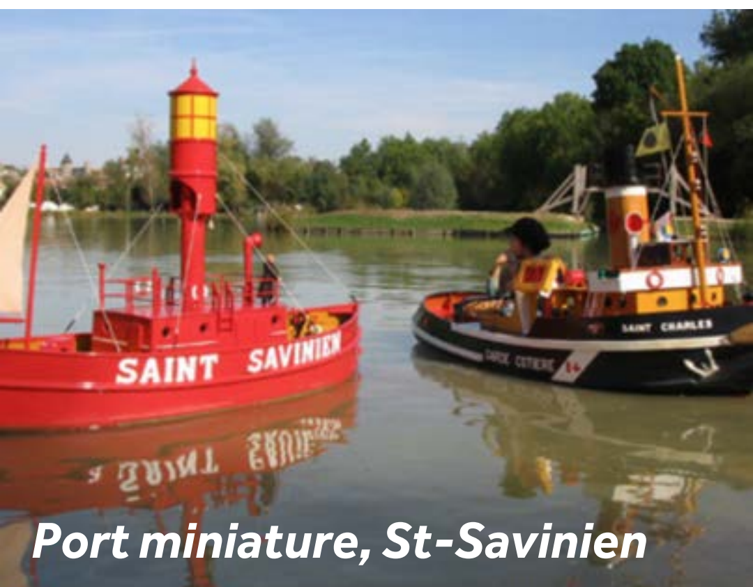
Port miniature, St-Savinien

Marchez en ville pour découvrir l'église et sa place bordée de statues de saints. L'île de la Grenouillette offre de nombreuses activités pour petits et grands : pêche, mini-golf, piscine, tennis. Il y a aussi un lac avec un port miniature. Les enfants vont