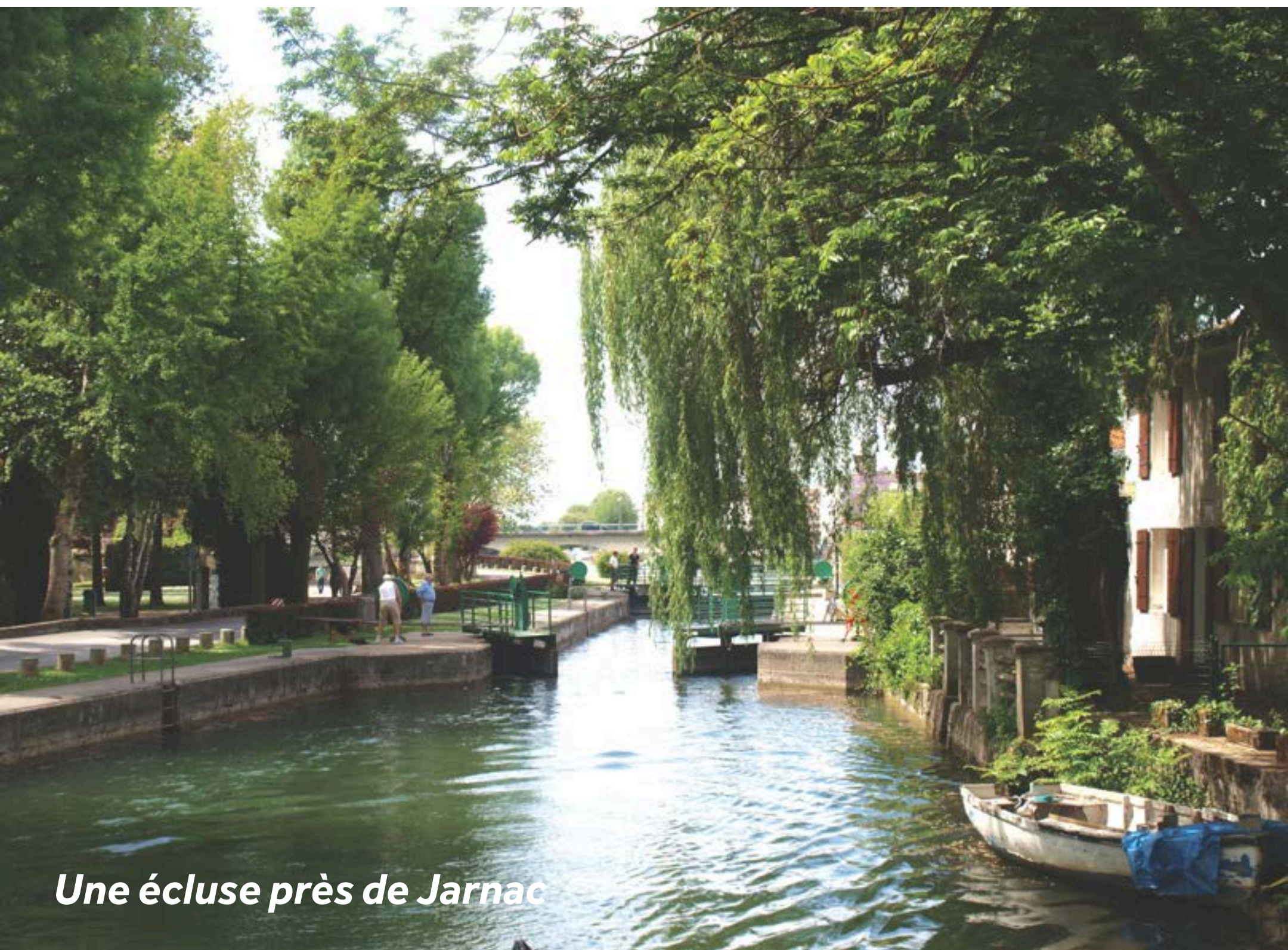
Une écluse près de Jarnac

Les riches demeures blanches qui bordent les quais de la Charente témoignent du passé prospère de Jarnac. Deux grandes maisons de négoce de Cognac se sont établies dans cette ville. Nous vous conseillons de visiter la Maison Courvoisier, située près du pont. En un peu plus d'une heure de visite, vous découvrirez tous les secrets de la distillation, du travail de la vigne, des chais, de la tonnellerie et du vieillissement si délicat de cette « liqueur des Dieux. Jarnac est également la ville de l'ancien président François Mitterrand. Sa maison natale, la Maison natale de François Mitterrand, est ouverte au public en son honneur et présente les cadeaux offerts au président par les chefs d'État du monde entier. Si le mercure grimpe, pourquoi ne pas vous rendre au centre aquatique de l'Île Madame, avec ses piscines en plein air et son aire de loisirs – idéal pour une journée de détente ?