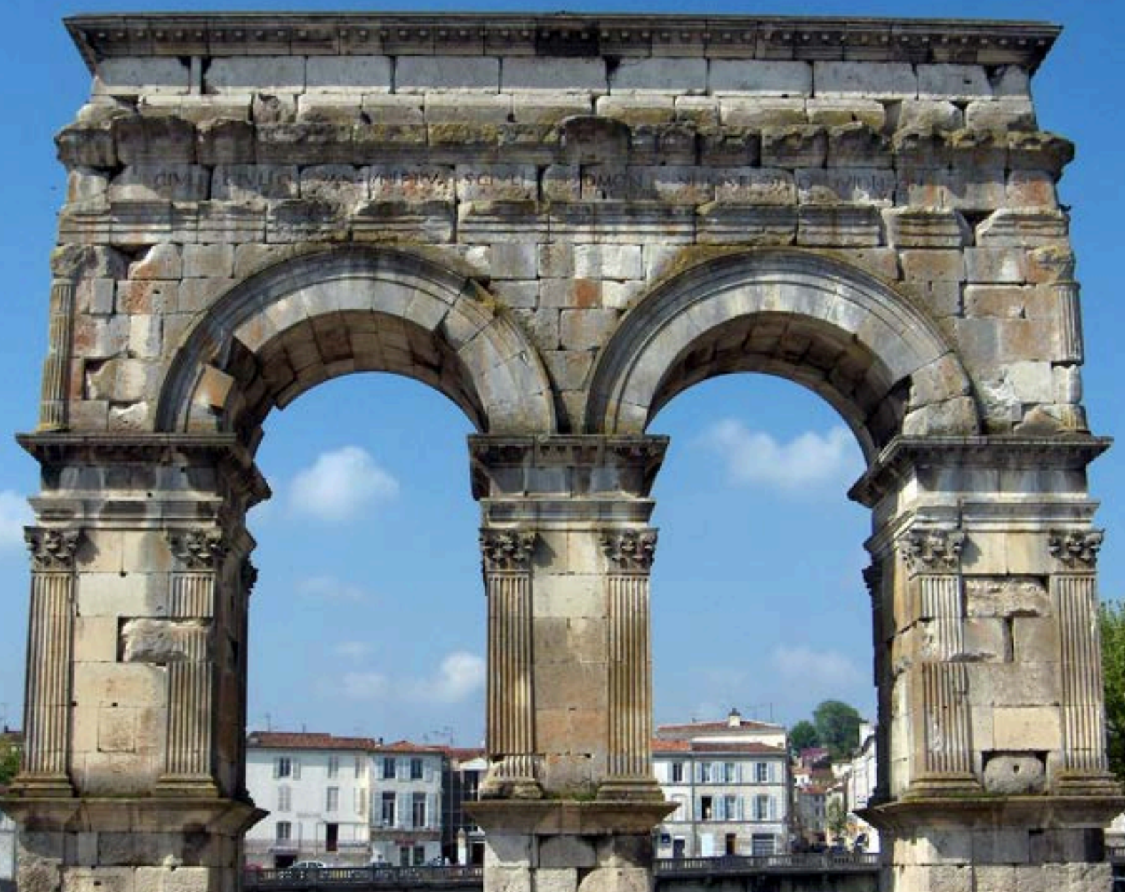
Arc de Germanicus

Ville d'Art et d'Histoire, Saintes recèle un beau patrimoine archéologique et monumental. La Charente coule au pied de l'arc de Germanicus (datant de 18-19 après JC). Explorez cette ville chargée d'histoire et découvrez les arènes gallo-romaines qui pouvaient accueillir 15 000 personnes, l'Abbaye aux Dames et l'église St-Eutrope, chefs-d'œuvre de l'art roman. Si vous n'avez pas envie de marcher, sautez à bord du petit train touristique pour découvrir la ville. L'embarquement se fait devant l'Office de Tourisme (à 2 min à pied de l'amarrage).