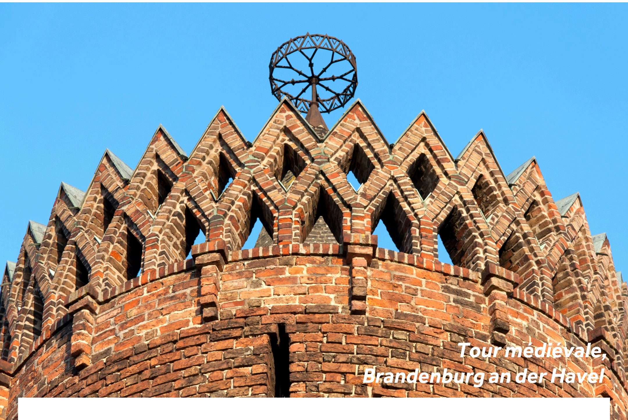
Tour médiévale, Brandenburg an der Havel

La jolie ville de Brandenburg an der Havel, a été façonnée par l'eau, et est un paradis pour les plaisanciers et les amateurs de sports nautiques. D'abord habitée par les Slaves au VI e siècle, Brandenburg donna son nom à toute la région. Vous serez surpris par la beauté de ses reliques médiévales et son centre historique, comptant plusieurs remarquables monuments gothiques en briques rouges. Découvrez également la cathédrale, plusieurs grandes églises de briques, l'ancien hôtel de ville et le monastère Paulikloster.