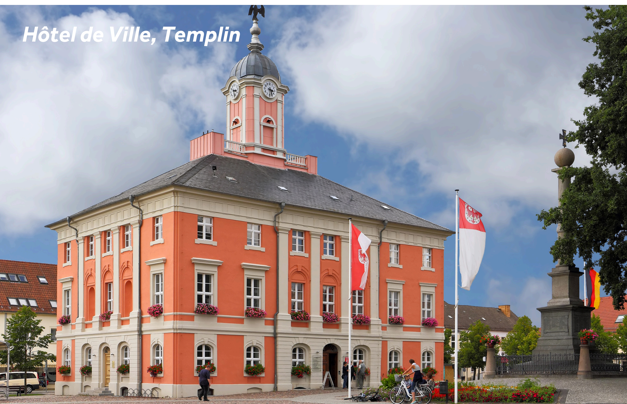
Hôtel de Ville, Templin