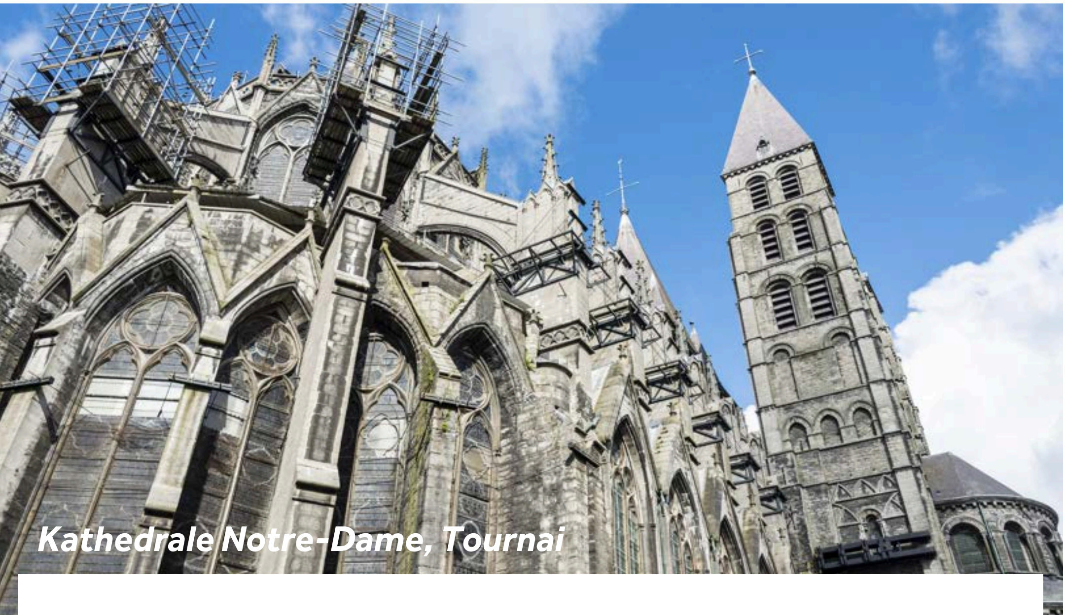
Kathedrale Notre-Dame, Tournai

Auf den ersten Blick scheint das historische Tournai eine ruhige Provinzstadt zu sein, aber hier gibt es doch einiges zu sehen und zu tun. Die Kathedrale von Tournai (Kathedrale Notre-Dame) ist nicht nur eine der spektakulärsten Kirchen in Belgien, sondern wurde auch zum UNESCO-Weltkulturerbe erklärt. Insbesondere ein Besuch der Schatzkammer lohnt sich. Der Glockenturm in Tournai stammt aus dem 12. Jahrhundert und ist der älteste Glockenturm in Belgien. Auch er gehört zum UNESCO-Weltkulturerbe. Während Sie die 257 Stufen hinaufsteigen, werden Sie auf multimediale Shows und Ausstellungen stoßen, und im Sommer ertönt zudem jeden Sonntag gegen 15:30 Uhr ein Glockenspiel. Oben angekommen, werden Sie mit einem atemberaubenden Panoramablick über Tournai und seine Umgebung belohnt. Darüber hinaus bietet Tournai eine Fülle an Museen und Kunstgalerien.