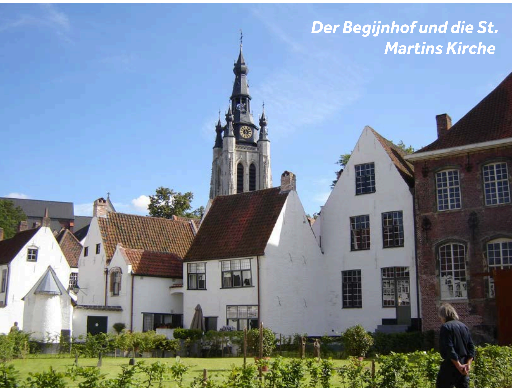
Der Begijnhof und die St. Martins Kirche

Besuchen Sie ‚Texture‘, um mehr über das Material Flachs sowie dessen Herstellung zu erfahren, das Kortrijk immensen Reichtum gebracht hat. Mitten im Stadtzentrum befindet sich die ruhige Oase eines Begijnhofs, ein Komplex, der einst Ordensfrauen beherbergte. Hierbei handelt es sich um einen von vielen in Belgien, die als UNESCO-Weltkulturerbe anerkannt wurden. Vor Ort befindet sich ein Museum.