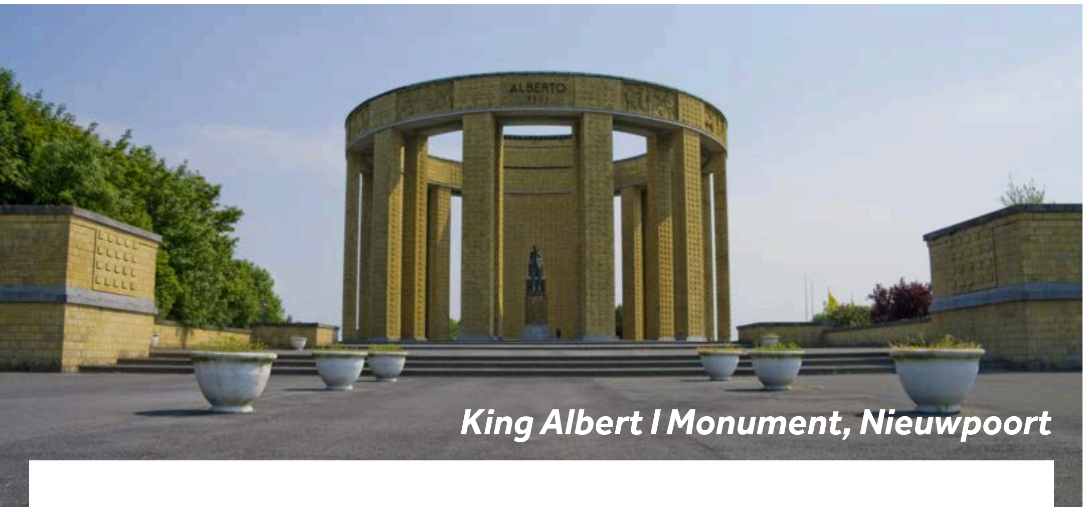
King Albert I Monument, Nieuwpoort

Nieuwpoort ist eine besonders bei Familien beliebte lebendige und weltoffene Stadt am Meer mit einer 2 km langen Promenade. Ein idealer Ort für einen sonnigen Tag am Sandstrand oder einen Stadtbummel, um das pulsierende Nachtleben zu genießen, frische Meeresfrüchte zu essen und nach Herzenslust zu shoppen. Für Geschichtsfreunde mit Interesse am Ersten Weltkrieg ist der Besuch des King Albert Memorial mit seinem traumhaften Panoramaausblick ein absolutes Muss. Auch die nahegelegenen Ganzepoot-Schleusen sind von großer Bedeutung, da sie vier Jahre lang die Binnengewässer kontrollierten und somit den Vormarsch feindlicher Truppen aufhielten.