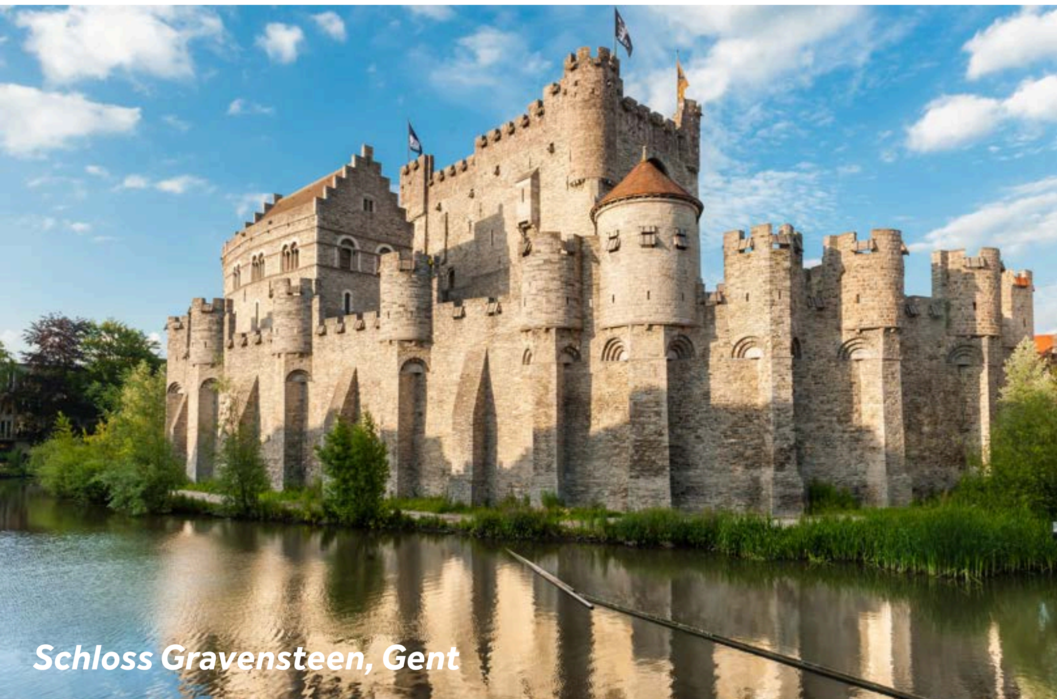
Schloss Gravensteen, Gent

Gent, die Perle von Flandern, war nach Paris einst die zweitgrößte Stadt Europas. Keine andere Stadt in Belgien hat so viele Denkmäler und beeindruckende Bauten; die St. Michaels-Brücke, die St. Bavo-Kathedrale, Schloss Gravensteen, der Glockenturm und das Gewandhaus, um nur einige zu nennen. Die historische Altstadt ist ideal, um zu Fuß erkundet zu werden – nehmen Sie unbedingt Ihre Kamera mit – mit faszinierenden Museen, schrulligen Bars und atemberaubender Architektur. Gent ist eine Stadt, die Sie sich nicht entgehen lassen sollten! De Dulle Griet (oder ‚Brown Café‘) besitzt ein schönes, mittelalterliches Interieur, das mit Wagenrädern, Schildern und historischen Kleinoden verziert ist. Dieses Café bietet die größte Bierauswahl in Gent: über 350 lokale und internationale Biere. Hier können Sie Ihren Schuh gegen ein ‚Max‘-Bier in einem schuhförmigen Glas eintauschen.