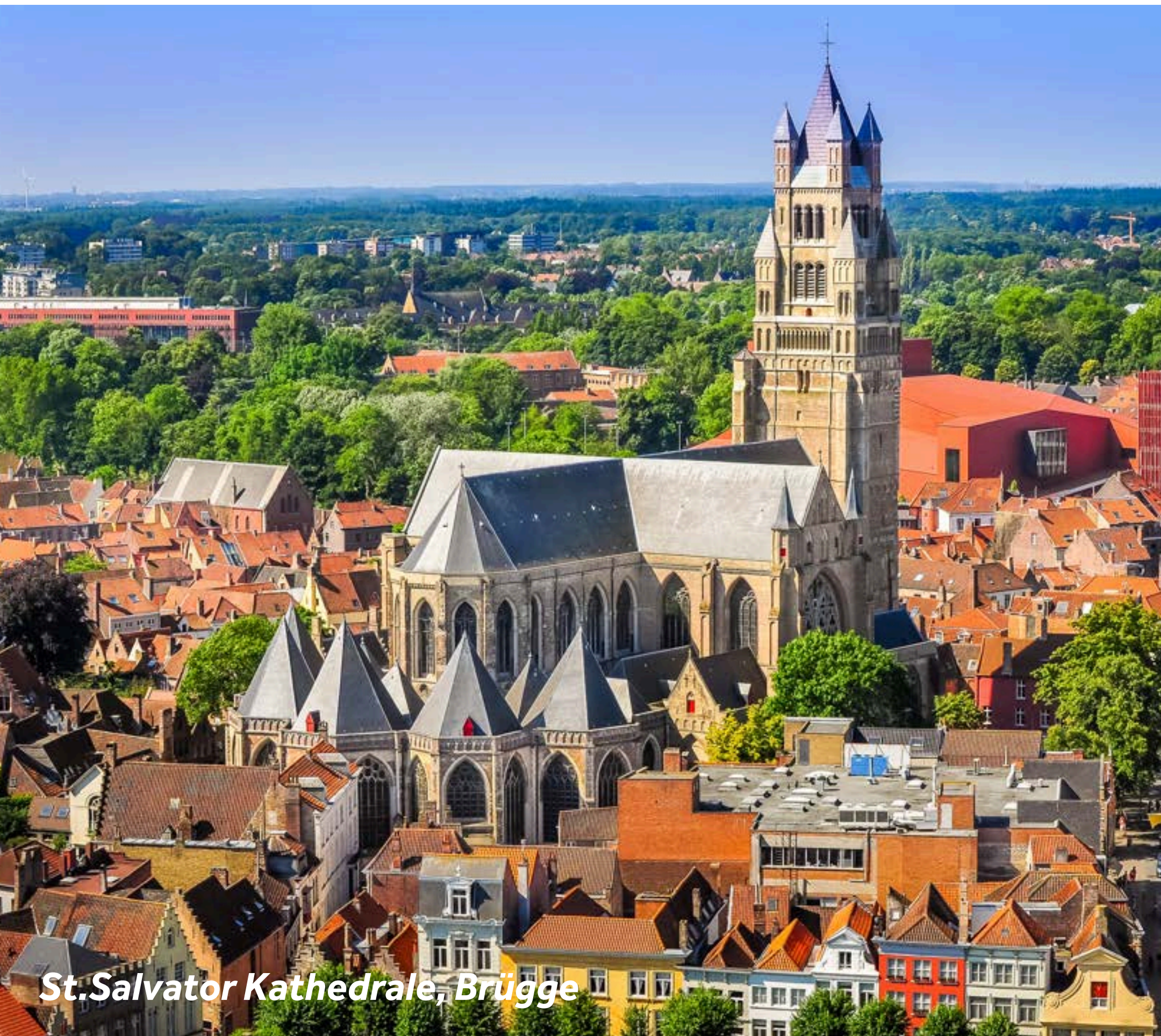
St. Salvator Kathedrale, Brügge

Die De Halve Maan Brauerei ist ein Muss, also lassen Sie doch einen aktionsgeladenen Tag (oder zwei) ausklingen, indem Sie auf den Belfort steigen, für einen atemberaubenden Blick über diese beeindruckende Stadt.