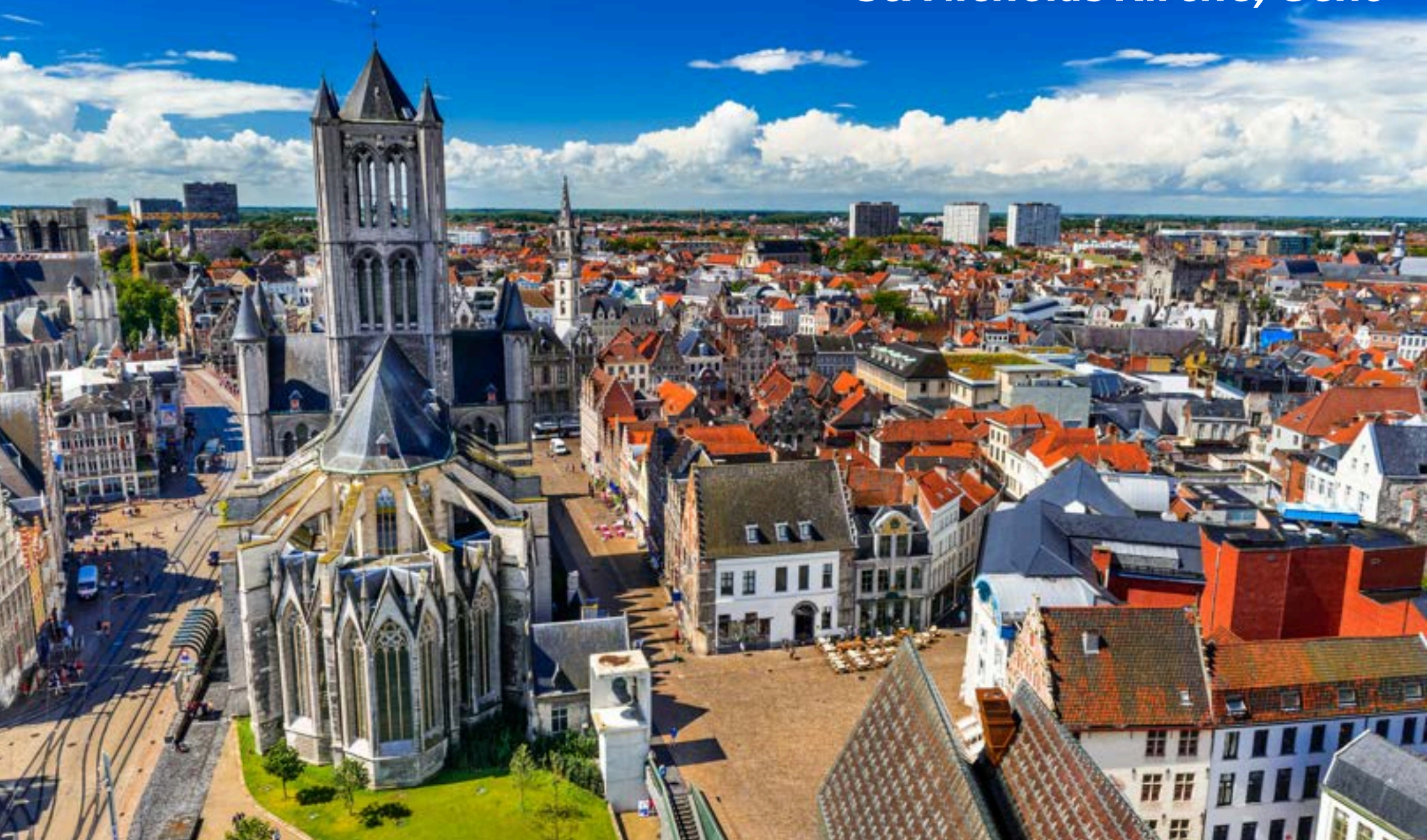
St. Nicholas Kirche, Gent