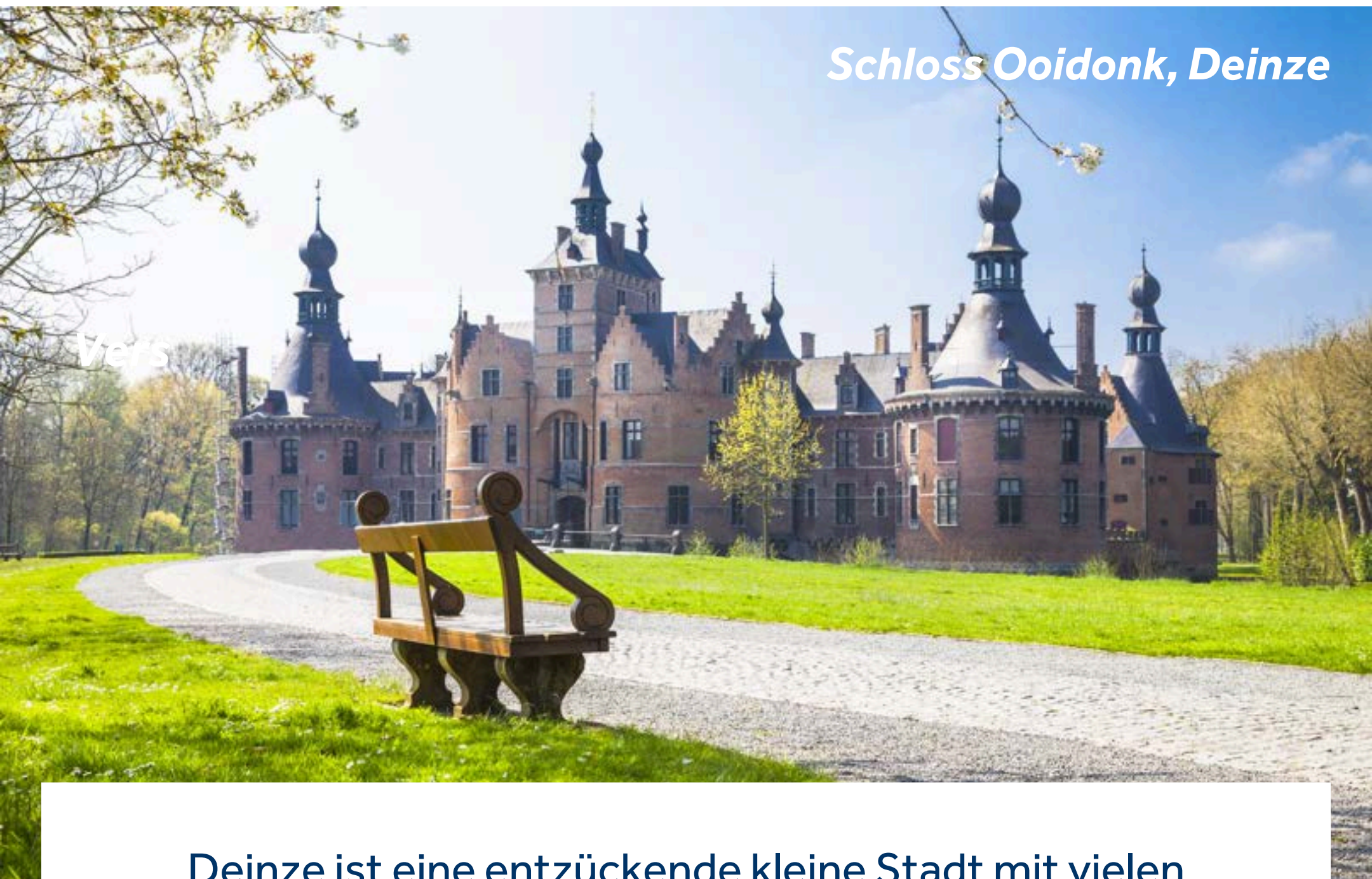
Schloss Ooidonk, Deinze

Deinze ist eine entzückende kleine Stadt mit vielen Geschäften und Restaurants, in der man wunderbar entspannen oder den Brielmeersen Park erkunden kann.