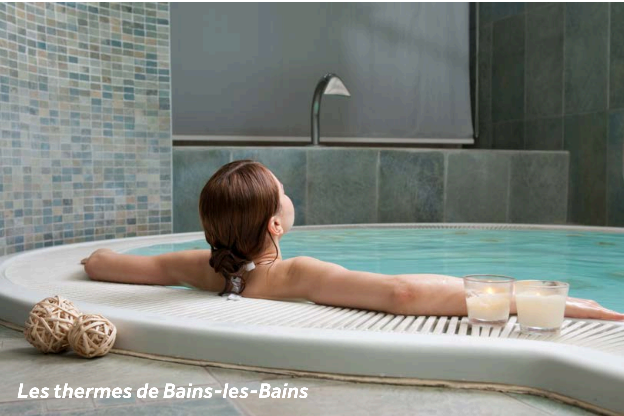
Les thermes de Bains-les-Bains

Depuis l'époque romaine, les thermes de Bains-les-Bains procurent santé et bien-être. Dans un magnifique parc arboré se trouve le centre thermal offrant des mini-cures, idéales pour les gens de passage qui veulent se faire chouchouter le temps d'une journée. Relaxez-vous d'une autre façon, en faisant une partie de mini-golf ou bien en vous baladant en calèche à travers la campagne (+33 (0) 6 82 53 52 81).