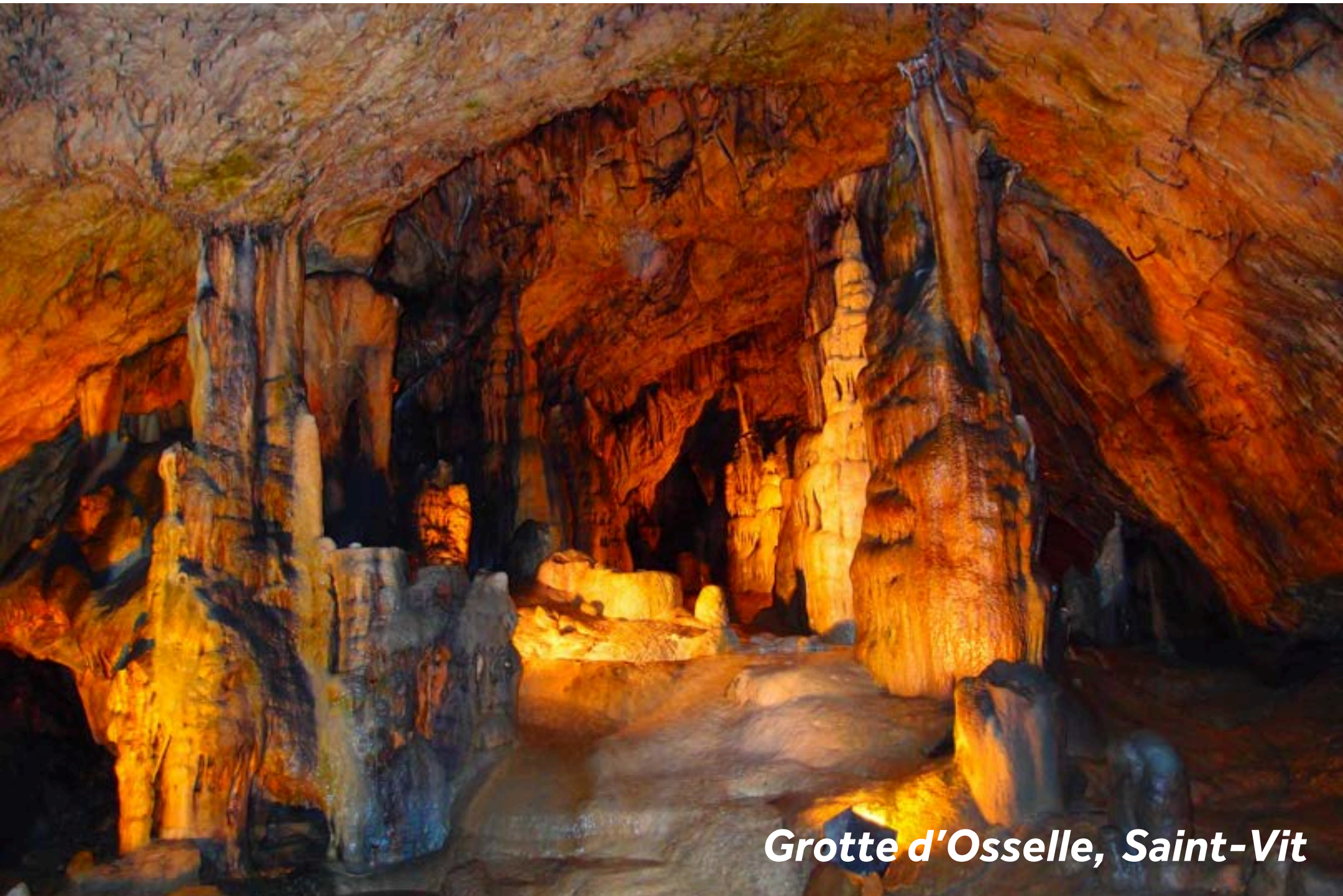
Grotte d'Osselle, Saint-Vit

Faites une halte ici pour faire le plein de provisions au supermarché et pour partir à la découverte de la grotte d'Osselle (à 3km de l'amarrage). Empruntez les galeries aménagées pour admirer la variété de ses cristallisations et ses couleurs exceptionnelles, ses stalactites, ses stalagmites et autres curiosités géologiques. Près de la rivière Doubs, il y a un lac avec une plage de sable, un toboggan, une aire de jeux pour enfants et des terrains de volley et de pétanque.