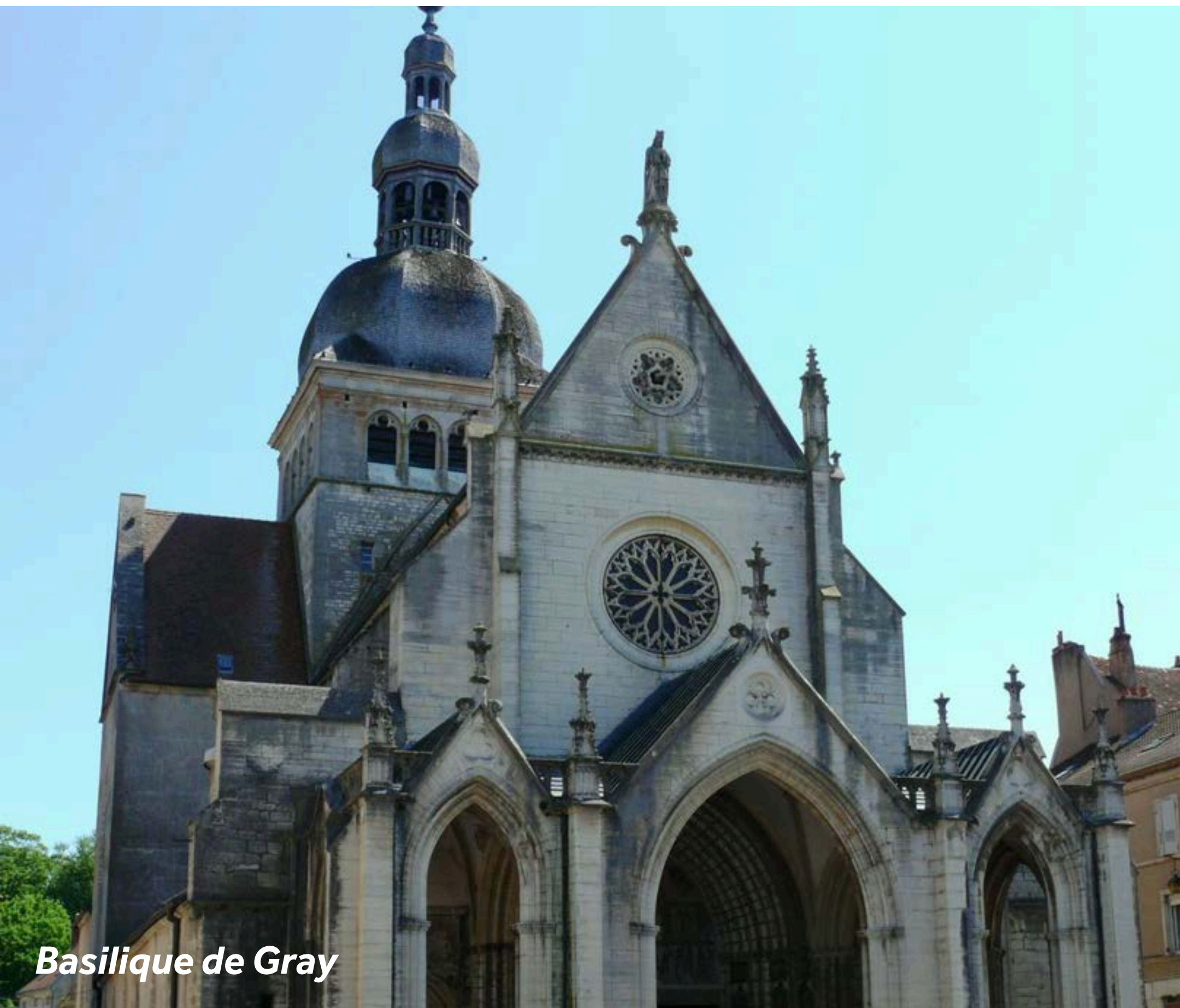
Basilique de Gray

La ville mérite une visite à pied, seul ou guidée par l'Office de Tourisme. Découvrez son remarquable patrimoine architectural : la basilique, le château, le théâtre à l'italienne, l'Hôtel de Ville avec sa toiture de tuiles vernissées, les cadrans solaires, et pour finir les ruelles étroites et escarpées qui mènent à la basse ville. Le musée d'art et d'archéologie Baron Martin présente une riche collection de peintures et de sculptures allant du Moyen-Age au début du XXe siècle. Il y a des activités pour toute la famille ici : équitation, canoë-kayak, piscine avec sa plage herbeuse. De l'autre côté de la Saône, en face de Gray, se trouve Arc-lès-Gray. Promenez-vous ou allez pique-niquer au parc de Lamugnière et découvrez sa grotte, sa serre et son orangerie.