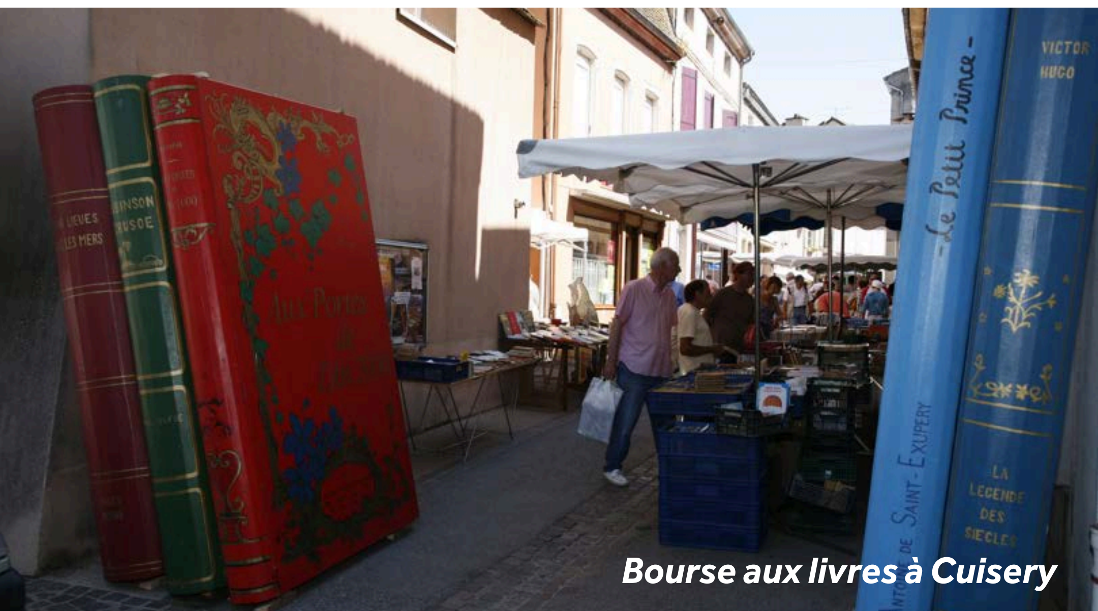
Bourse aux livres à Cuisery

Sur votre chemin pour Cuisery, faites un stop à Ratenelle si vous voulez faire un tour à la Ferme du Champ Bressan. Ce corps de ferme de 1930 n'a pas changé depuis 80 ans (situé à 5km de l'amarrage de Romenay). Cuisery compte une dizaine de librairies et fait partie des quatre "Villages du Livre" de France. L'Espace Gutenberg donnent des explications et fait une démonstration d'imprimerie à l'ancienne. Du haut de la colline où se trouve le village, admirez la vue sur la vallée de la Bresse. Le moulin Biscuisery, en bordure de rivière, vous invite à l'heure du thé pour une pause détente.