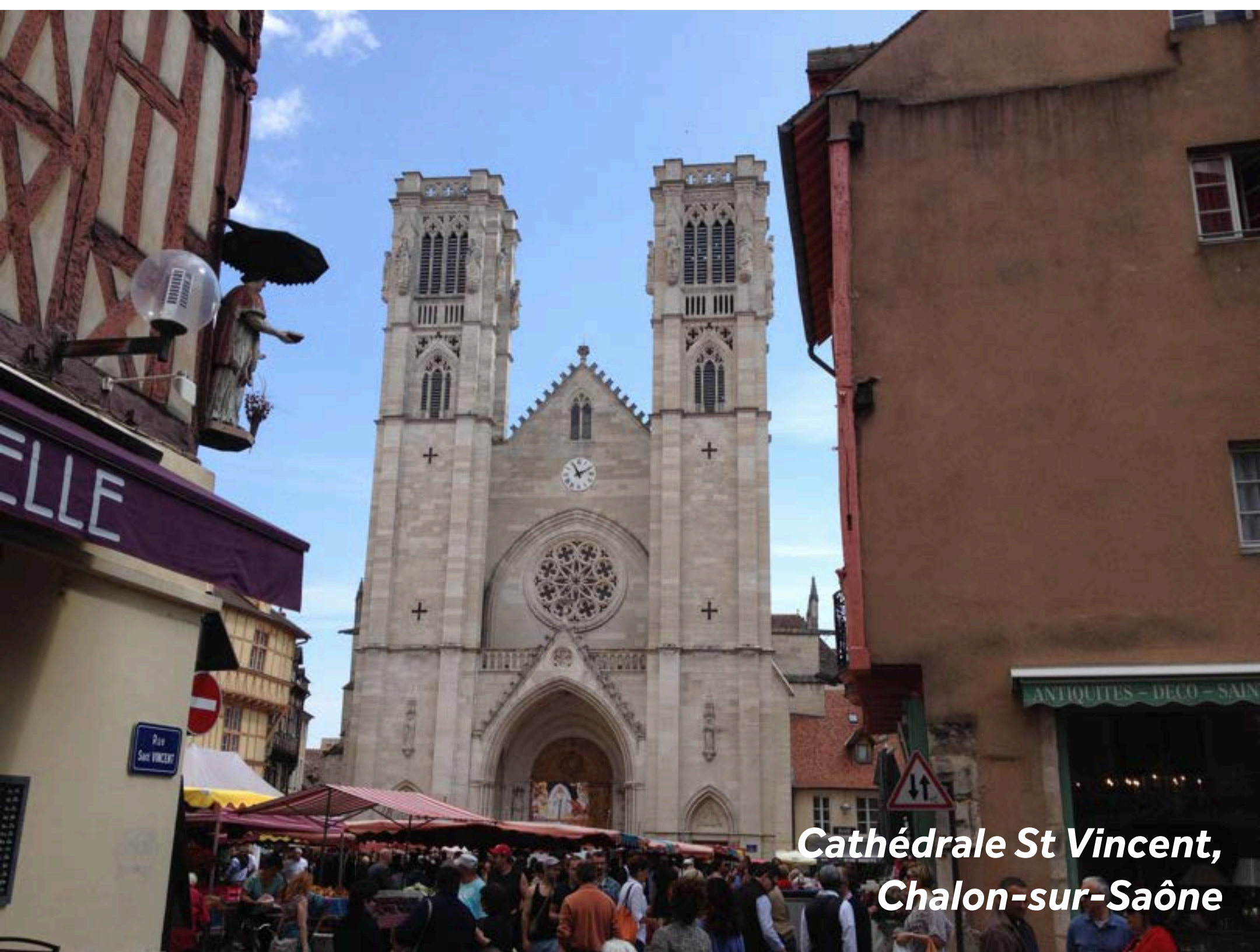
Cathédrale St Vincent, Chalon-sur-Saône

Architecturalement, Chalon-sur-Saône est un régal pour les yeux ! Le centre-ville regorge de maisons à colombages, de tours et tourelles, de fortifications et de bastions du XVI e siècle. Parmi les incontournables, on peut citer l'hôpital de l'île St-Laurent et sa chapelle, ainsi que le palais épiscopal datant du XV e siècle. La très belle place de la cathédrale est bordée de cafés, restaurants et antiquaires. Le fascinant musée dédié à l'inventeur de la photographie, Nicéphore Niépce, présente les premiers appareils photo et les premières photographies en couleur. À la pâtisserie L'Ambroisie, vous pourrez apprendre à faire de la pâte à choux, des éclairs au chocolat ou des macarons (sur réservation au +33 (0) 85 48 09 88).