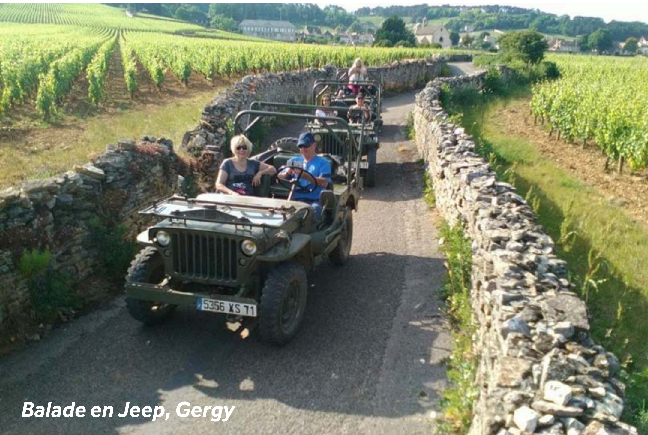
Balade en Jeep, Gergy

Si vous vous arrêtez à Gergy, marchez jusqu'à l'église St-Germain. Pour une église de campagne relativement modeste, la sculpture et l'ornement sont un vrai régal. La fromagerie du Meix Lantin vend du fromage de chèvre exquis. Bourgogne Jeep Découverte vous propose une expérience unique : conduisez une Jeep d'époque à travers le vignoble de Beaune accompagné d'un guide qui vous commentera la beauté des paysages (+33 (0) 6 81 27 69 40).