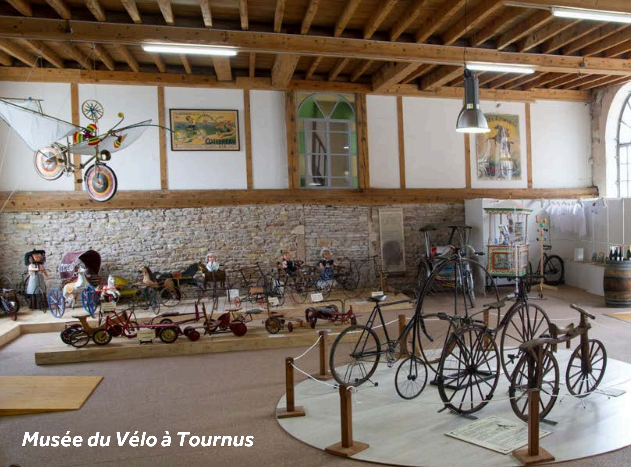
Musée du Vélo à Tournus