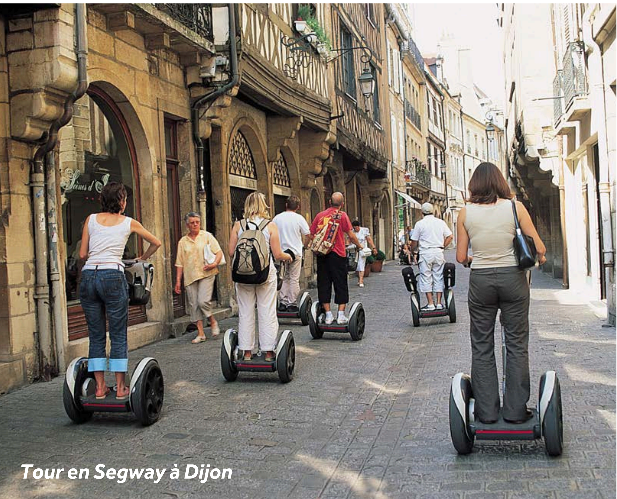
Tour en Segway à Dijon

Port : eau, électricité, sanitaires, douches, laverie, wifi.