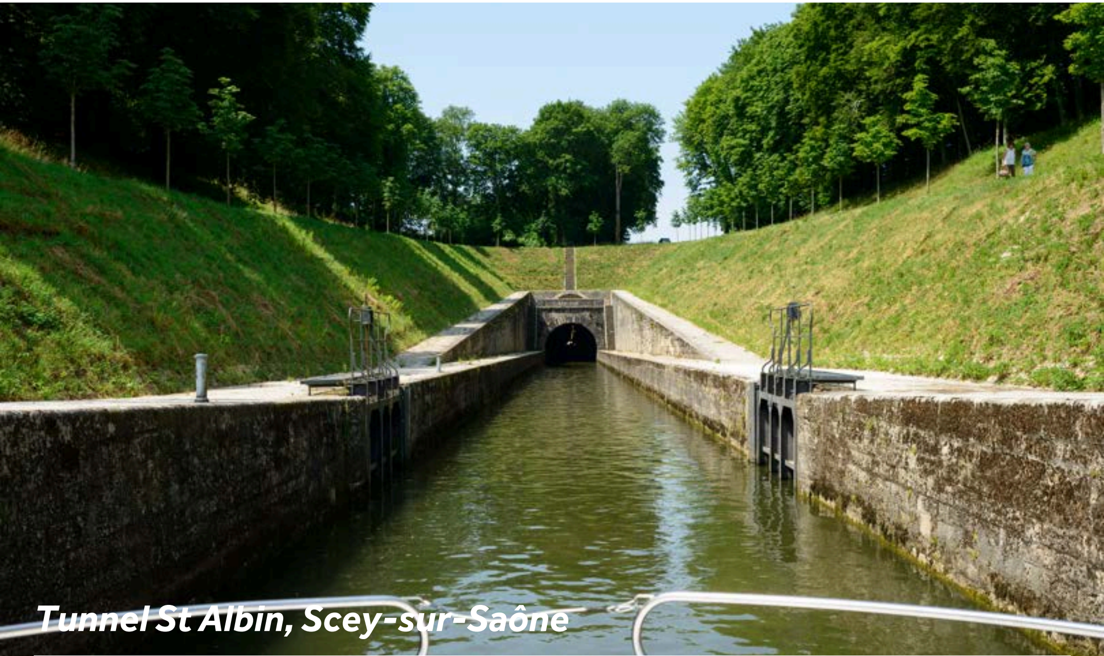
Tunnel St Albin, Scey-sur-Saône

Ici on trouve l'un des ouvrages les plus remarquables de la Saône : le canal souterrain de St-Albin (681m de long). Il fut commandé par Napoléon pour connecter les deux bras de la Saône. Montez à dos de cheval ou de poney pour une balade dans le parc de l'ancien château de Scey au milieu des daims. Sur place, il y a aussi une mini-ferme avec des chèvres, des lapins, des poules et même des kangourous, pour le plus grand plaisir des enfants.