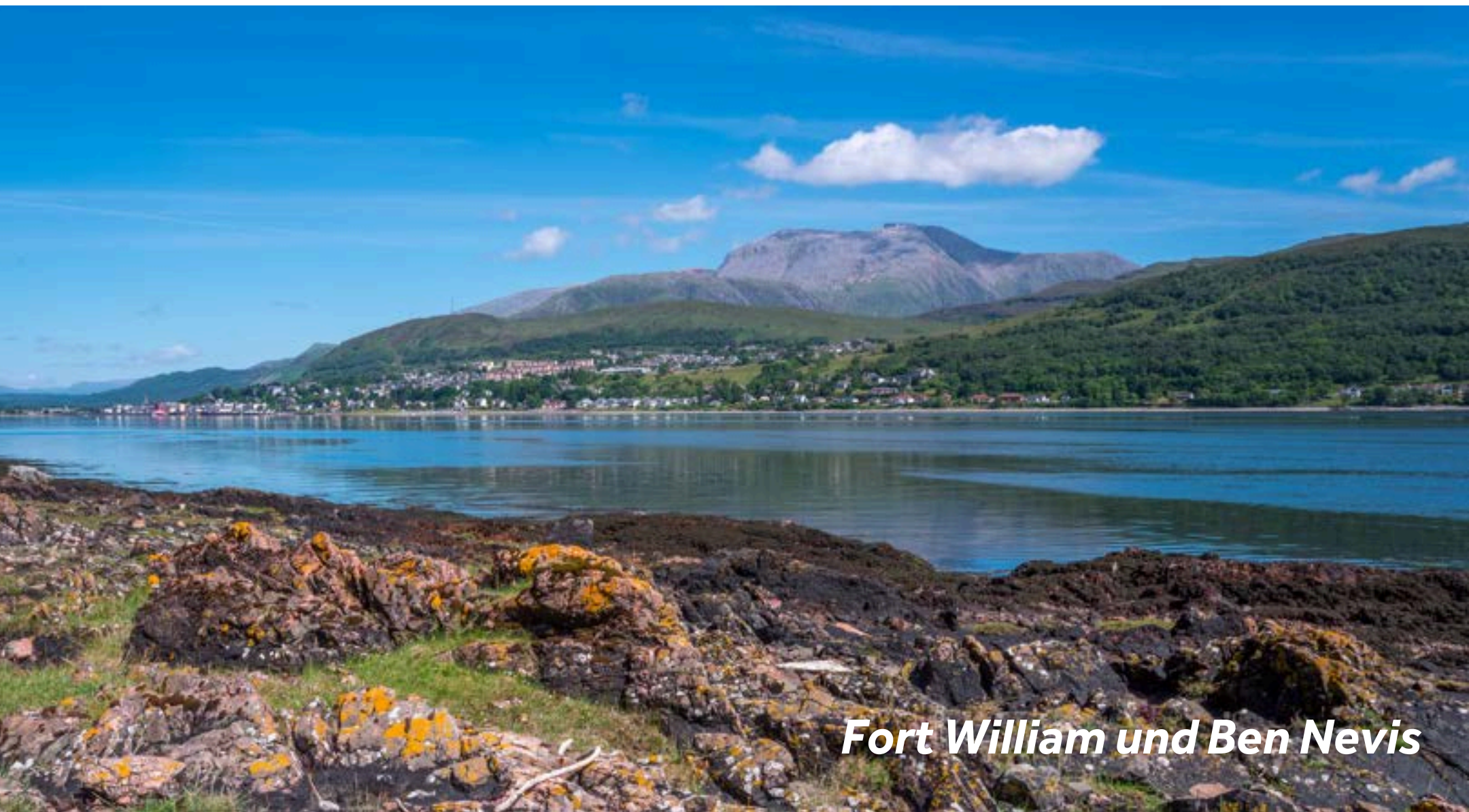
Fort William und Ben Nevis

Alle 15 Minuten fährt von Banavie ein Bus nach Fort William (ca. 10 Minuten Fahrt). Fort William ist als Outdoor-Hauptstadt Großbritanniens bekannt und bietet eine Vielzahl an Outdoor-Aktivitäten – allen voran den Aufstieg auf den höchsten Berg Großbritanniens, Ben Nevis. Sollte der Aufstieg zu anstrengend erscheinen (empfohlen nur für geübte Wanderer mit entsprechender Ausrüstung), können Sie stattdessen die Gondel (ca. 15 Minuten) zum Gipfel des nahegelegenen Aonach Mor nehmen, dem achthöchsten Berg Großbritanniens. Von dort genießen Sie atemberaubende Ausblicke auf den Ben Nevis, den Great Glen und die umliegenden Schottischen Highlands. Die Betreiber der Gondelbahn, die Nevis Range, bieten zudem viele andere Aktivitäten, darunter einen Hochseilgarten, eine 40m lange Sommerrodelbahn, Gleitschirmfliegen, Waldwandern, Mountain Biking und vieles mehr!