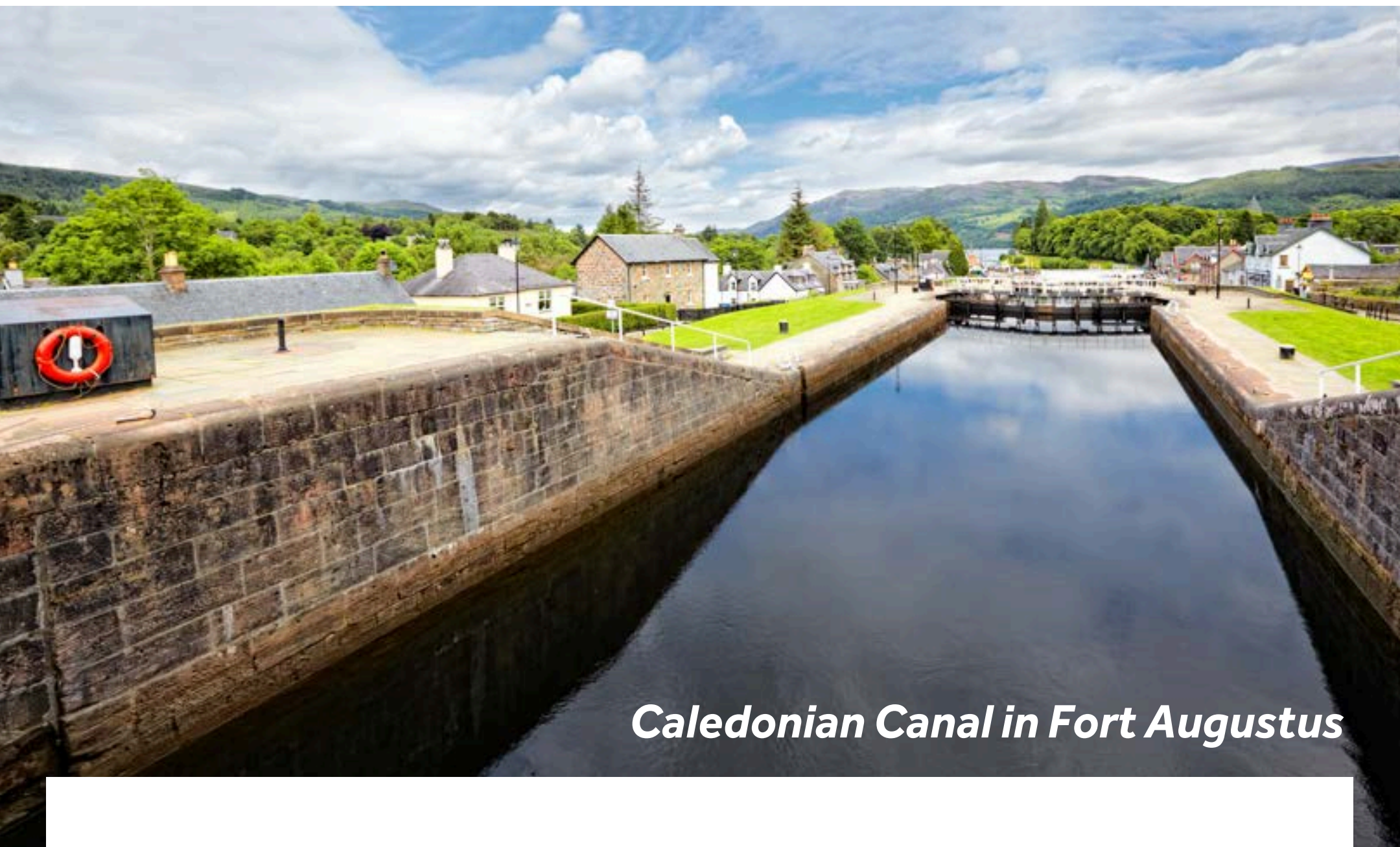
Caledonian Canal in Fort Augustus

Fort Augustus ist wohl die malerischste Stadt entlang des Weges. Hier gibt es viel zu entdecken. Es dauert circa eine Stunde, die fünfstufige Schleusentreppe zu passieren. Planen Sie also ausreichend Zeit dafür ein. Am Fuße der Schleusentreppe können Sie die Gläsbläserei "Iceberg Glass" besuchen - bestaunen Sie die Glasbläser bei der Arbeit und erwerben Sie ein paar einzigartige Souvenirs. Statten Sie dem Caledonian Canal Heritage Centre einen Besuch ab, wenn Sie mehr über die Geschichte des 200 Jahre alten Kanals erfahren möchten. Im berühmten Clansman Center werden Ihnen Vorführungen von Schauspielern in traditioneller Highland-Bekleidung geboten und Sie erhalten einen Einblick in den schottischen Alltag des 18. Jahrhunderts. Sie können zudem das Geschäft für keltisches Kunsthandwerk besuchen. Aber auch Sportbegeisterte kommen hier nicht zu kurz: Die Stadt ist ein wahres Paradies für Wanderer und Radfahrer.