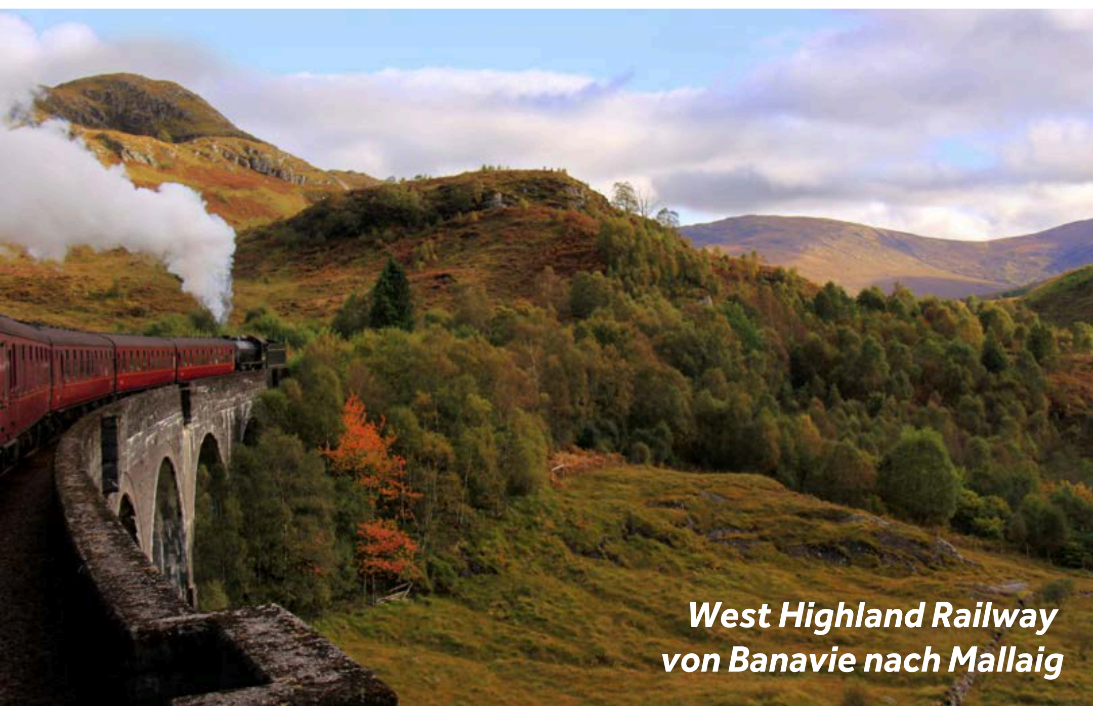
West Highland Railway von Banavie nach Mallaig

Harry Potter Fans werden den von Fort William nach Mallaig fahrenden Jacobite-Dampfbzug lieben. Er wurde in der Filmreihe als Hogwarts Express verwendet und bietet auf seiner 135 km langen Strecke atemberaubende Ausblicke. Eine frühzeitige Reservierung wird dringend empfohlen, da die Züge in der Saison stark nachgefragt sind! Alternativ können Sie die gleiche Strecke auch mit dem Dieselpzug zurücklegen, der in Banavie startet (weitere Informationen finden Sie unter www.westcoastrailways.co.uk ).