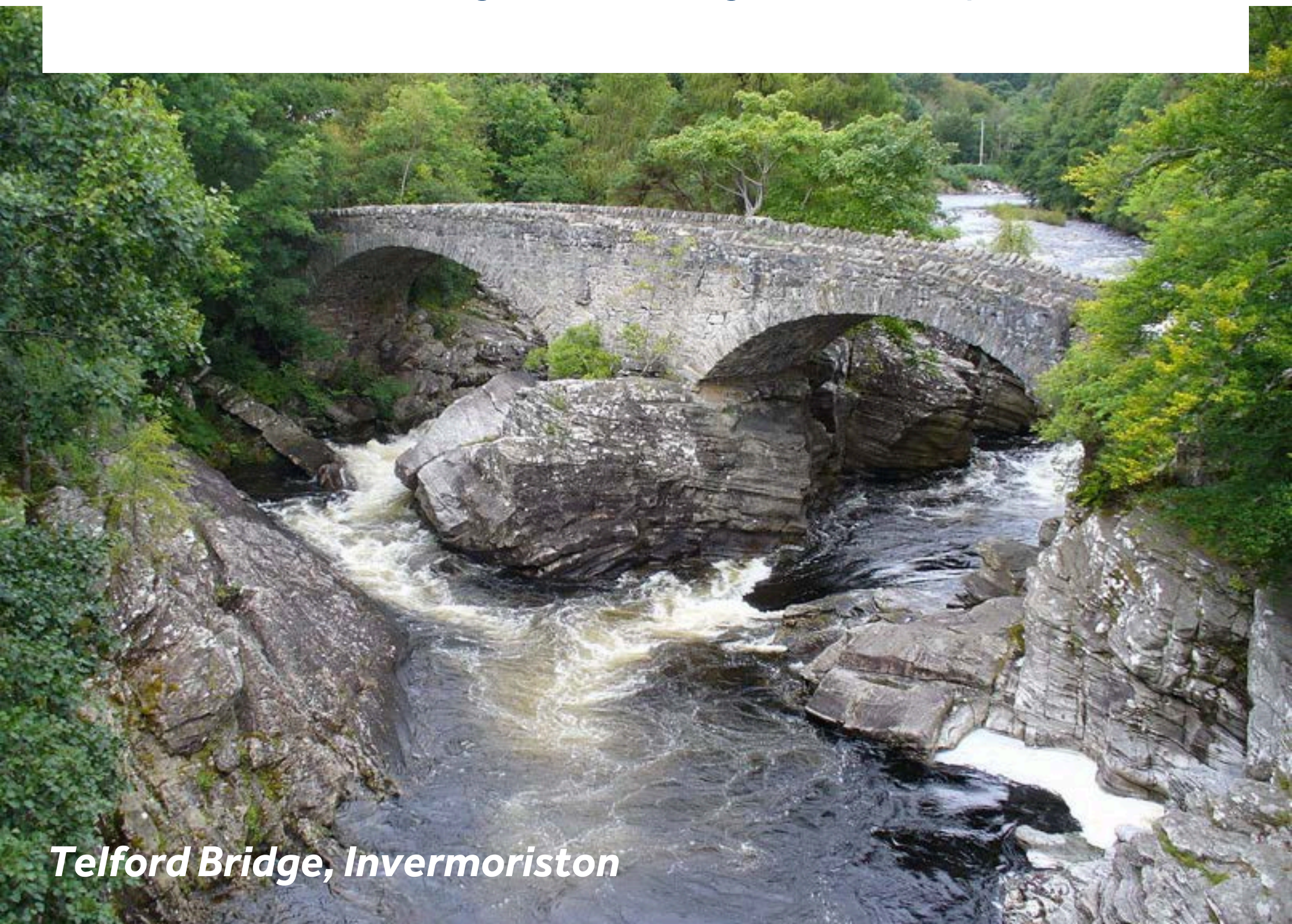
Telford Bridge, Invermoriston

Per Bus gelangen Sie in 10 Minuten nach Invermoriston, direkt am Ufer des Loch Ness gelegen. Leider befinden sich dort keine Anleger - das schöne Dorf kann daher nicht per Boot besucht werden. Die vom berühmten Ingenieur Thomas Telford im Jahre 1813 erbaute Brücke ist der Stolz des ganzen Dorfes. Die St. Columba Quelle soll im Jahre 565 vom irischen Heiligen Columba gesegnet worden sein. Die Einheimischen schreiben ihr Heilkräfte zu und hinterlassen als Zeichen der Dankbarkeit kleine Gaben neben der Quelle. Souvenirs gibt es im Clog & Craft Shop.