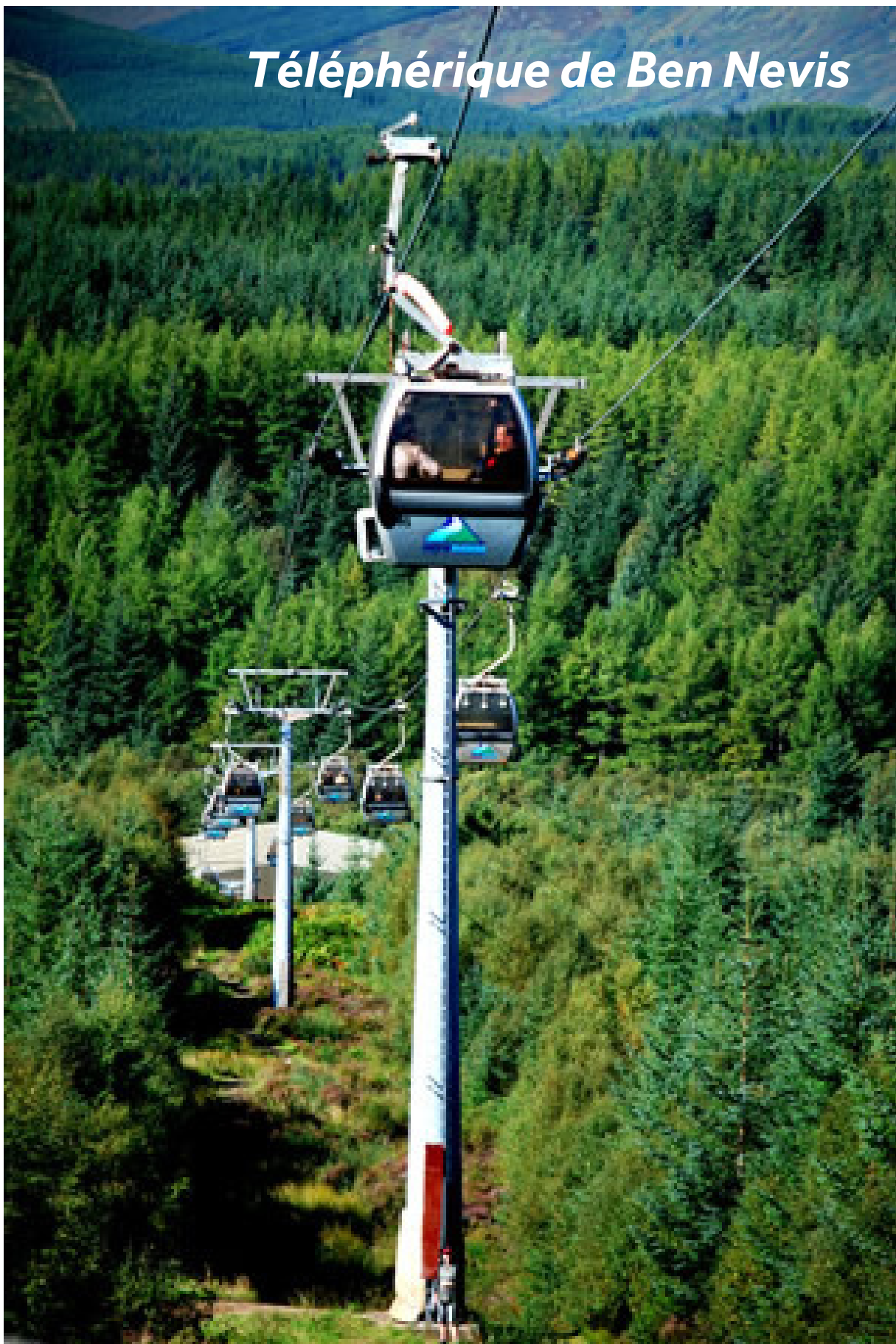
Téléphérique de Ben Nevis

De retour en ville, le Nevis Centre (+44 (0)1397 700707) offre une aire de jeux pour enfants, du bowling à dix quilles et du karting. Vous pouvez aussi en apprendre davantage sur cette région fascinante au Musée West Highland. Pour les amateurs d'escalade, le Lochaber Leisure Centre propose un mur d'escalade, suivi d'une piscine et d'un sauna. Terminez