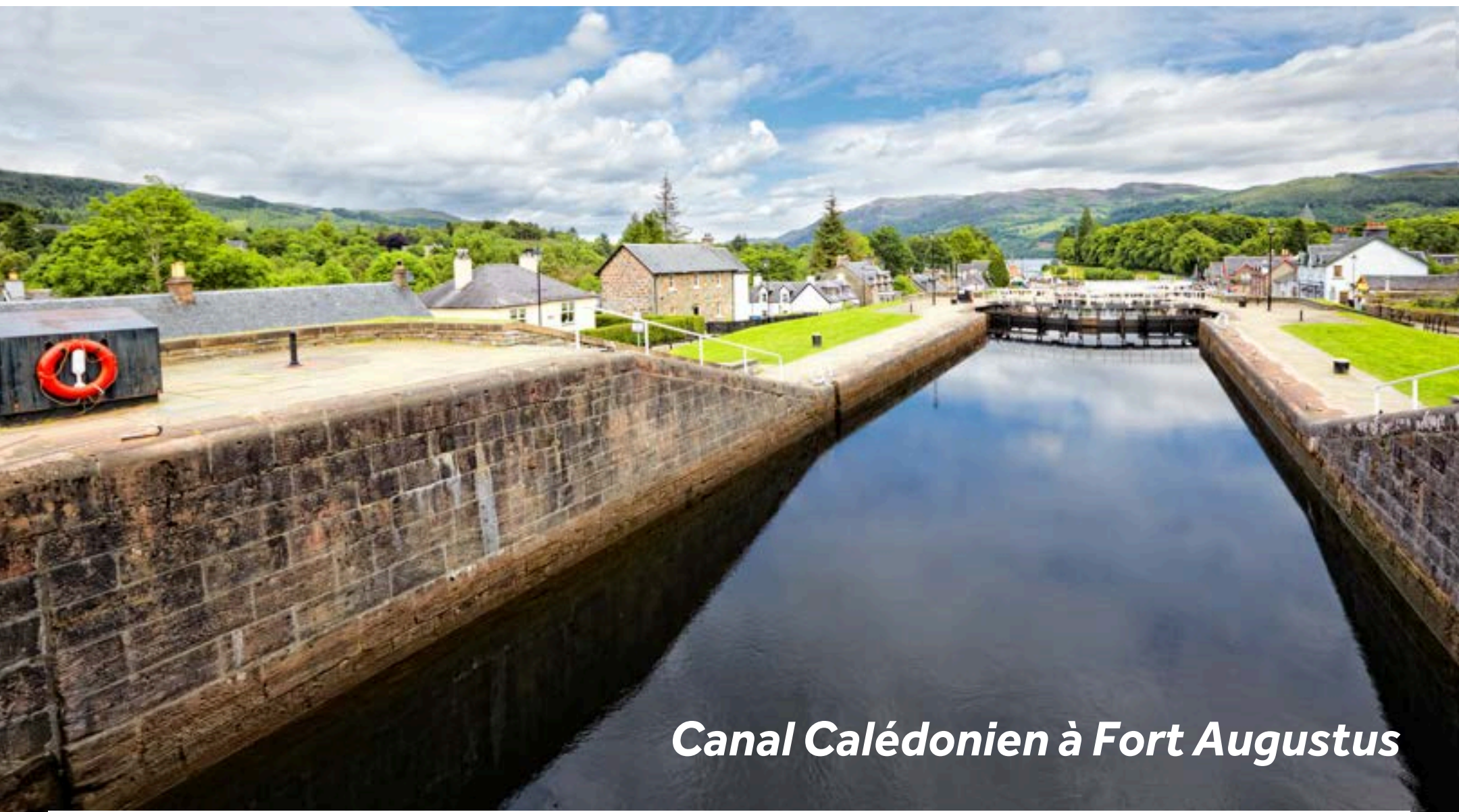
Canal Calédonien à Fort Augustus

Fort Augustus est sans doute l'une des escales les plus pittoresques le long du canal, avec de nombreuses activités à découvrir. Le passage de la succession de cinq écluses à l'approche sud prend environ une heure, pensez donc à prévoir suffisamment de temps et à arriver en avance. Près du bas des écluses, faites un arrêt chez Iceberg Glass pour trouver de superbes souvenirs et observer la fabrication du verre. Le Caledonian Canal Heritage Centre est un excellent lieu pour en apprendre davantage sur l'histoire de ce canal vieux de 200 ans, tandis que le Clansman Centre est l'une des attractions les plus uniques de Fort Augustus. Vous y assisterez à des démonstrations en direct par des acteurs en costume traditionnel des Highlands, découvrant la vie au XVIIIe siècle en Écosse. Vous y trouverez également une belle boutique d'artisanat celtique. La ville est un paradis pour les marcheurs et cyclistes, avec de nombreux sentiers dans la région, dont le plus populaire est le Great Glen Way.