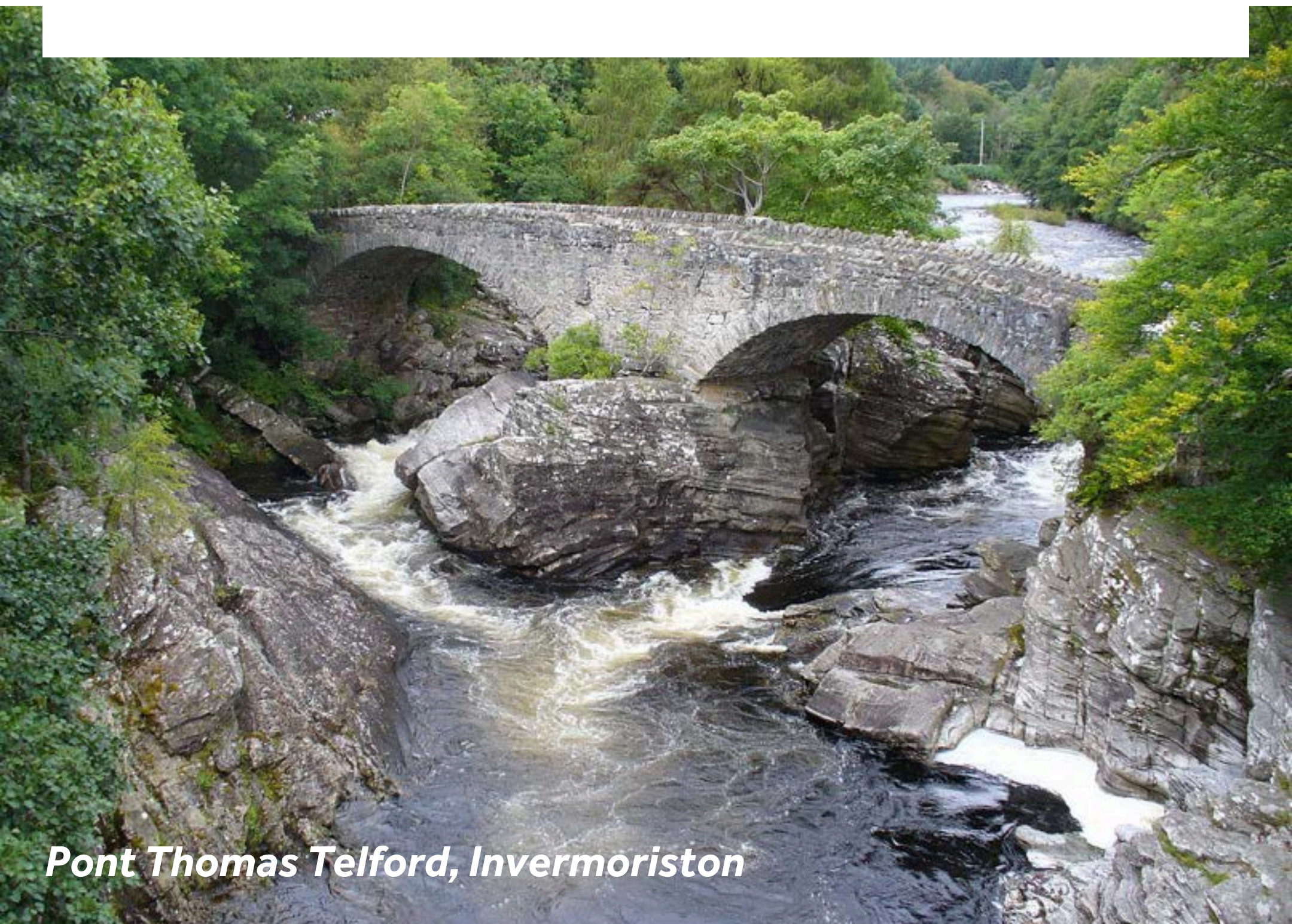
Pont Thomas Telford, Invermoriston

À 10 minutes de bus se trouve Invermoriston, situé sur les rives du Loch Ness, mais il n'y a pas de quai pour s'y amarrer en bateau. Ce charmant village est une halte agréable. Le pont, construit par le célèbre ingénieur Thomas Telford en 1813, est la star de ce village pittoresque. Prenez un court trajet en bus pour le découvrir par vous-même. Le puits de Saint Columba serait béni par le saint irlandais en 565 après J.-C. Les habitants lui attribuent des pouvoirs de guérison, et de petites offrandes sont laissées près de la source en signe de gratitude. La boutique Clog & Craft est l'endroit parfait pour acheter des souvenirs.