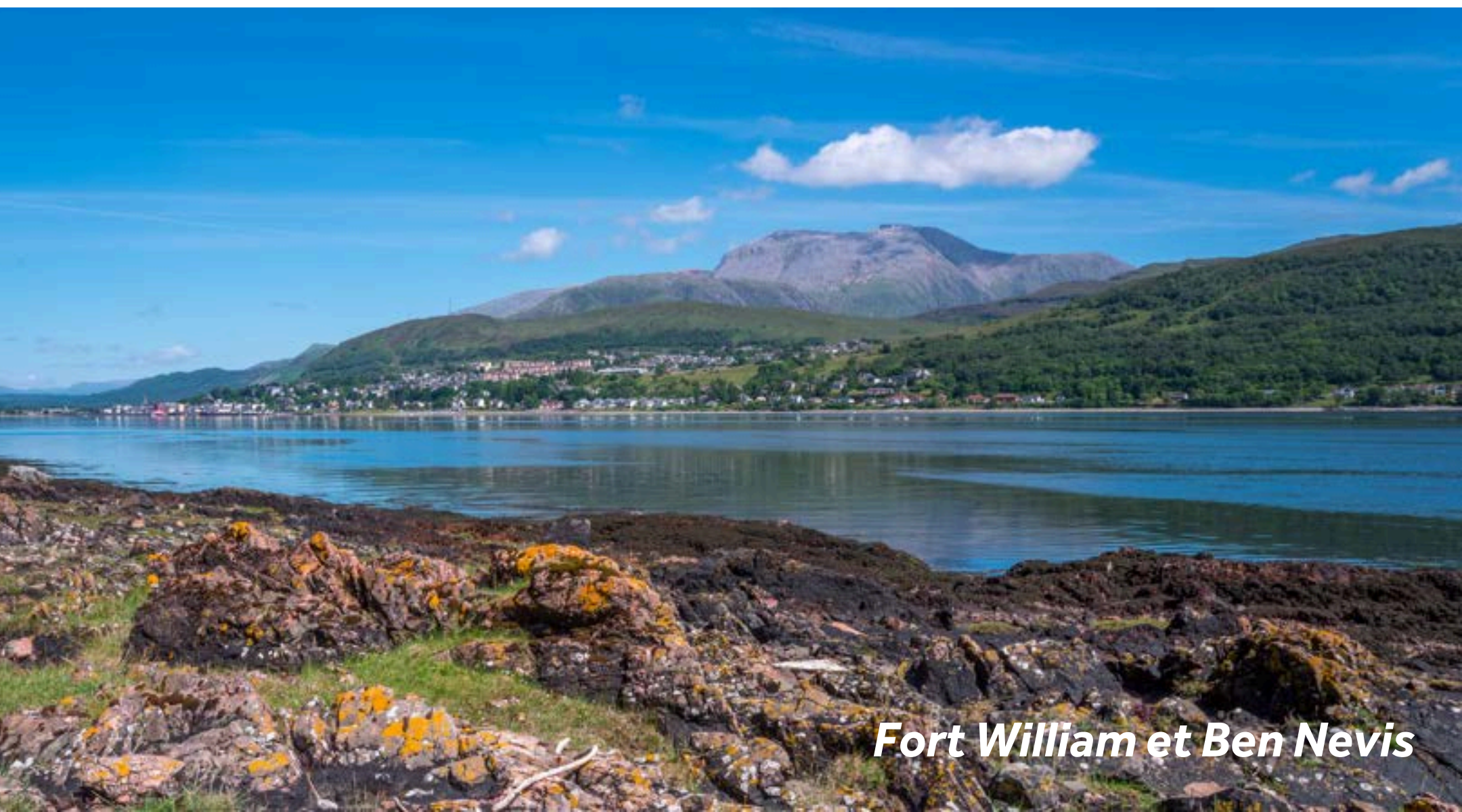
Fort William et Ben Nevis

À seulement 10 minutes de bus de Banavie (avec des bus toutes les 15 minutes en journée) se trouve Fort William.