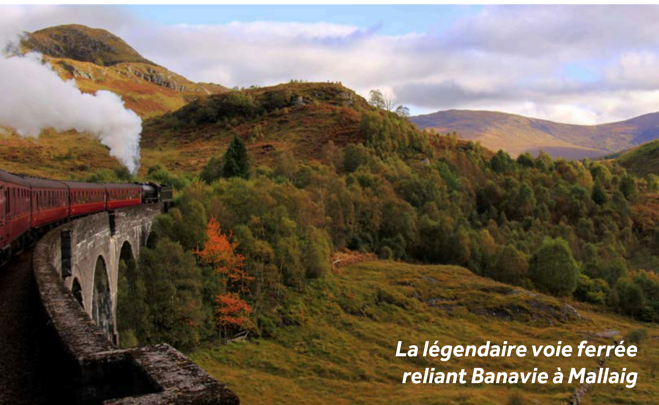
La légendaire voie ferrée reliant Banavie à Mallaig

Les fans d'Harry Potter adoreront le train à vapeur Jacobite, utilisé comme le Poudlard Express dans la saga cinématographique. Il parcourt la ligne West Highlands Railway jusqu'à Mallaig et retour, offrant des paysages à couper le souffle sur un trajet aller-retour de 135 km. Il est conseillé de réserver à l'avance, car ce service est très fréquenté en haute saison ! Pour une alternative, vous pouvez effectuer le même trajet à bord du train diesel qui démarre à Banavie. Plus d'informations sont disponibles sur www.westcoastrailways.co.uk .