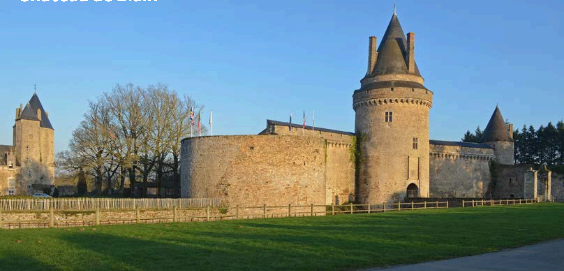
Château de Blain