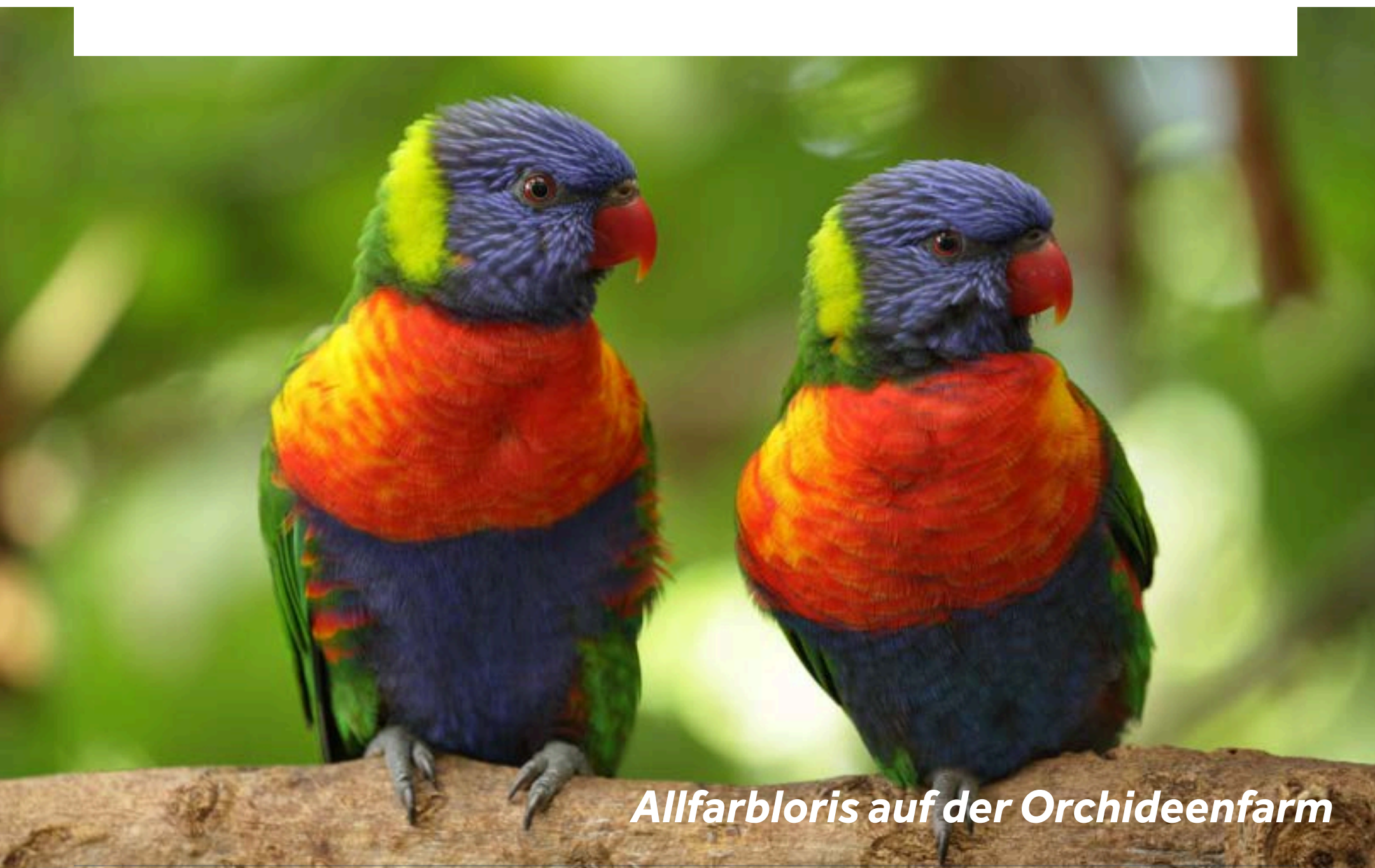
Allfarbloris auf der Orchideenfarm

Die sich in Luttelgeest befindende Orchideenfarm (Orchideeënhoeve) ist ein absolutes Muss auf dieser Strecke. Die vielen wunderbaren Orchideen und Schmetterlinge sind eine Augenweide. Schlendern Sie durch den malaysischen Garten, dem Schmetterlingstal und dem neuen Lori-Garten voller farbenfroher Allfarblori. Kinder können sich auf dem Mangrovenspielplatz austoben.