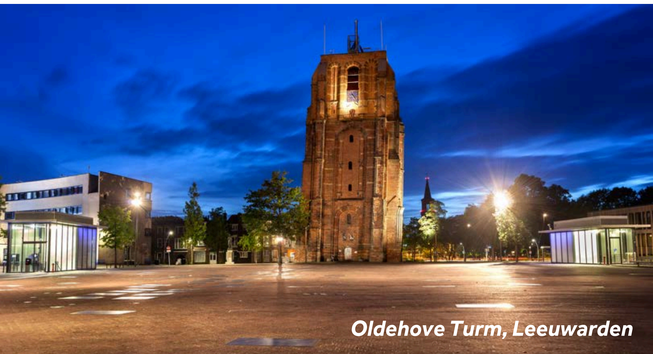
Oldehove Turm, Leeuwarden

Leeuwarden ist die Hauptstadt von Friesland. Hier gibt es viel zu sehen und zu erleben. Das Naturmuseum befindet sich in einem Gebäude aus dem 17. Jahrhundert und beherbergt Ausstellungen rund um das Thema Natur und Wildtiere. Frieslands Rinderrasse ist in der ganzen Welt bekannt. Bis heute finden der Viehmarkt (freitags) und die alljährliche Viehausstellung regelmäßig statt. Der Oldehover Kirchturm (der noch stärker geneigt ist als der schiefe Turm von Pisa) bietet eine ungestörte Aussicht auf die umgebende Landschaft, sobald Sie seine 183 Stufen erklommen haben.