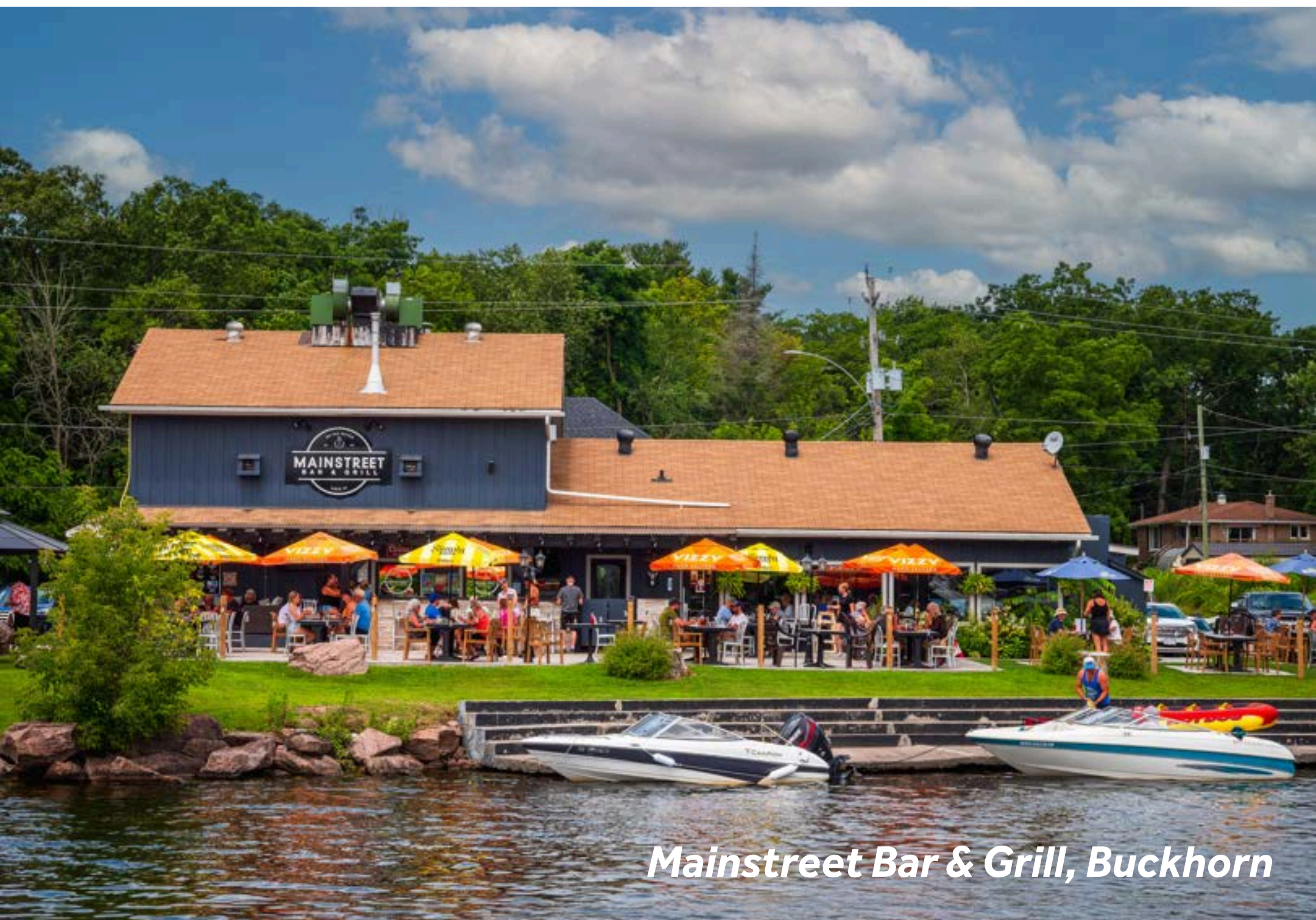
Mainstreet Bar & Grill, Buckhorn

Lower Buckhorn poursuit la beauté des paysages de Lovesick. Sur la rive nord, on trouve des rochers de granite lisses et de grands pins. Sur la rive sud, les collines calcaires s'étendent et abritent les nids des urubus à tête rouge, que l'on peut parfois voir près de l'entrée nord-ouest de Deer Bay.