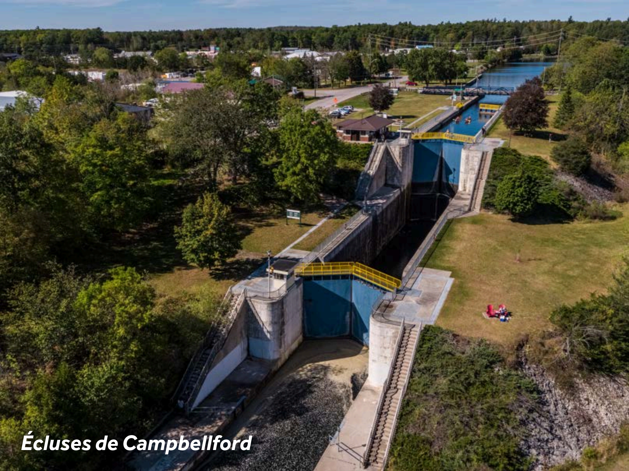
Écluses de Campbellford

Elle fête ses 75 ans en 2024 et a souvent été nommée meilleure boulangerie sucrée au Canada. Allez-y tôt, c'est très populaire !