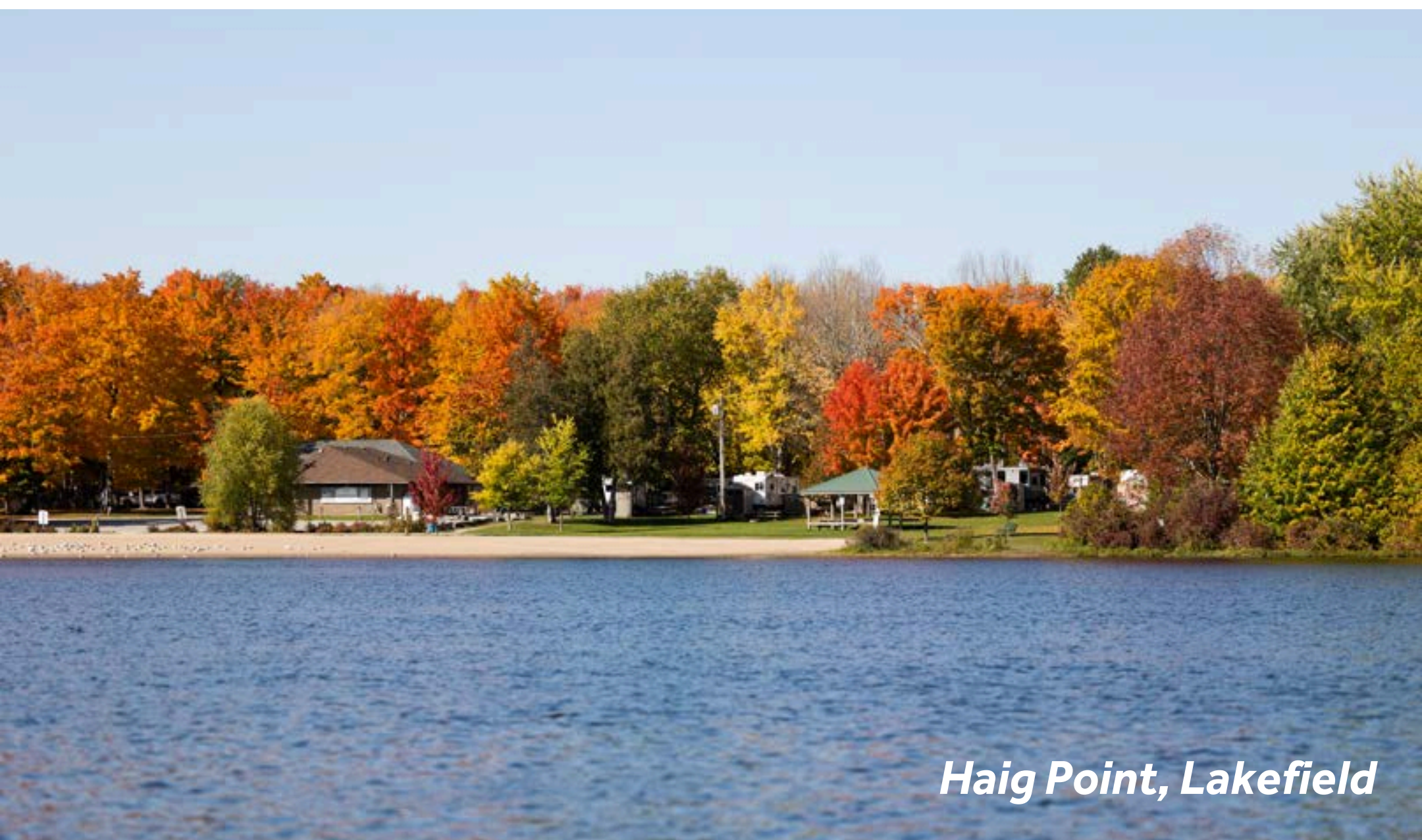
Haig Point, Lakefield

Marché fermier : le jeudi, derrière la marina de Lakefield.