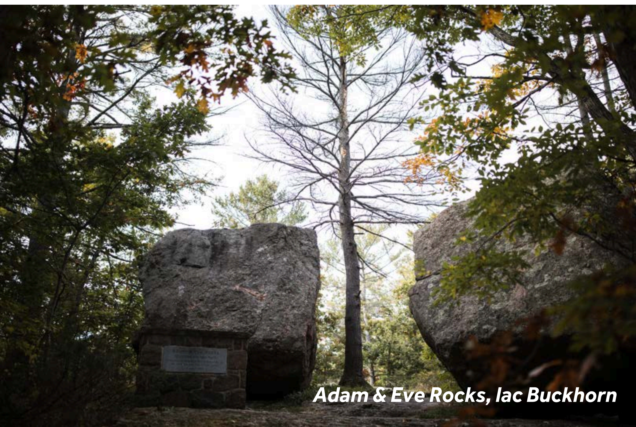
Adam & Eve Rocks, lac Buckhorn

Lovesick est un arrêt très apprécié pour la nuit grâce à son île tranquille, son emplacement isolé et ses beaux paysages. L'écluse n°30 est unique, perchée sur une île accessible seulement en bateau ; une rareté sur la voie navigable Trent-Severn. Son calme et son charme en font un endroit parfait pour se déconnecter. Les commodités se limitent à l'essentiel : toilettes, aire de pique-nique, glace et bois de chauffage. Un endroit simple et pittoresque offrant une véritable immersion en pleine nature.