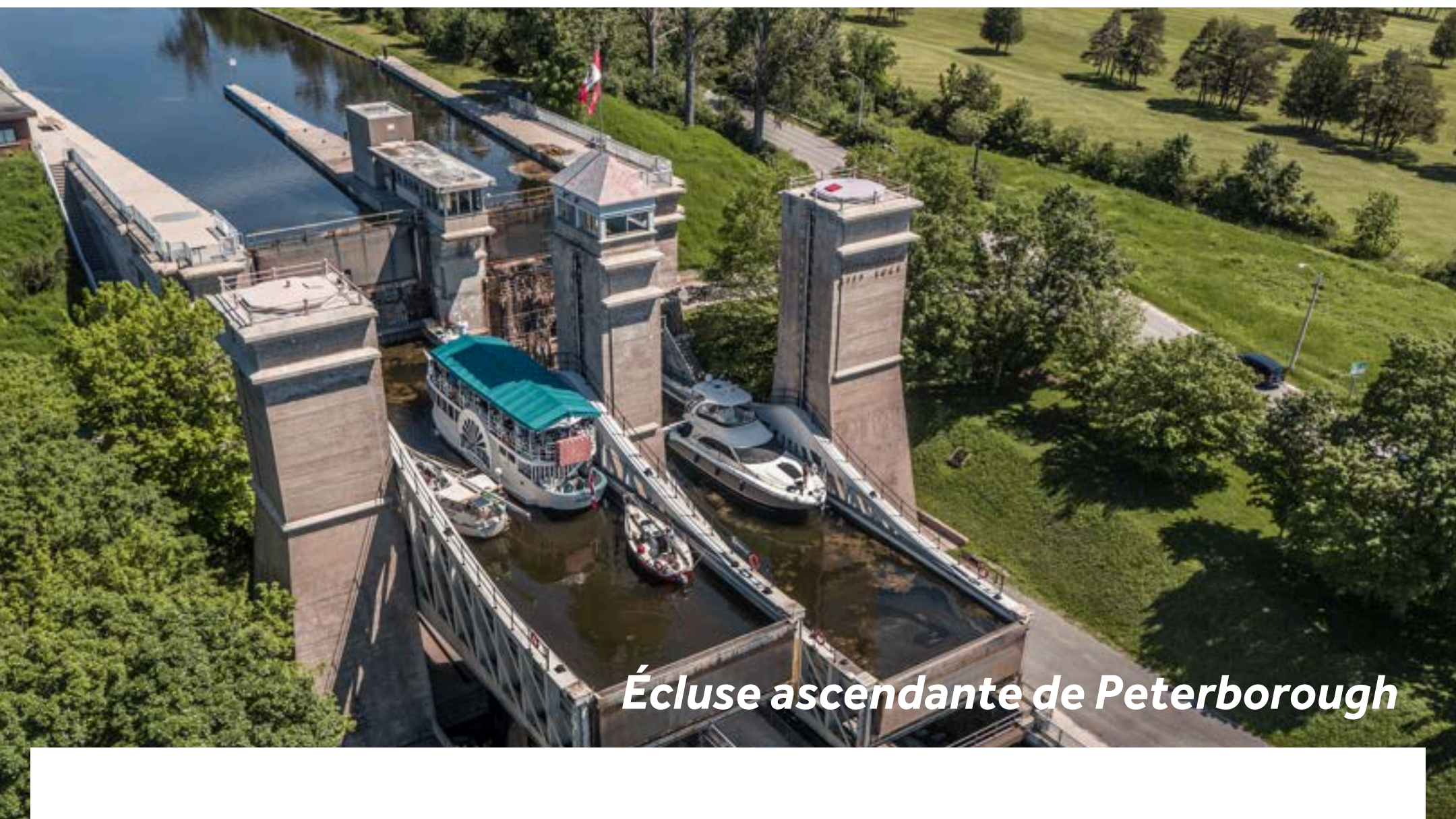
Écluse ascendante de Peterborough

Peterborough, fondée en 1820, offre une gamme complète de services et de commerces. La ville est rapidement devenue un lieu animé d'activités sociales et commerciales le long de la rivière Trent, et s'est fait connaître dans le monde entier pour ses canoës artisanaux. Depuis plus de 25 ans, le Musée canadien du canoë conserve la plus grande et la plus importante collection au monde de canoës, kayaks et embarcations à pagaie. Avec plus de 600 embarcations, ce musée offre un regard fascinant sur l'histoire, la culture et le savoir-faire liés aux voyages sur l'eau. Installé dans un cadre naturel remarquable en bordure de rivière, ce musée unique en son genre fait vivre le riche patrimoine canadien du pagayage. Louez un canoë ou faites une sortie en groupe dans un canoë de voyageur ; pensez à réserver pour la saison estivale. La ville regorge également de sites historiques, galeries d'art, parcs et autres musées.