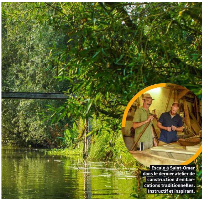
Escale à Saint-Omer dans le dernier atelier de construction d'embarcations traditionnelles. Instructif et inspirant.