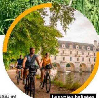
Les voies balisées de la Loire à Vélo permettent de sillonner la région tranquillement le long du fleuve.

Réputée sauvage, la Loire sait aussi se faire douce et accueillante. Sur une de ses rives fleuries d'iris, une toue cabanée est amarrée. Baptisée la Toue Reine, elle ondule au gré du clapotis et dispose d'une belle terrasse au ras des flots. Comme à l'époque de la marine fluviale, ce bateau à fond plat, tout de bois décoré, a gardé fière allure et offre une escale aussi paisible que vivifiante. Installée à l'entrée du port de Bréhémont, ancien village de mariniers, elle invite à prendre son temps, à regarder les libellules voler, à écouter le chant des grenouilles et à observer les étoiles depuis le pont. À quelques encablures, le château de Langeais élève ses tours aux toits d'ardoise, et celui de l'Islette propose des pique-niques-apéros-jazz dans le jardin. Nuit à partir de 160 € pour 2 personnes. labatelieresurloire.fr