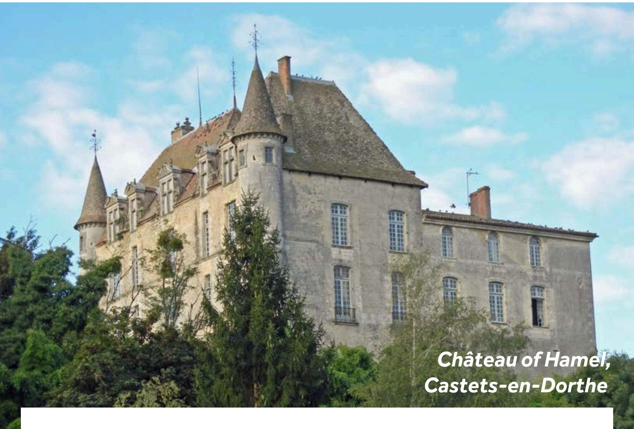
Château of Hamel, Castets-en-Dorthe

Schlendern Sie von der St. Louis Kirche auf dem Dorfplatz bis zur Promenade, wo Sie einen schönen Ausblick auf das Tal und die Kreuzung zwischen dem Kanal und der Garonne erhalten. Im Osten des Dorfes befindet sich noch ein zweites Gotteshaus, die St. Romain Kirche aus dem 11. Jahrhundert. Das Château du Hamel aus dem 16. Jahrhundert wurde im Jahr 1963 unter Denkmalschutz gestellt und befindet sich in Privateigentum. Bitte wenden Sie sich für eine Besichtigung an die Eigentümer (+33 6 64 33 79 74).