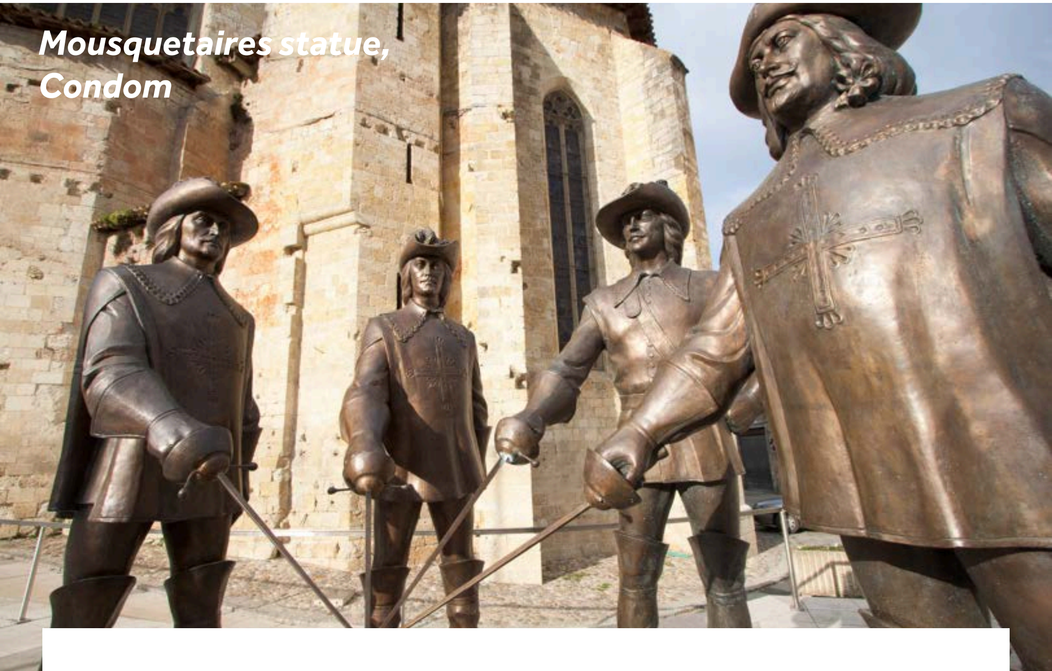
Mousquetaires statue, Condom

Entdecken Sie den oberen Teil der Stadt mit ihrer majestätischen Kathedrale St. Pierre und dem gotischen Kreuzgang. Auf dem Domplatz steht die Statue des berühmten Helden der Gascogne, D'Artagnan und seiner drei Musketiere. Vergessen Sie nicht, während Ihres Aufenthalts den lokalen Brandy, Armagnac, zu kosten. Das Maison Ryst-Dupeyron bietet Besichtigungen der Weinkeller und Verkostungen dieser lokalen Spezialität an. Sollte Ihnen nach einer Abkühlung sein, folgen Sie dem Treppenweg von der Anlegestelle in Richtung der Gauge Schleuse (1,5 km entfernt), um zu einem Schwimmbad zu gelangen.