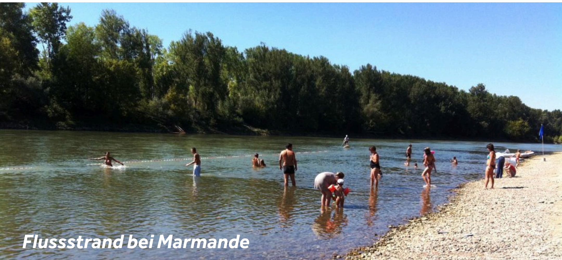
Flussstrand bei Marmande

Legen Sie am Ponton von La Grande Route an und fahren Sie mit dem Fahrrad die 6 km bis Marmande, Heimat der gleichnamigen Tomaten. Besuchen Sie das Marmande-Kloster aus dem 16. Jahrhundert und den anliegenden Garten, der im klassisch französischen Stil bepflanzt ist und zu Frankreichs "Jardins remarquable" gehört. Schlendern Sie entlang des Wehrgangs hinter der Kirche, wo Sie einige Überreste von Marmandes mittelalterlicher Festung entdecken können. Zum Abkühlen haben Sie die Wahl zwischen dem am Flussufer gelegenen Strand oder dem "Aquaval", einem kleinen Wasserpark mit Wellenbad, Kinderbecken und Rutsche.