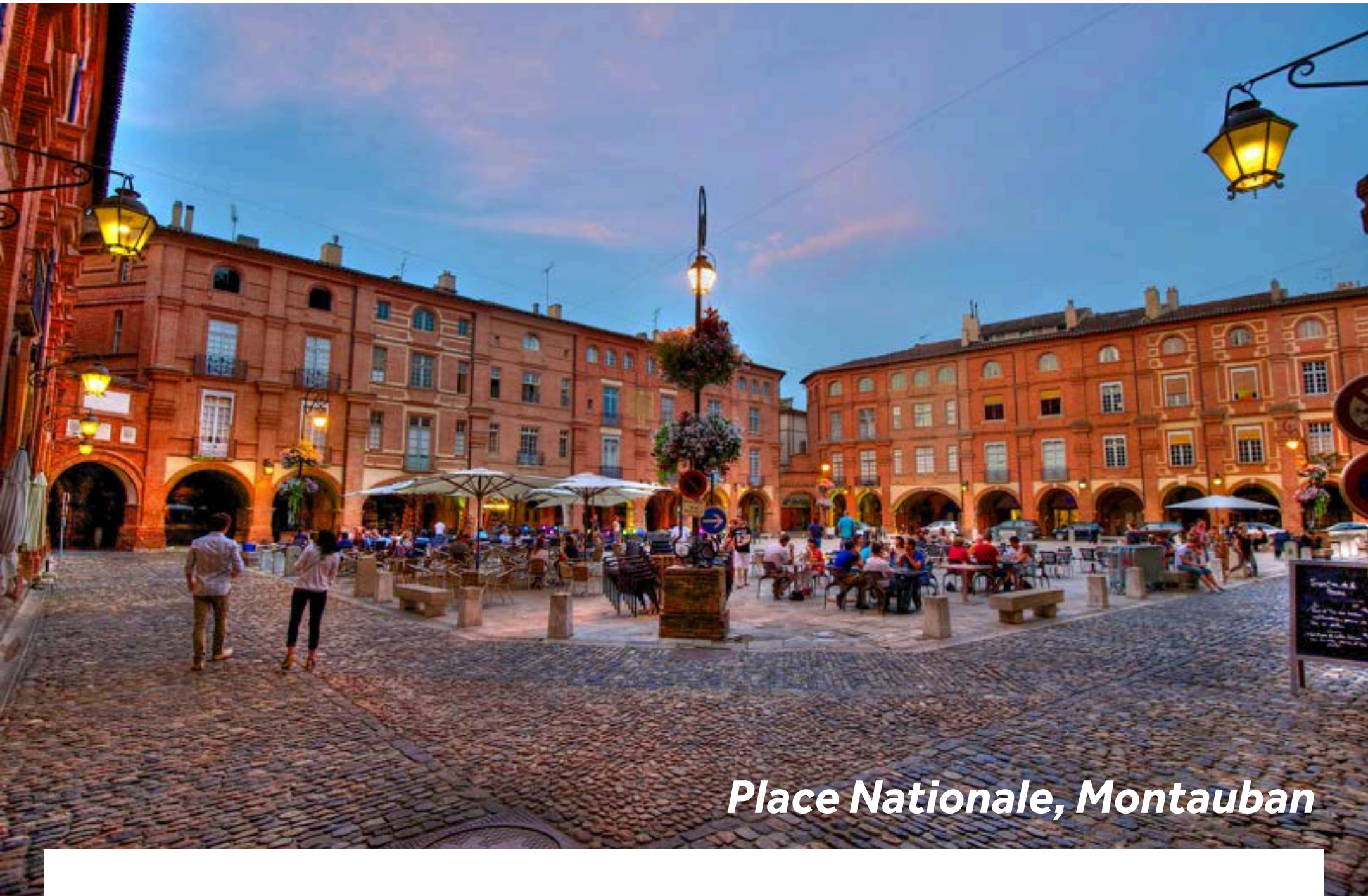
Place Nationale, Montauban

La Pente d'Eau de Montech est hors service, mais un projet est en cours pour la remettre en service. Vous devrez en attendant franchir les 5 écluses successives. Empruntez le Canal de Montech, long de 10km, si vous souhaitez découvrir Montauban. Cité au patrimoine exceptionnel, Montauban se pare de bijoux architecturaux tels que sa Place Nationale, sa cathédrale, ses hôtels particuliers et son Musée Ingres.