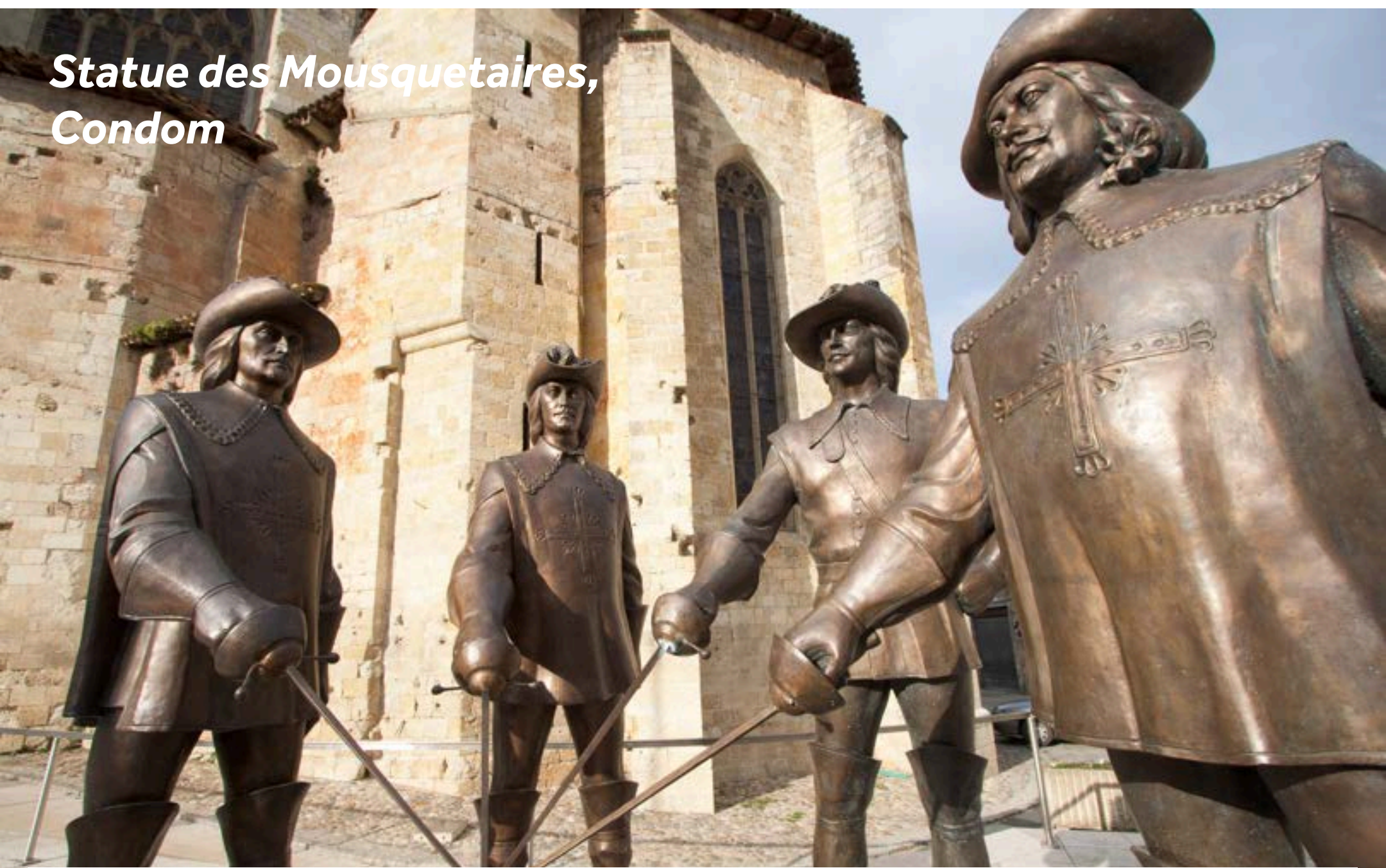
Statue des Mousquetaires, Condom

Partez à la découverte de la haute ville avec sa majestueuse cathédrale St-Pierre et son cloître. Sur la Place de la Cathédrale trône la statue du héros absolu des Gascons, D'Artagnan et ses trois mousquetaires. N'oubliez pas de déguster la boisson locale, l'Armagnac, lors de votre escale.