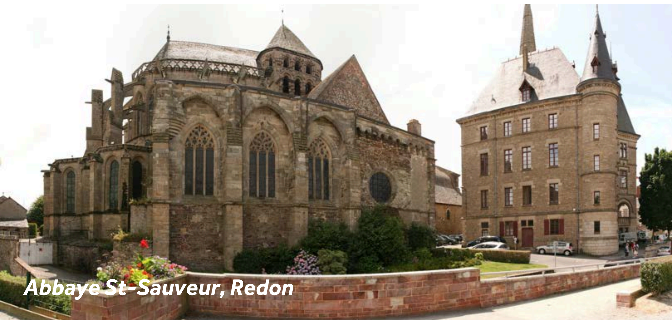
Abbaye St-Sauveur, Redon

Cité d'Histoire, Redon se trouve à la croisée de la Vilaine et du Canal de Nantes à Brest. Ce port maritime a connu de belles heures de gloire, comme en témoignent les très belles demeures d'armateurs, Quai Duguay-Trouin. Il fait désormais le bonheur des plaisanciers et des rameurs. L'attraction principale de Redon est son abbaye St-Sauveur, construite au IXe siècle.