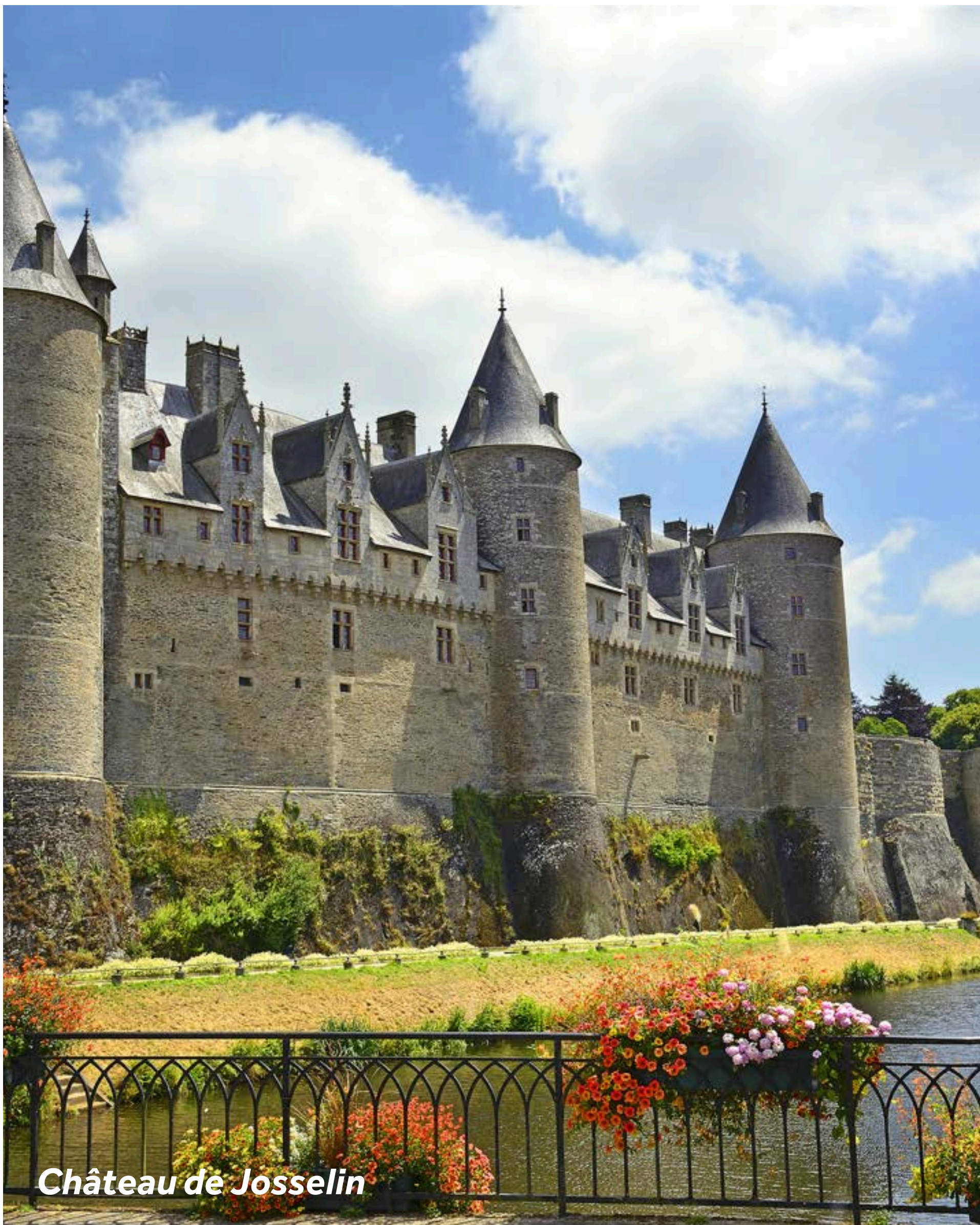
Château de Josselin