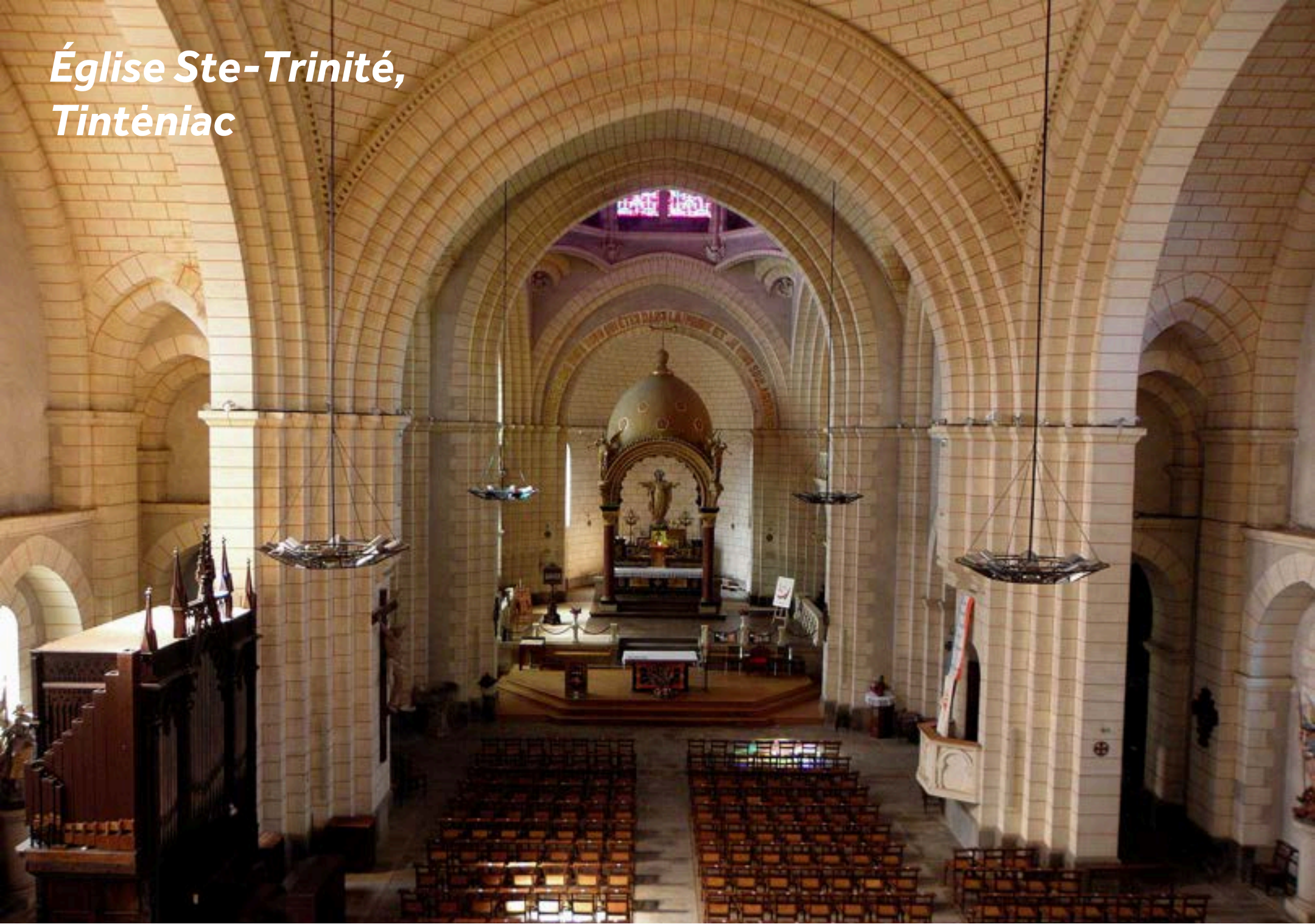
Église Ste-Trinité, Tinténiac