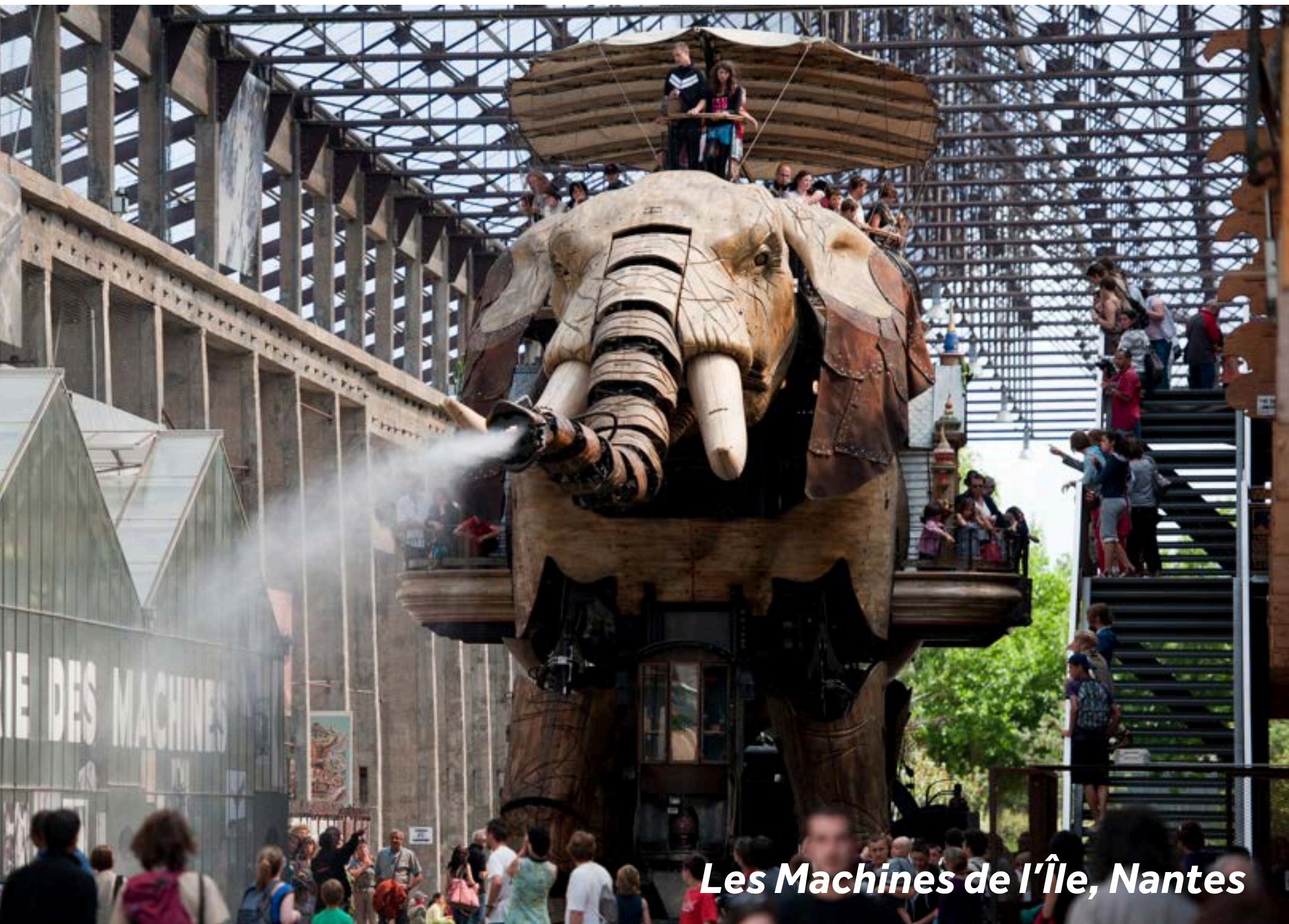
Les Machines de l'Île, Nantes

Nantes est la capitale historique des Ducs de Bretagne et une ville d'Art et d'Histoire. L'amarrage à l'Île de Versailles est le point de départ idéal pour flâner dans le petit jardin japonais. Partez ensuite à la découverte du Château des Ducs de Bretagne, datant du XVe siècle, et son fascinant Musée d'Histoire de Nantes. Vous pourrez pique-niquer sur les pelouses des douves du château. À quelques pas de là se trouve la cathédrale St-Pierre et St-Paul de style gothique flamboyant. Lors de votre escale à Nantes, assurez-vous de visiter la Galerie des Machines sur le site des anciens chantiers navals, qui fera le bonheur de toute la famille. Vous pourrez monter et manipuler ces automates en forme d'animaux. Le quartier Bouffay, très animé avec ses bars et ses restaurants, sera le rendez-vous idéal pour une galette au sarrasin et une crêpe sucrée le soir venu.