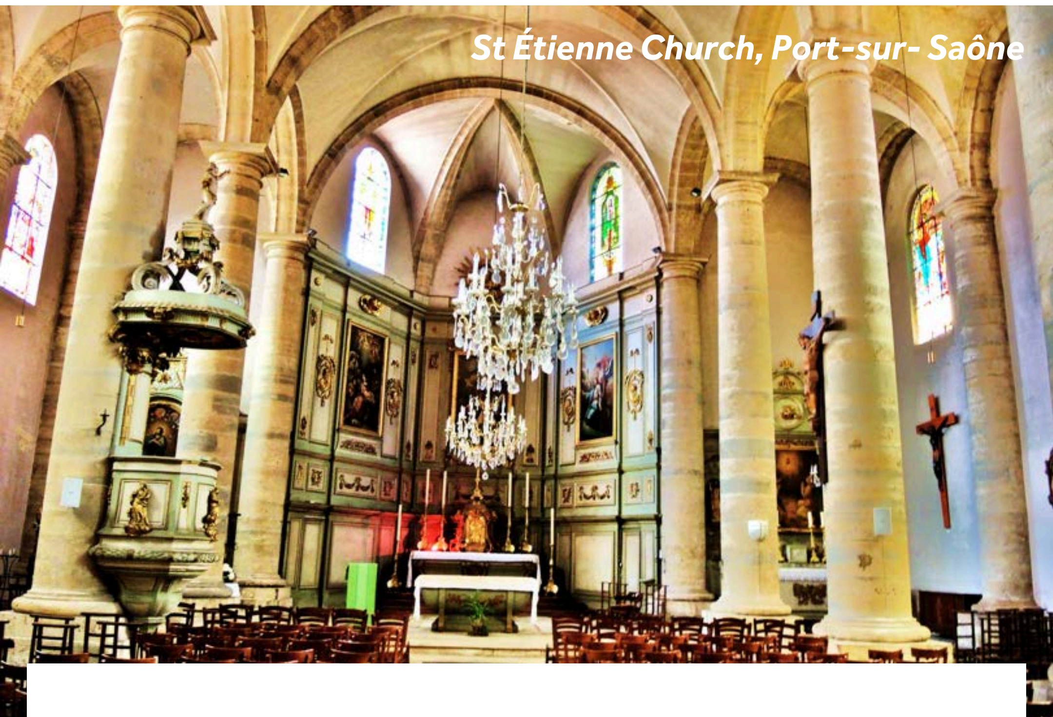
St Étienne Church, Port-sur-Saône

Der Ort war einst ein geschäftiger Hafen. Seine reiche Architektur zeugt noch heute von einer lebhaften Vergangenheit: vom ehemaligen Kloster Cluny über das Hôtel de la Paix mit seinen schönen Ornamenten an der Eingangstür bis hin zur faszinierenden Kirche von St. Étienne.