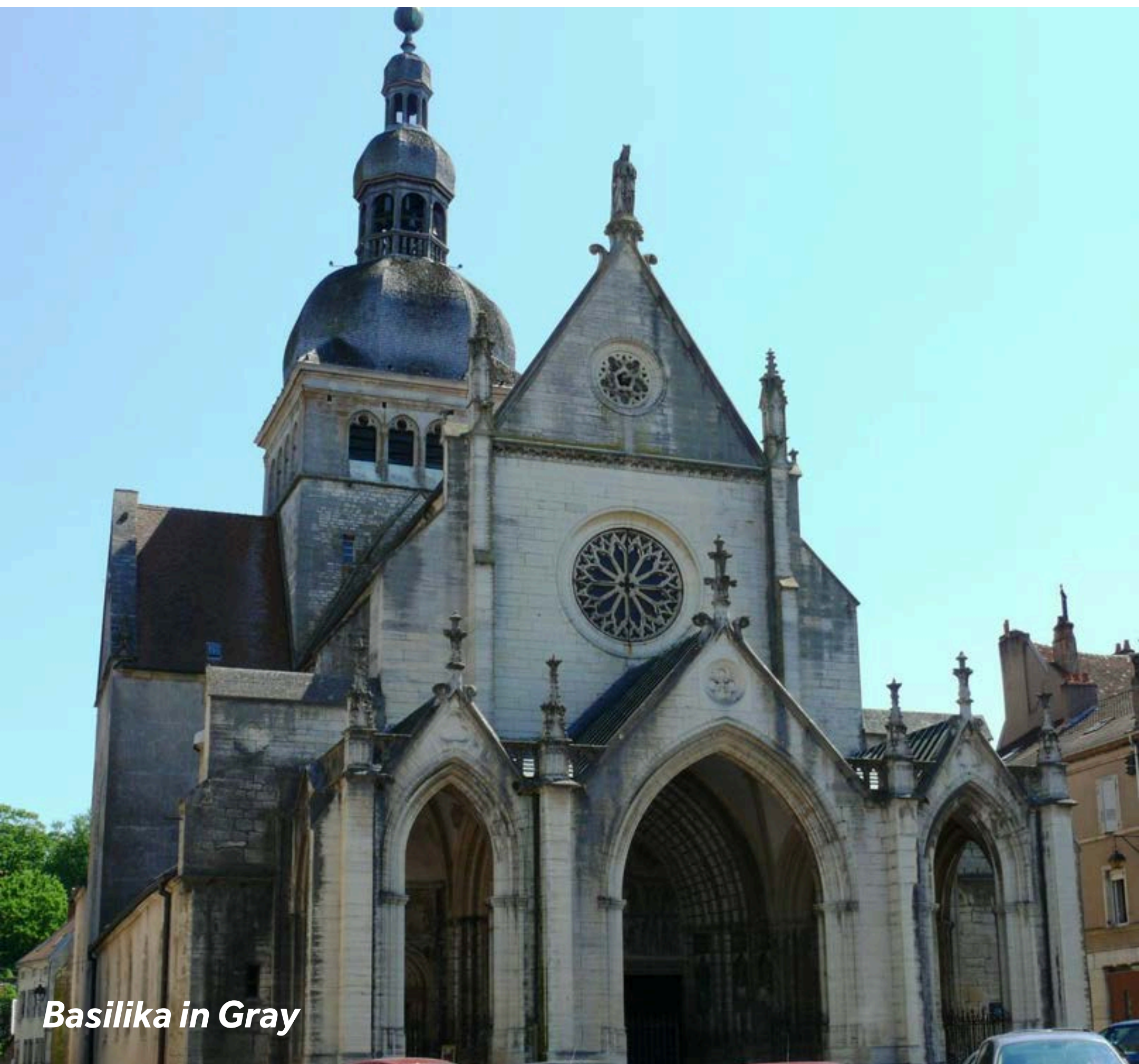
Basilika in Gray

Die Stadt ist ABSOLUT einen Spaziergang wert, ob allein oder auf einer von der Touristeninformation geführten Stadttouren. Entdecken Sie ihr bemerkenswertes architektonisches Erbe: die Basilika, das Schloss, das Theater im italienischen Stil, das Rathaus mit seinem Dach aus glasierten Kacheln, die Sonnenuhren und die steilen und schmalen Gassen, die zum unteren Teil der Stadt führen. Das Baron Martin Museum für Kunst und Archäologie bietet eine umfassende Sammlung von Gemälden und Skulpturen vom Mittelalter bis ins 20. Jahrhundert.