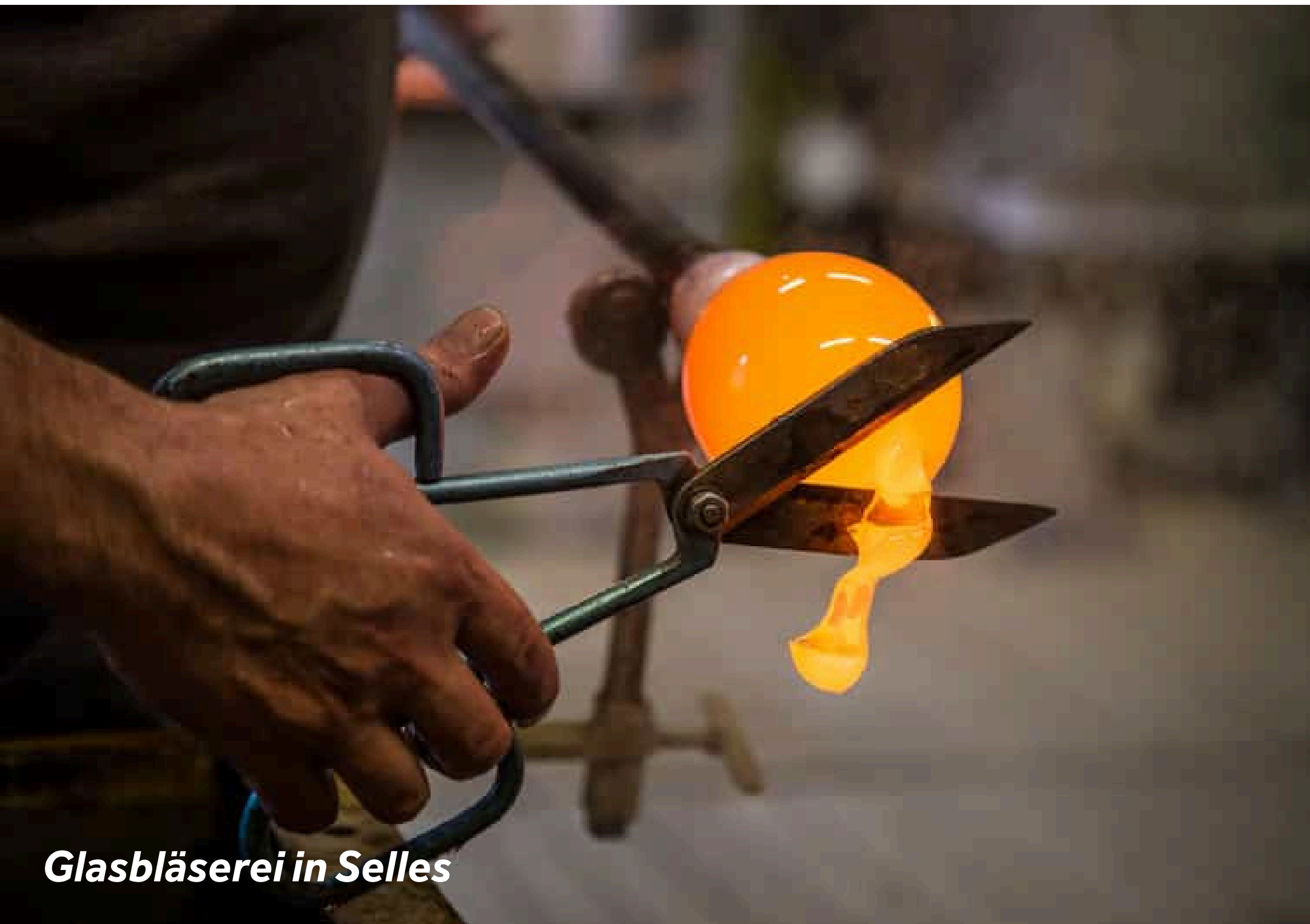
Glasbläserei in Selles

Das kleine Dorf ist berühmt für seine 1886 erbaute Drehbrücke „Le Pont Tournant“. Besichtigen Sie in der Nähe des gleichnamigen Restaurants das historische Waschhaus, den städtischen Brunnen und die alte Kirche.