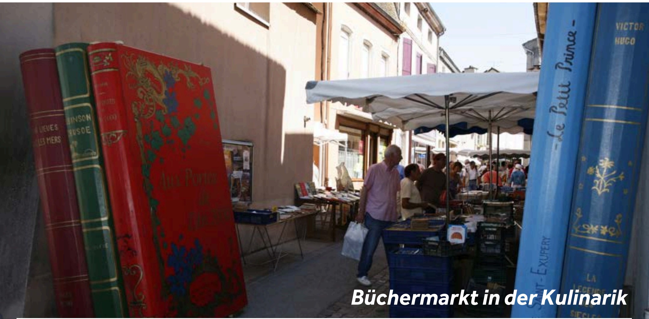
Büchermarkt in der Kulinarik

Halten Sie auf dem Weg nach Cuisery in Ratenelle, um den Bauernhof Ferme du Champ-Bressan aus den 30er Jahren zu besuchen. Er ist nur fünf Kilometer vom Anlegeplatz in Romenay entfernt und sieht noch genauso aus wie vor 80 Jahren. In Cuisery befindet sich ein Gutenberg-Museum, in dem die alte Art des Druckens erläutert und auch vorgeführt wird. Cuisery ist eine der „Bücherstädte“ Frankreichs und verfügt über mehrere mit vielen Sammlerstücken ausgestattete Buchhandlungen. Das Dorf befindet sich auf einem Hügel. Genießen Sie den herrlichen Ausblick auf die gesamte Bresse-Ebene. Die BisCuisery Bio-Mühle am Fluss lädt zu einem entspannenden Nachmittagstee ein.