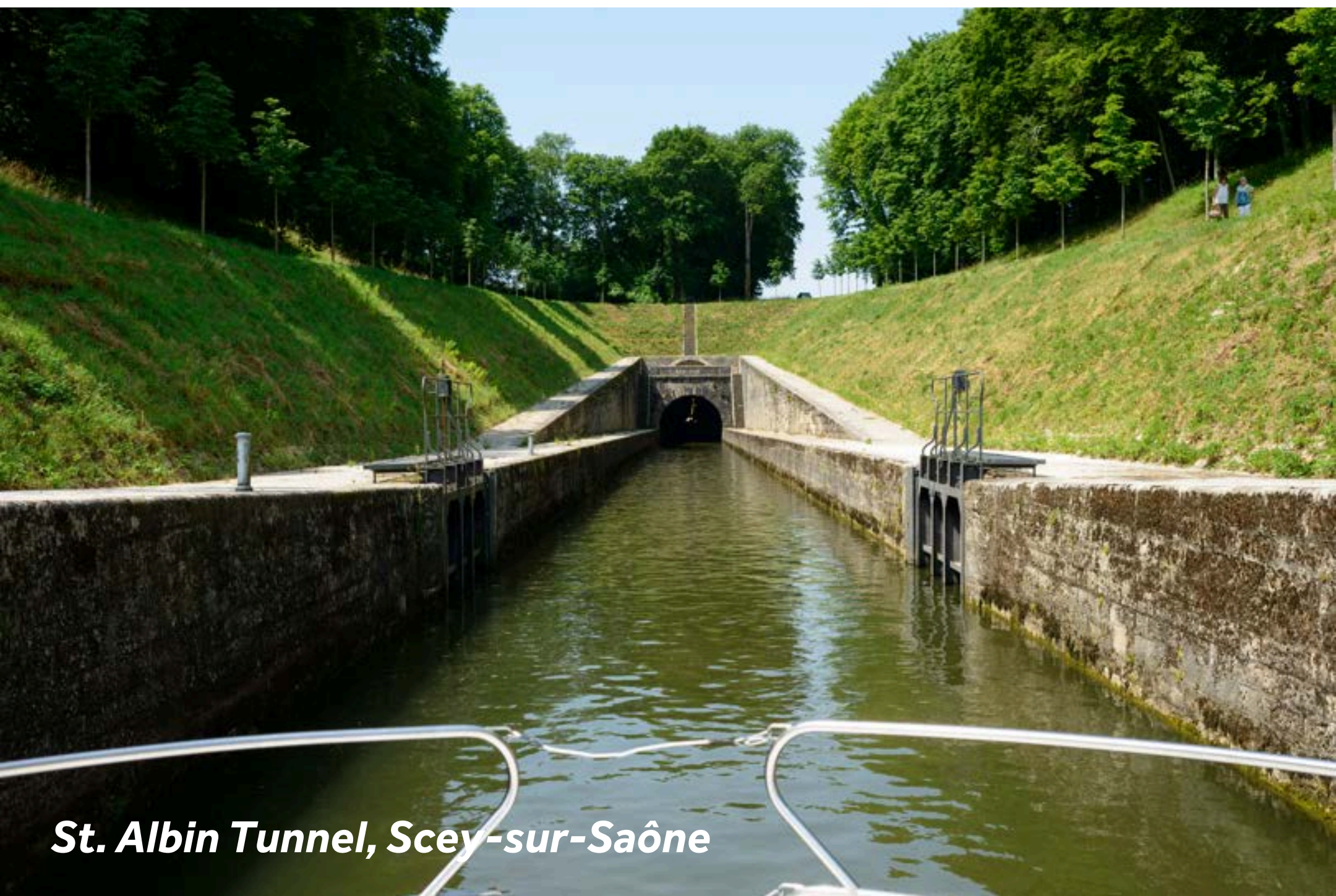
St. Albin Tunnel, Scey-sur-Saône