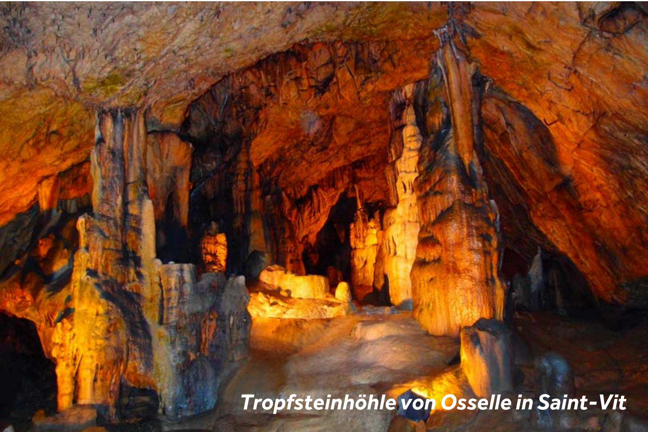
Tropfsteinhöhle von Osselle in Saint-Vit

Die kleine Stadt ist bekannt für ihre Tropfsteinhöhle von Osselle (3km von der Anlegestelle entfernt). Spazieren Sie entlang der vorgefertigten Wege und bewundern Sie die Vielfalt der Kristallgebilde mit ihren außergewöhnlichen Farbspielen, Stalaktiten, Stalagmiten und anderen geologischen Kuriositäten. In der Nähe des Flusses Doubs befindet sich zudem ein See mit Sandstrand, Wasserrutsche, Kinderspielplatz sowie Volleyball- und Boule-Plätzen.