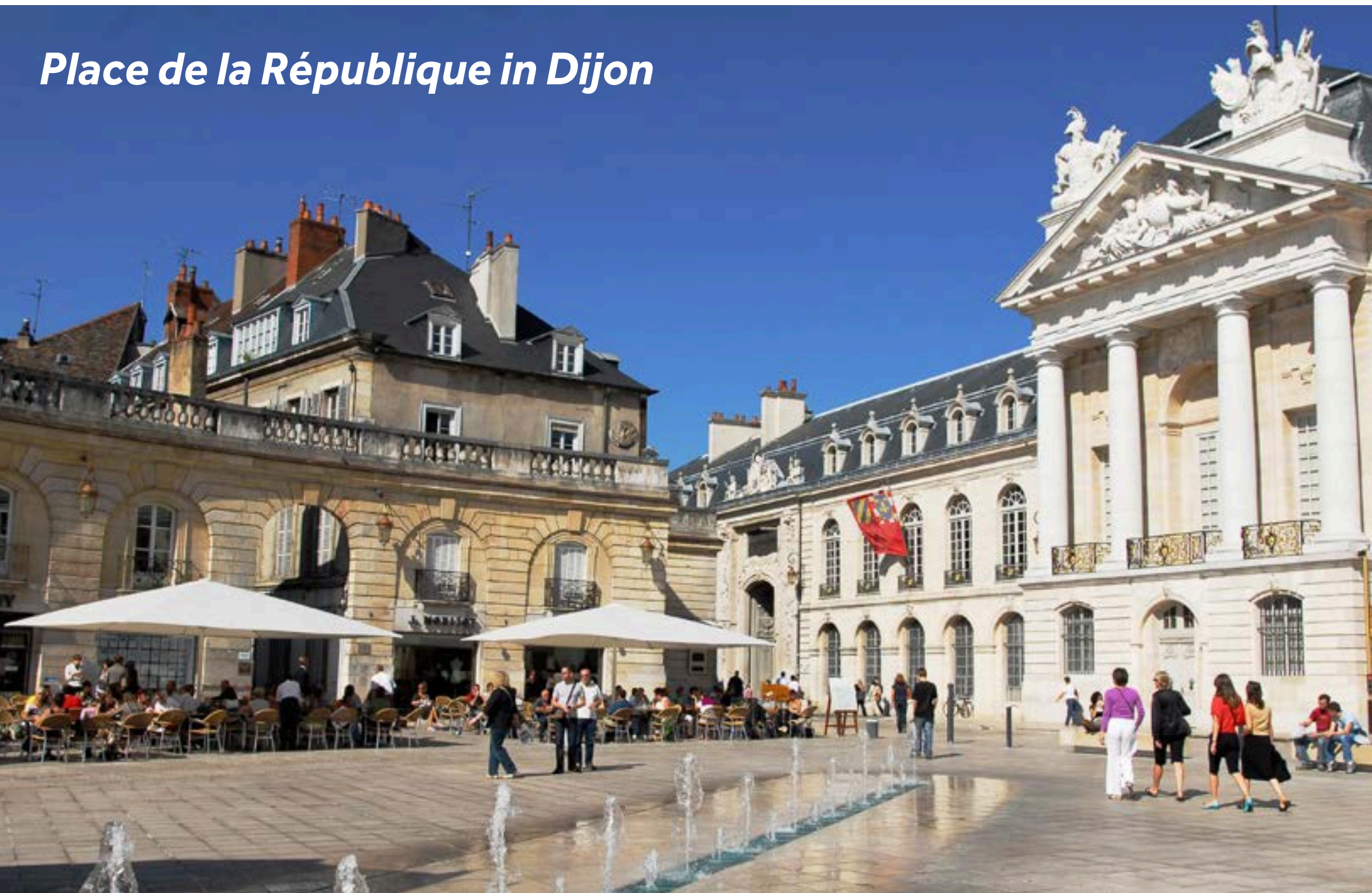
Place de la République in Dijon