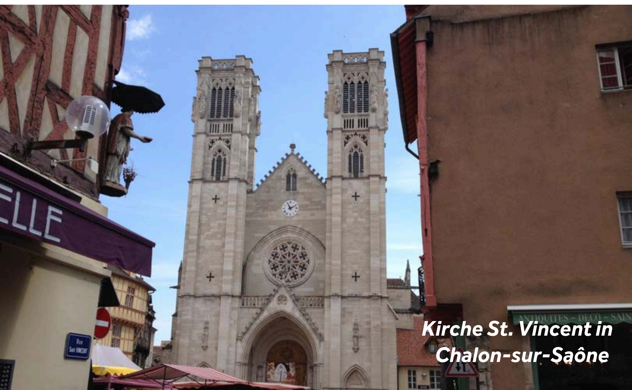
Kirche St. Vincent in Chalon-sur-Saône