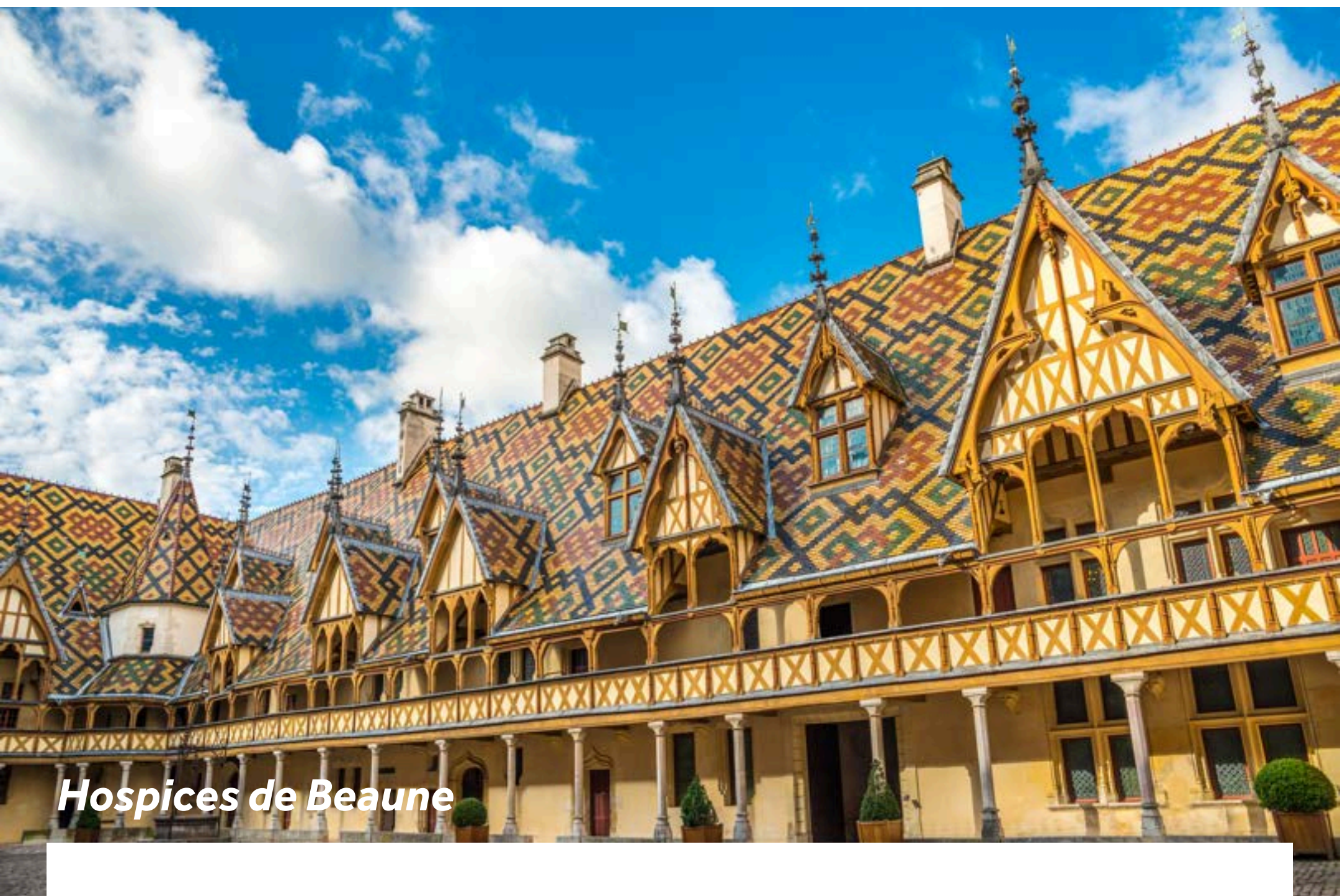
Hospices de Beaune

Pourquoi ne pas prendre le train depuis Chalon-sur-Saône ou Chagny pour partir à la découverte de la charmante ville de Beaune ? Célèbre pour ses Hospices avec sa toiture en tuiles vernissées de Bourgogne, une visite à l'intérieur révèle son histoire fascinante. Ne partez pas sans avoir acheté quelques fromages locaux, de la moutarde et un délicieux pain d'épices aux alentours de la Place Carnot. Si vous avez le temps, rendez-vous au Château de Pommard, pour une visite du Musée de la Vigne et du Vin et une dégustation des vins du domaine.