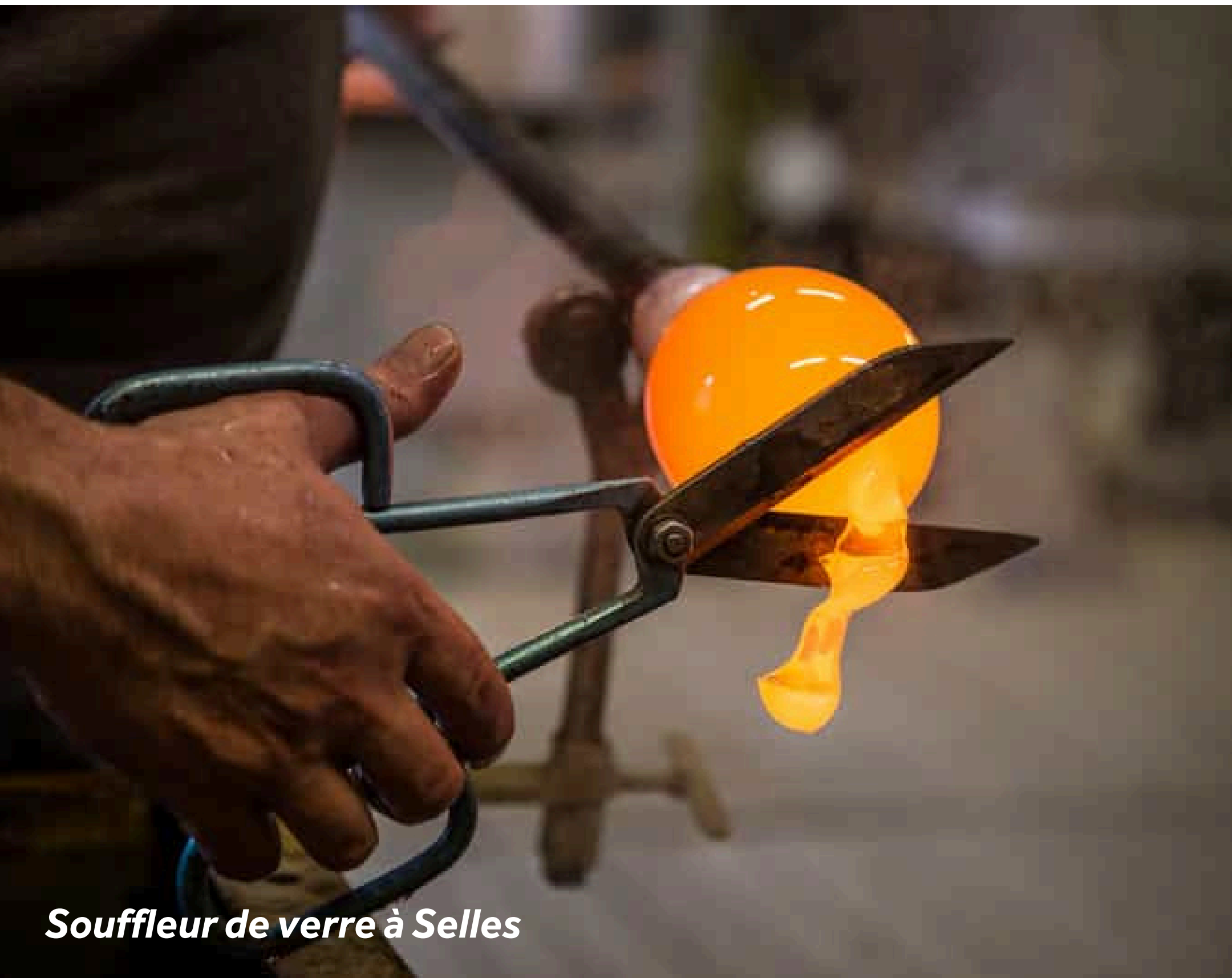
Souffleur de verre à Selles

Ce petit village est célèbre pour son pont tournant datant de 1886. Amarrez-vous au niveau du restaurant afin de visiter le lavoir, sa fontaine et sa vieille église. Profitez de votre étape à Selles pour faire vos provisions en fromage à la fromagerie Biodéal Roussey, puis pédalez jusqu'à la verrerie de Passavant-la-Rochère, qui perpétue la tradition des souffleurs de verre depuis 1475 (visite gratuite).