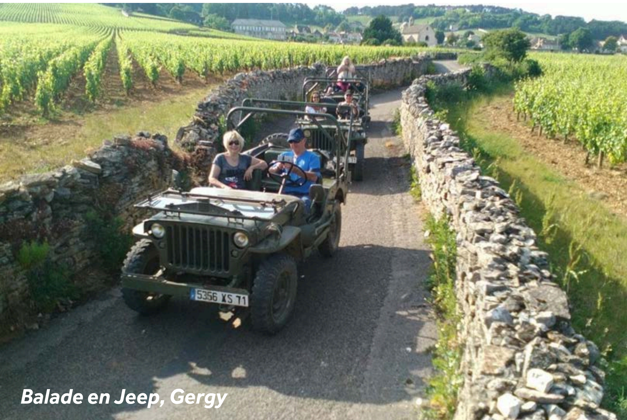
Balade en Jeep, Gergy

Si vous vous arrêtez à Gergy, marchez jusqu'à l'église St-Germain. Pour une église de campagne relativement modeste, la sculpture et l'ornement sont un vrai régal. La fromagerie du Meix Lantin vend du fromage de chèvre exquis. Bourgogne Jeep Découverte vous propose une expérience unique : conduisez une Jeep d'époque à travers le vignoble de Beaune accompagné d'un guide qui vous commentera la beauté des paysages (+33 (0) 6 81 27 69 40).