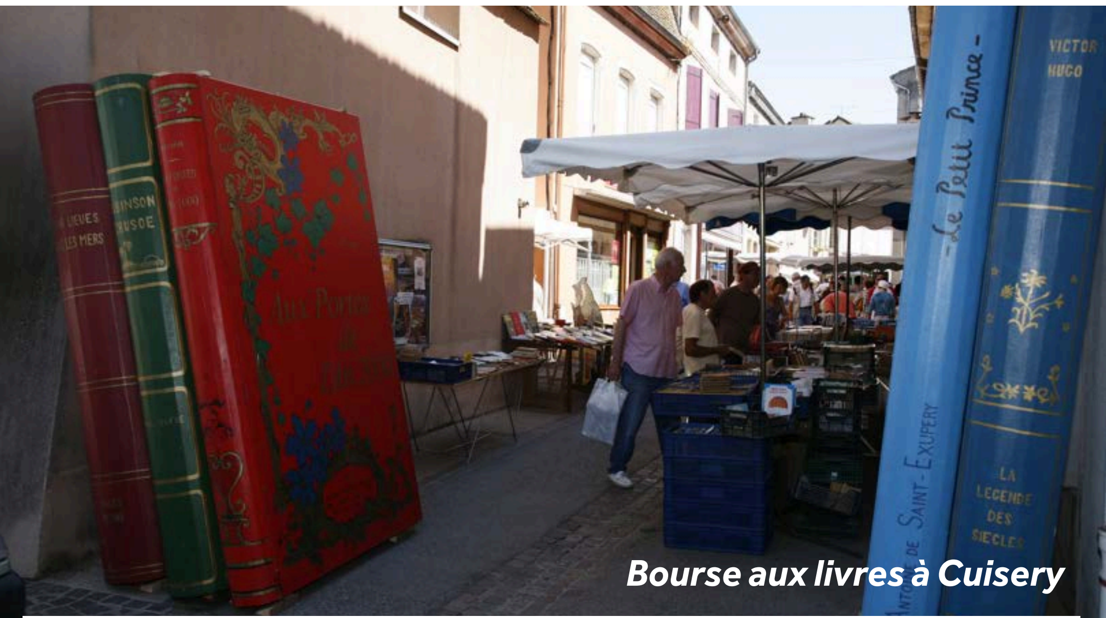
Bourse aux livres à Cuisery

Sur votre chemin pour Cuisery, faites un stop à Ratenelle si vous voulez faire un tour à la Ferme du Champ Bressan. Ce corps de ferme de 1930 n'a pas changé depuis 80 ans (situé à 5km de l'amarrage de Romenay). Cuisery compte une dizaine de librairies et fait partie des quatre "Villages du Livre" de France. L'Espace Gutenberg donnent des explications et fait une démonstration d'imprimerie à l'ancienne. Du haut de la colline où se trouve le village, admirez la vue sur la vallée de la Bresse. Le moulin Biscuisery, en bordure de rivière, vous invite à l'heure du thé pour une pause détente.