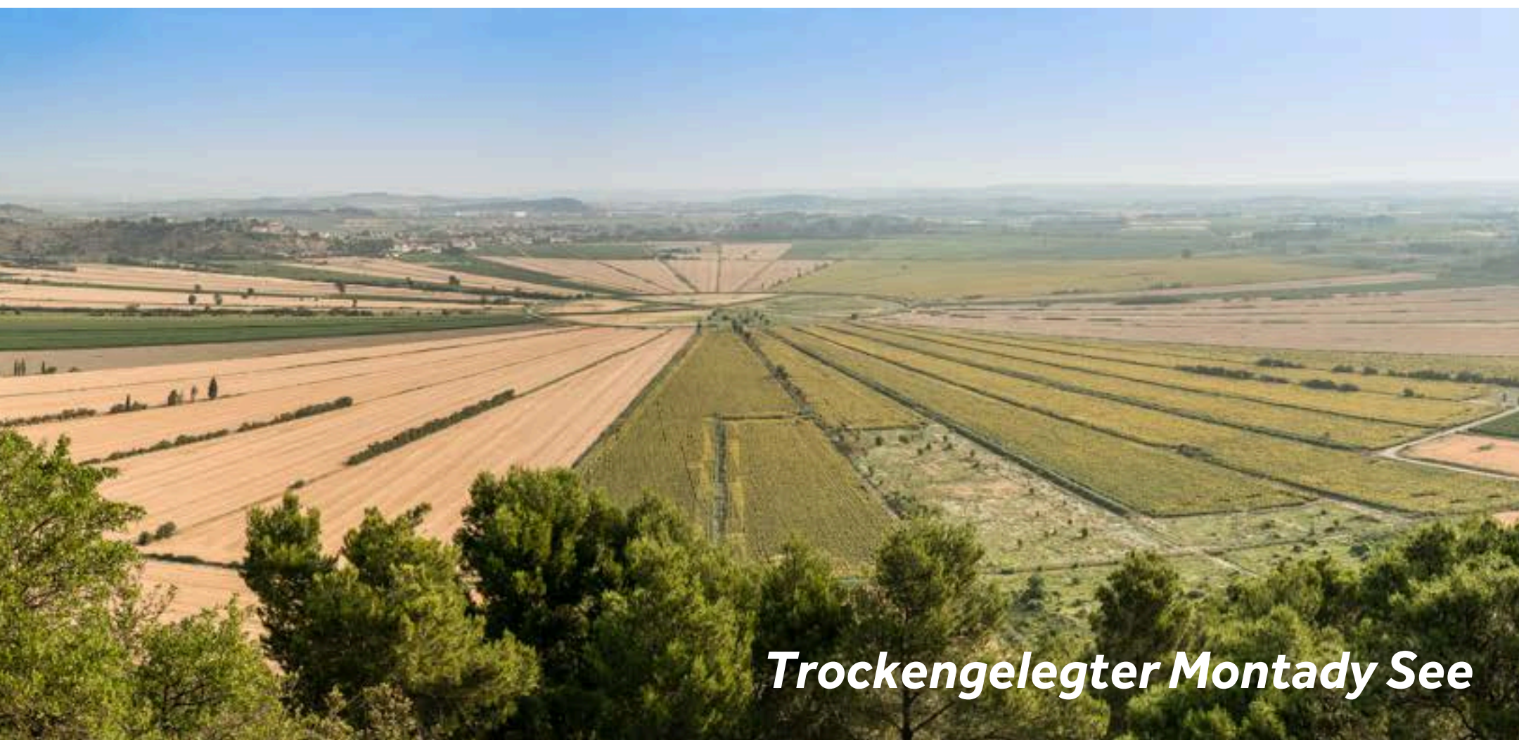
Trockengelegter Montady See

Die wichtigen Sehenswürdigkeiten liegen außerhalb Colombiers: Das Oppidum von Ensérune ist ein archäologischer Schauplatz, der Ihnen einen kleinen Überblick in das damalige Bronzezeitalter bis hin zur römischen Eroberung verschafft.