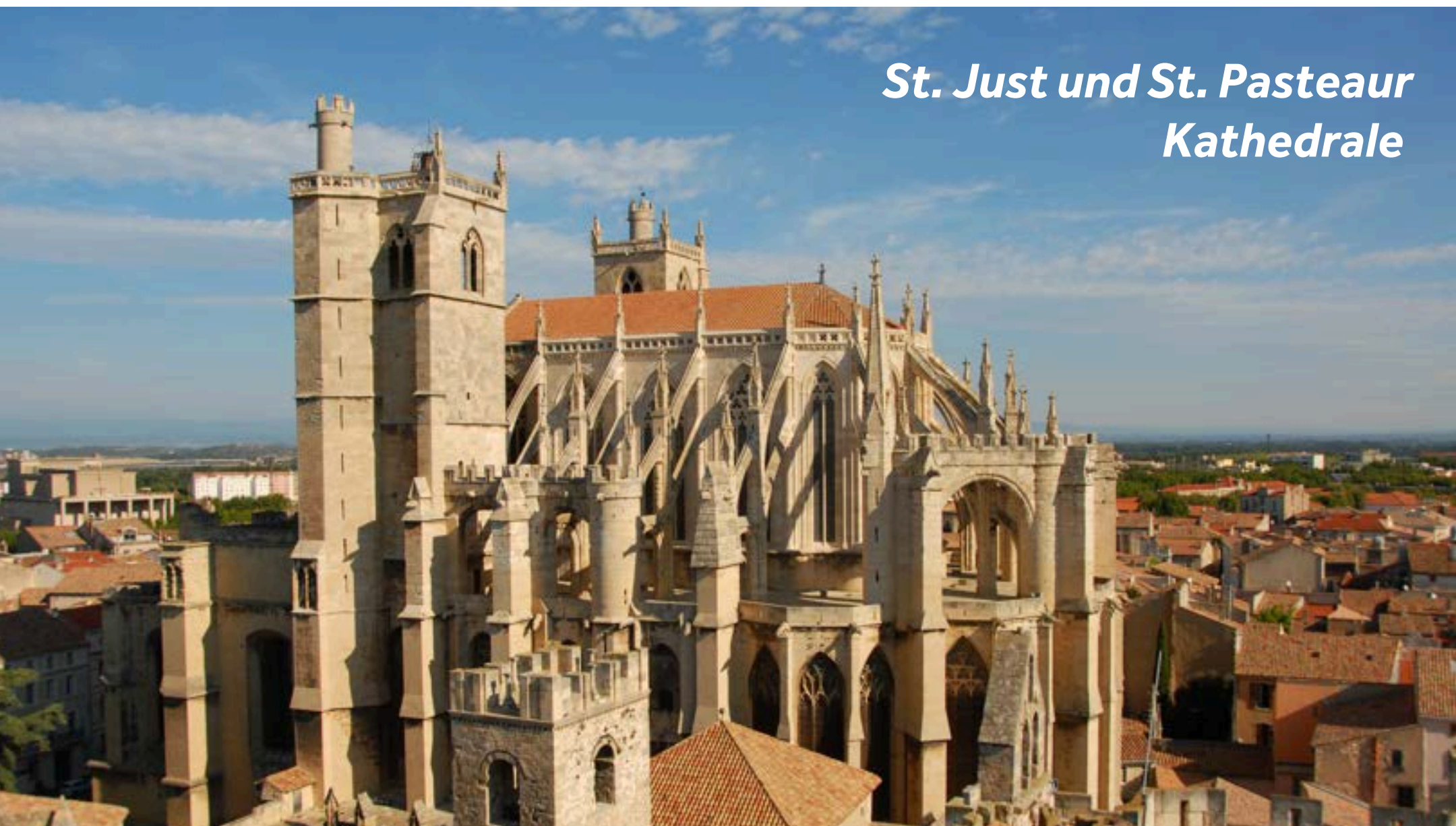
St. Just und St. Pasteur Kathedrale

Narbonne blickt auf ein historisch reiches Erbe zurück, das sich in den alten, fast majestätischen Gebäuden entlang der modernen Straßen und Boulevards widerspiegelt. Erleben Sie die südfranzösische Atmosphäre mit einem spanischen Touch. Der Palais des Archeveques (Der Palast des Erzbischofs) setzt sich aus dem alten Palast („Palais Vieux“) aus römischer Zeit und dem neuen Palast („Palais Neuf“) gotischen Ursprungs zusammen.