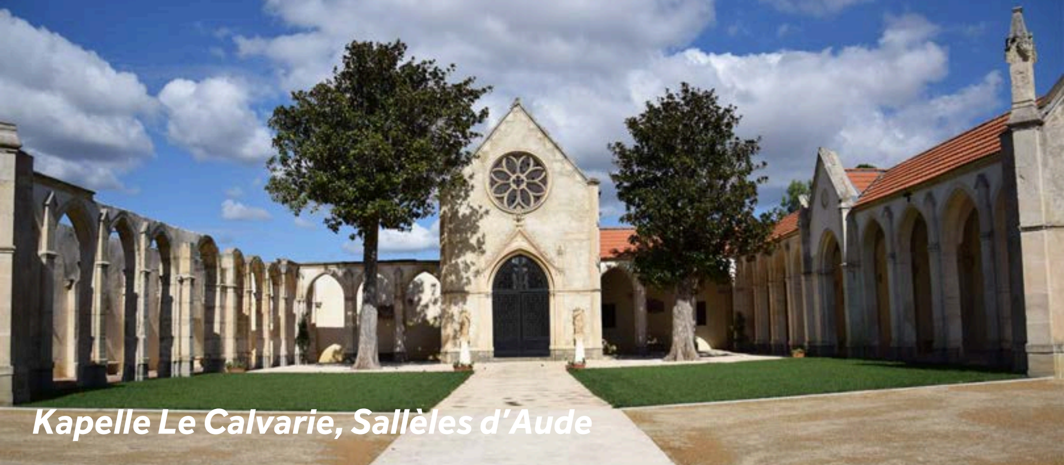
Kapelle Le Calvarie, Sallèles d'Aude