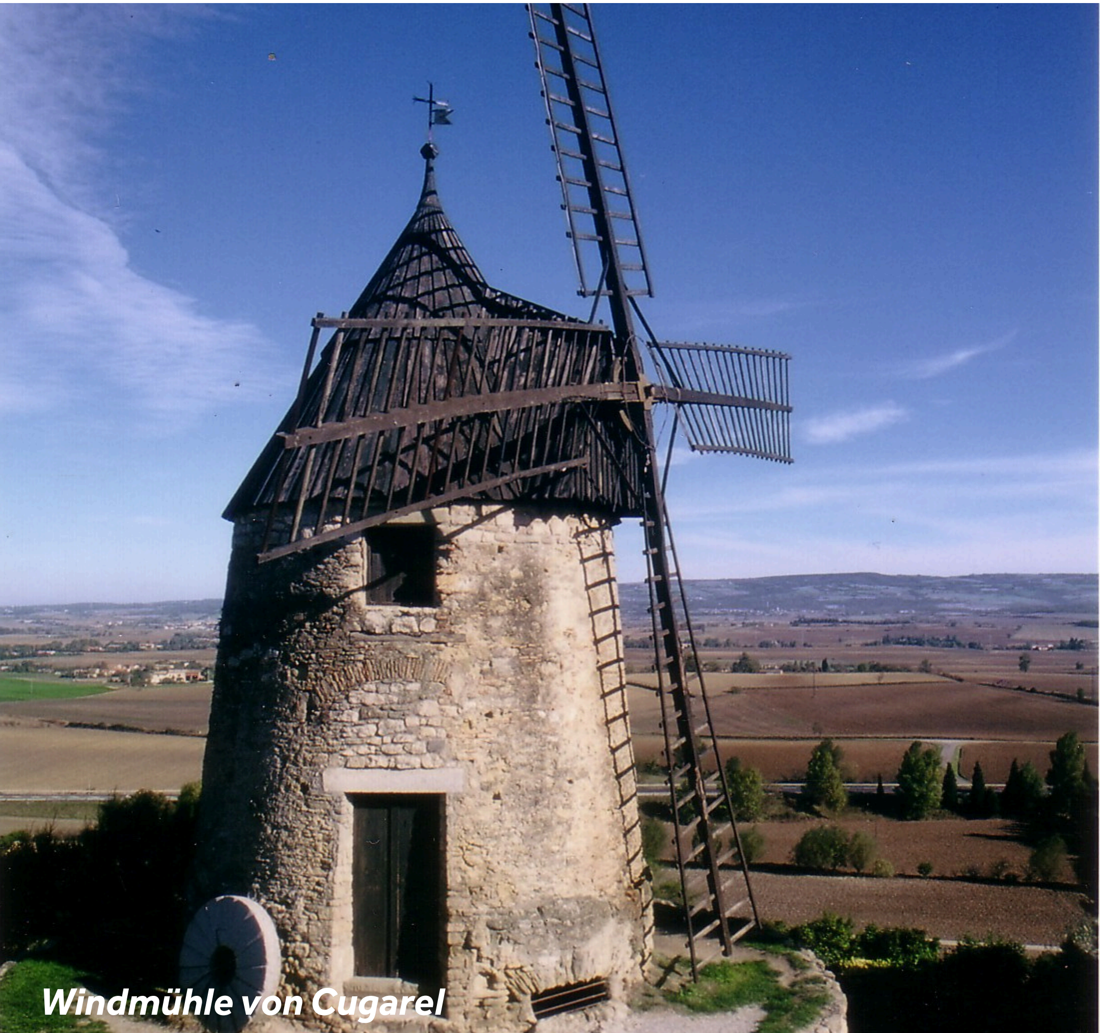
Windmühle von Cugarel

Die historische Marktstadt ist die Heimat des regionalen Gerichts Cassoulet, ein Eintopf aus weißen Bohnen, Schweine- und Entenfleisch. Besuchen Sie auch die immer noch intakte Windmühle von Cugarel aus dem 17. Jahrhundert. Unternehmen Sie dazu einen Spaziergang durch die Stadt und genießen Sie einen herrlichen Blick auf die umliegende Landschaft. Wenden Sie sich an das Tourismusbüro Castelnaudary, um eine Führung zu organisieren. Unterwegs können Sie in der Stiftskirche St. Michel, die durch ihren imposanten Kreuzgang, den barocken Altar und den großen klassischen Orgeln besticht, eine Pause einlegen.