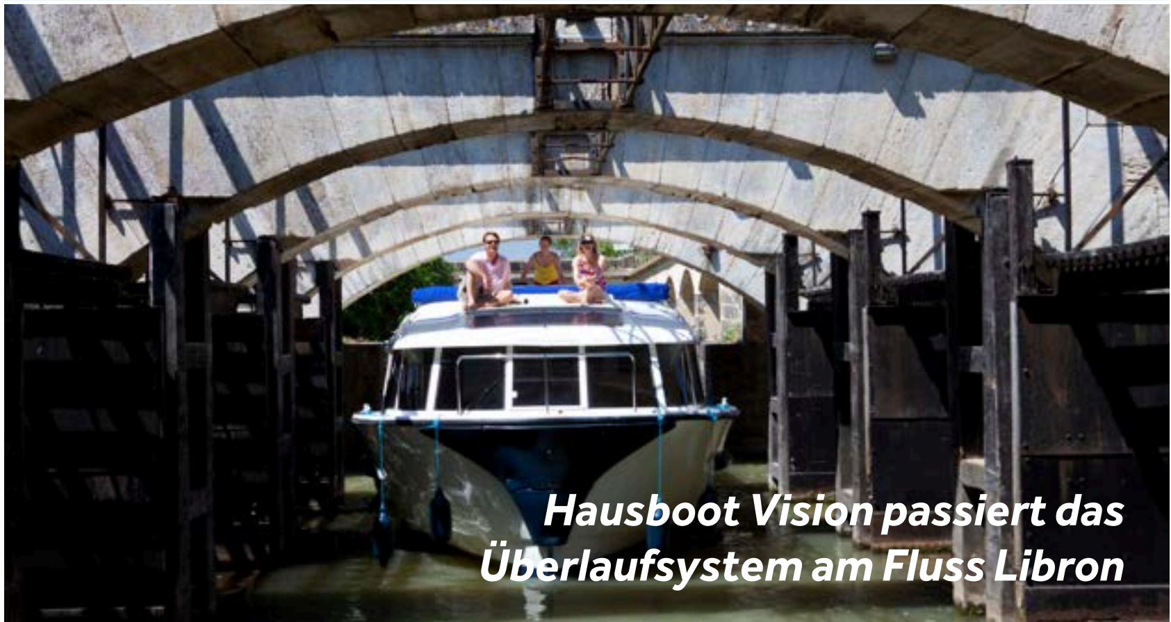
Hausboot Vision passiert das Überlaufsystem am Fluss Libron

Östlich von Port Cassafières fahren Sie durch das "Ouvrages du Libron", ein Meisterwerk von 1858, das die beiden Flussarme im Falle von Hochwasser voneinander trennt.