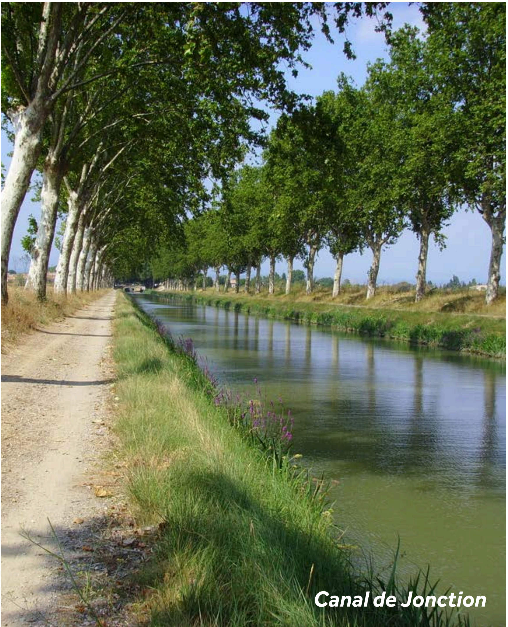
Canal de Jonction