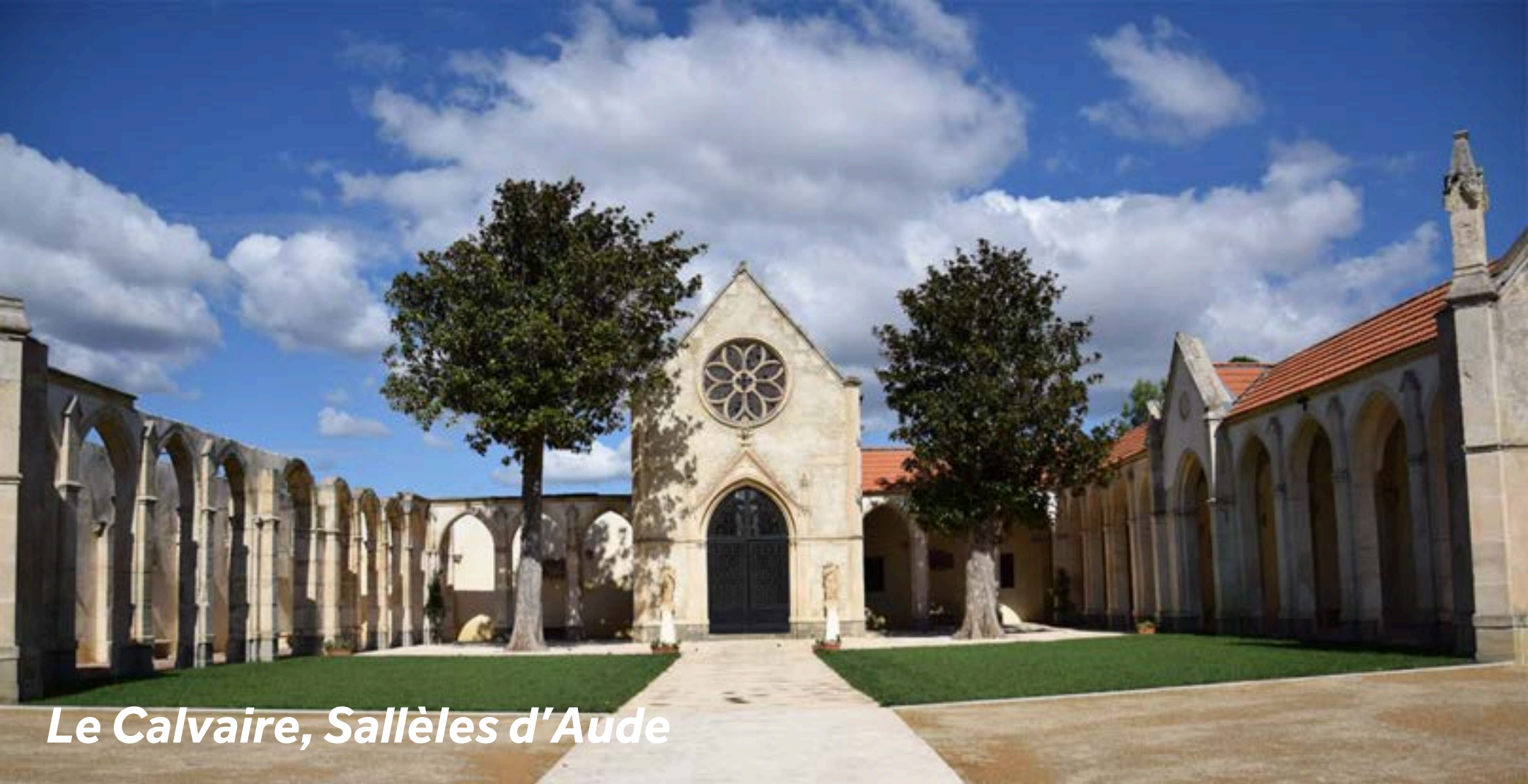
Le Calvaire, Sallèles d'Aude