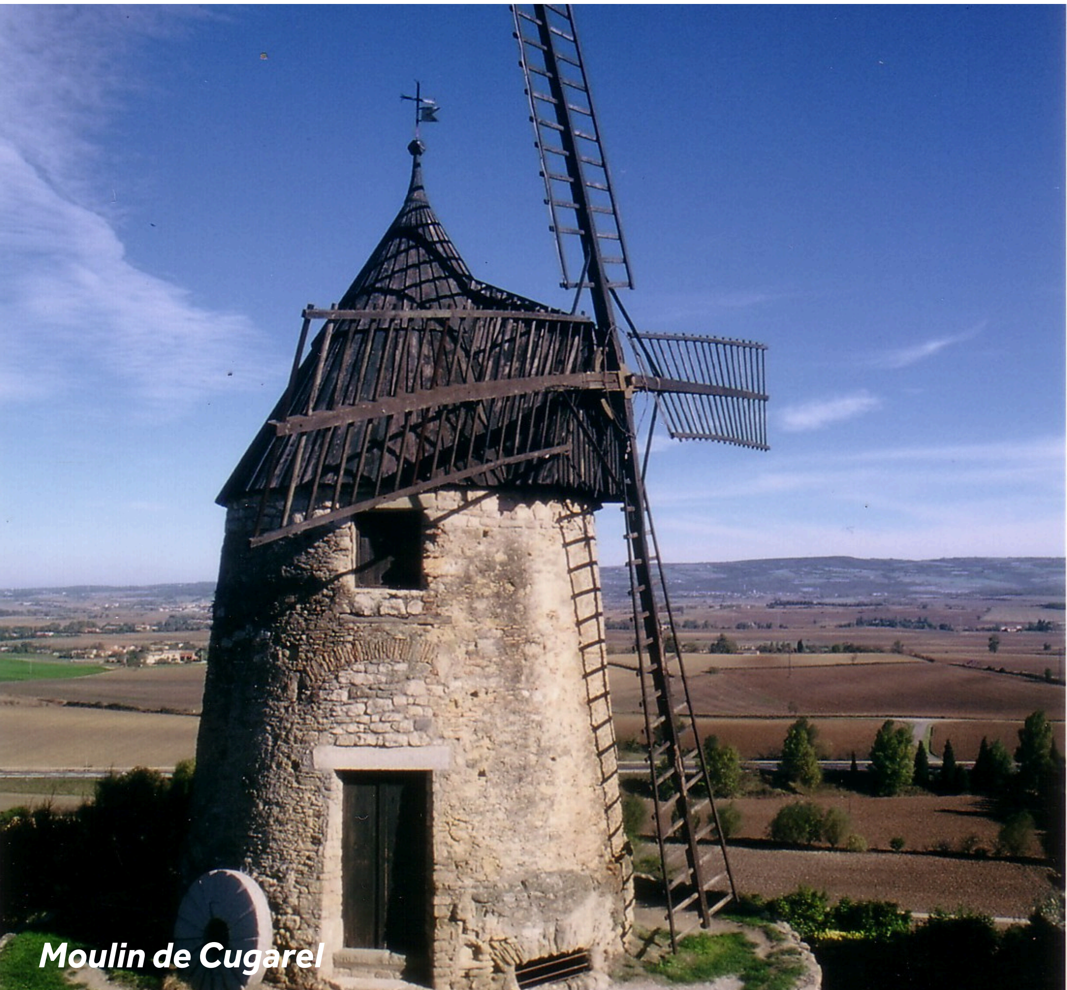
Moulin de Cugarel

La ville historique de Castelnaudary est célèbre pour sa spécialité gastronomique : le Cassoulet, plat typique à base de haricots blancs, de porc et de canard. Lors de votre passage dans cette jolie ville, visitez le Moulin du Cugarel qui date du 17ème siècle. Prenez le temps de visiter le centre ville et découvrir ses petits commerces, et profitez d'un joli panorama sur la Montagne Noire. Contactez l'Office de Tourisme de Castelnaudary pour organiser une visite. Vous pourrez visiter la Collégiale de St Michel, son impressionnant cloître, et découvrir son orgue qui date de l'époque baroque.