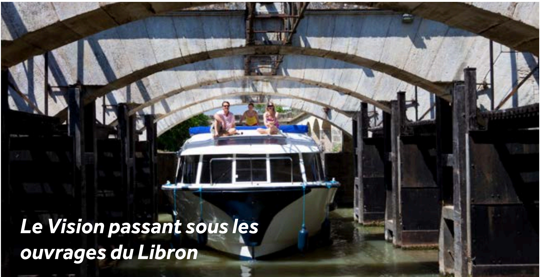
Le Vision passant sous les ouvrages du Libron

À l'est de Port Cassafières, vous passerez sous les Ouvrages du Libron, une merveille d'ingénierie construite en 1858 qui permet l'écoulement des eaux du Libron en période de crue.