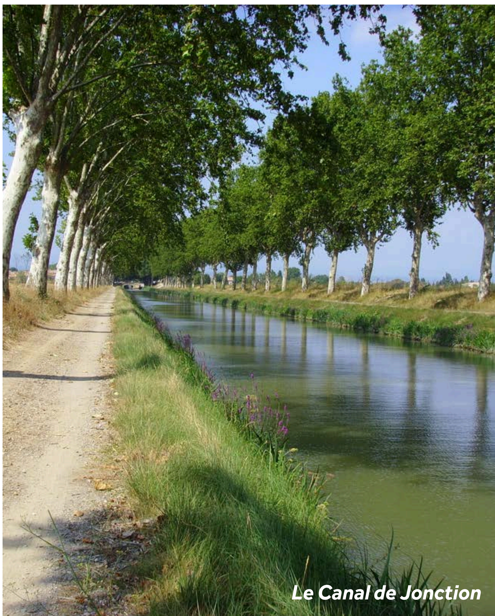
Le Canal de Jonction