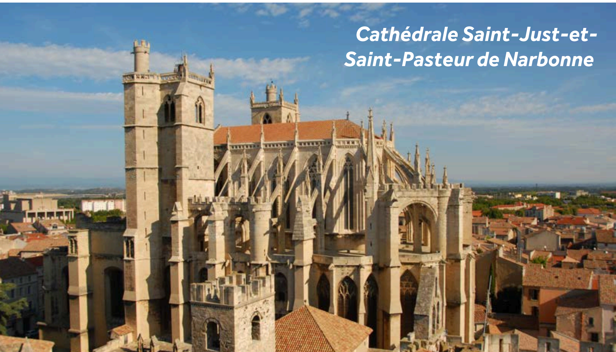
Cathédrale Saint-Just-et-Saint-Pasteur de Narbonne

Narbonne possède un patrimoine riche dans lequel les bâtiments anciens se mêlent aux petites rues et aux grands boulevards modernes et animés. Le bâtiment le plus célèbre est le palais de l'archevêque composé du Vieux palais d'origine romaine et du Nouveau Palais d'origine gothique ce qui en fait un bâtiment tout aussi impressionnant qu'inhabituel.