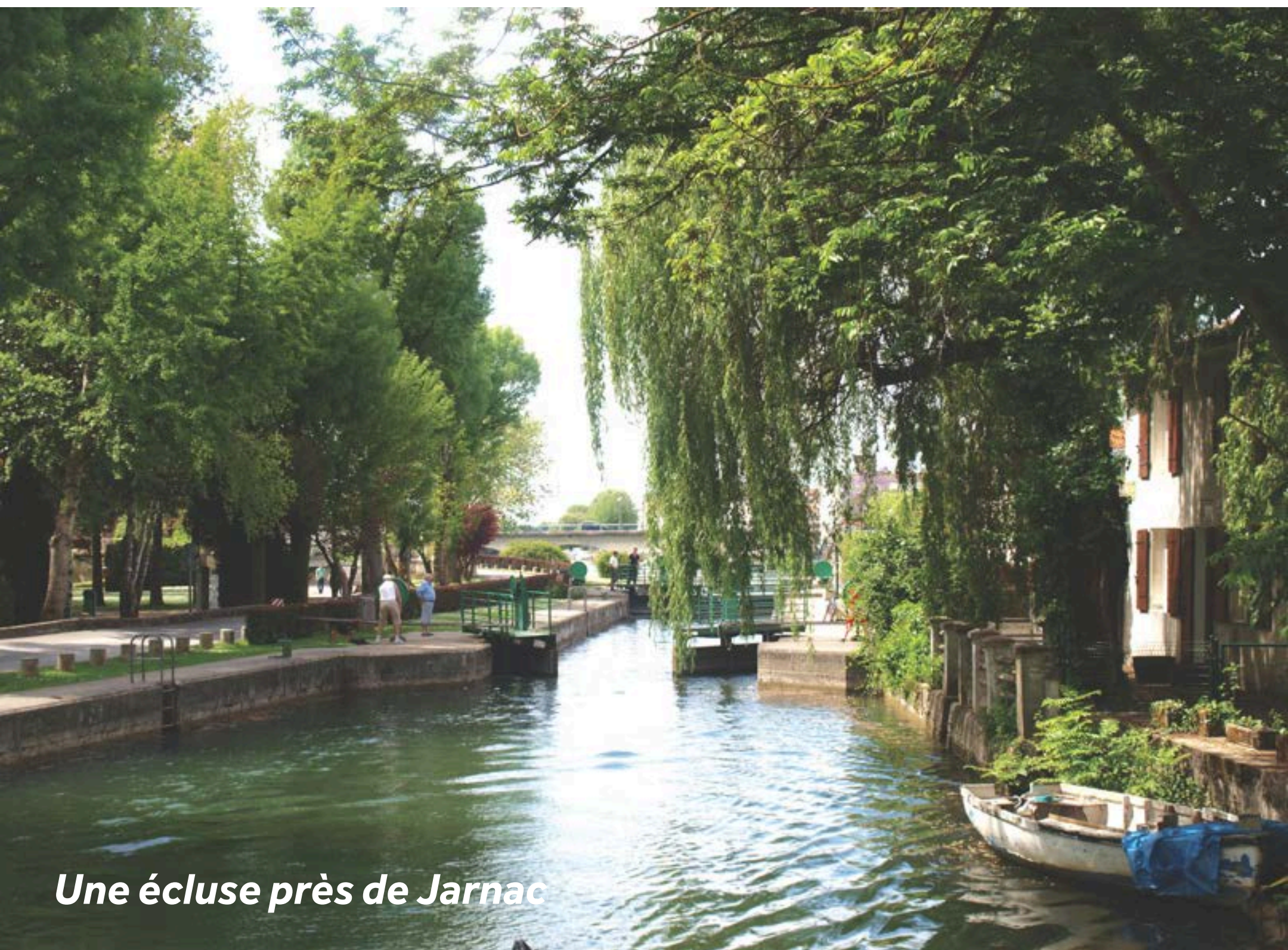
Une écluse près de Jarnac

Les riches demeures blanches qui bordent les quais de la Charente témoignent du passé prospère de Jarnac. Deux grandes maisons de négoce de Cognac se sont établies dans cette ville. Nous vous conseillons de visiter la Maison Courvoisier, située près du pont. En un peu plus d'une heure de visite, vous découvrirez tous les secrets de la distillation, du travail de la vigne, des chais, de la tonnellerie et du vieillissement si délicat de cette « liqueur des Dieux. Jarnac est également la ville de l'ancien président François Mitterrand. Sa maison natale, la Maison natale de François Mitterrand, est ouverte au public en son honneur et présente les cadeaux offerts au président par les chefs d'État du monde entier. Si le mercure grimpe, pourquoi ne pas vous rendre au centre aquatique de l'Île Madame, avec ses piscines en plein air et son aire de loisirs – idéal pour une journée de détente ?