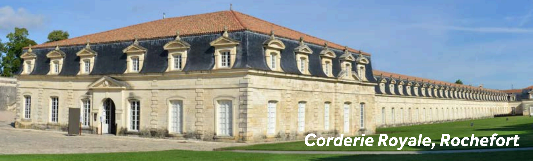
Corderie Royale, Rochefort