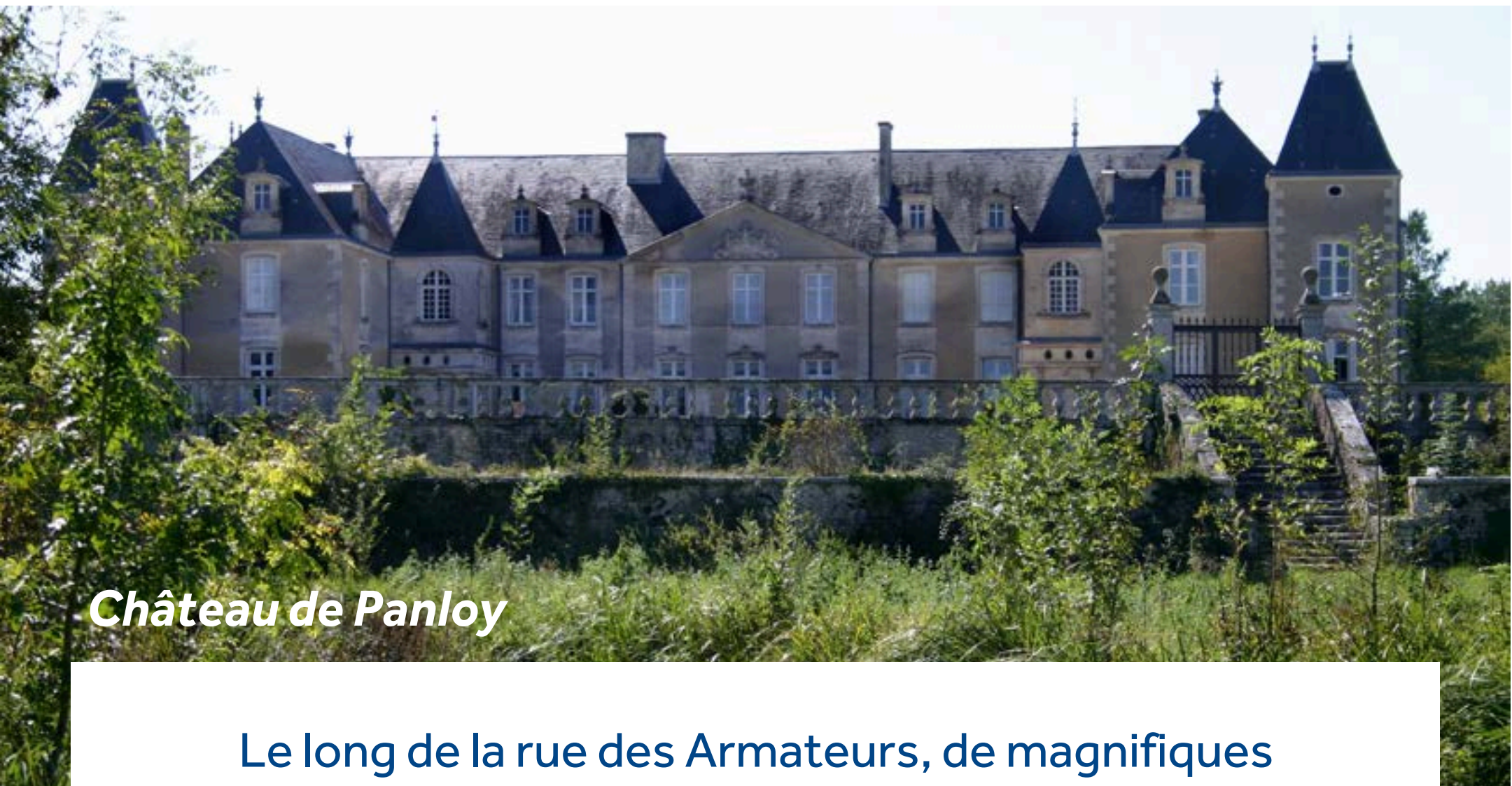
Château de Panloy

Le long de la rue des Armateurs, de magnifiques demeures attestent de l'importance de ce petit village. Vous pouvez faire une visite guidée du Château de Panloy du XIIIe siècle pour découvrir ses tapisseries, ses boiseries et sa galerie de chasse (à 900m de l'amarrage). Au bord de la rivière, se trouve une plage de sable aménagée, idéale pour la baignade et la location de kayak - un endroit agréable pour un pique-nique ou pour passer l'après-midi. Et si vous êtes en forme, marchez ou pédalez jusqu'aux Lapidales, une ancienne carrière de calcaire située à quelques pas du village. Des artistes du monde entier sont venus graver des sculptures à même la roche.