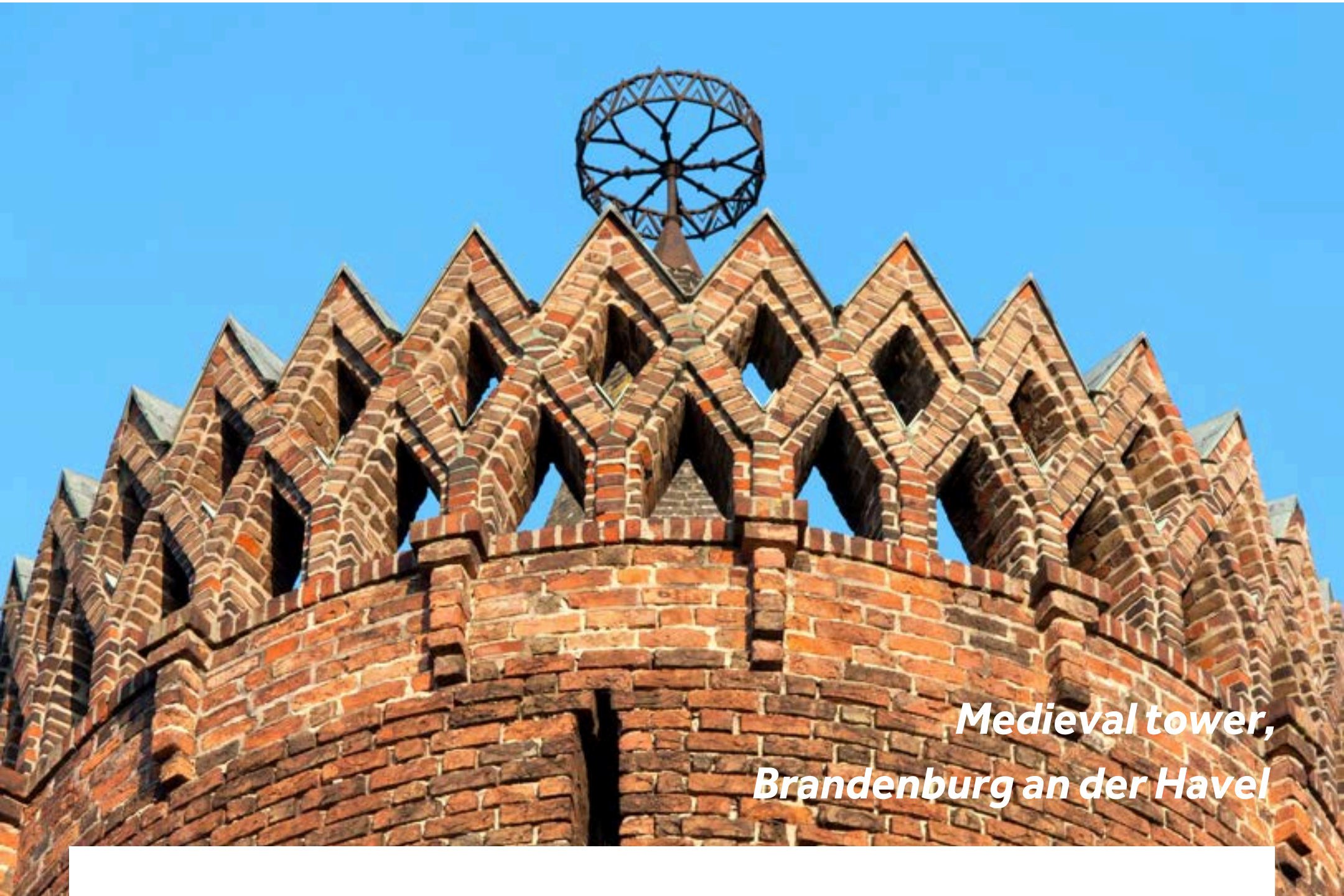
Medieval tower, Brandenburg an der Havel

Aufgrund ihrer langen Geschichte wird die Stadt auch als die "Wiege der Mark" bezeichnet. In den drei mittelalterlichen Stadtkernen findet man zahlreiche Sehenswürdigkeiten, wie den Brandenburger Dom, mehrere große Backsteinkirchen, das Altstädtische Rathaus mit dem Roland und das Paulikloster. Umgeben von einer traumhaften Fluss- und Seenlandschaft, ist Brandenburg an der Havel ein Eldorado für Freizeitkapitäne und Wassersportler.