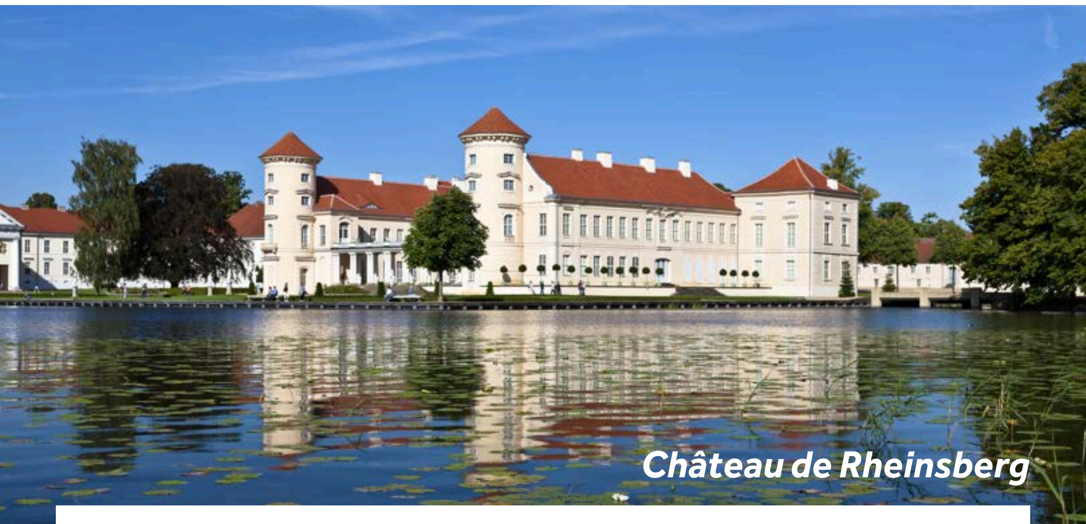
Château de Rheinsberg

Si vous commencez votre croisière depuis Marina Wolfsbruch, Rheinsberg devrait être votre première escale. Admirez le château de Rheinsberg depuis le lac. Cette jolie bâtisse rococo était autrefois la propriété du roi de Prusse, Frédéric le Grand. Visitez le château et son musée, puis baladez-vous dans son superbe jardin. Vous comprendrez ainsi pourquoi le roi Frédéric décrit ses années à Rheinsberg comme "les plus heureuses de sa vie". Puis, dirigez-vous vers le petit centre-ville, avec ses jolies maisons colorées, son jardin ombragé, ses belles boutiques et ses nombreux restaurants, ainsi que ses chevaux à bonnet d'âne. En été, vous pourrez également profiter des nombreux concerts et événements qui s'y déroulent. Enfin, Rheinsberg est l'endroit idéal pour faire le plein de provisions.