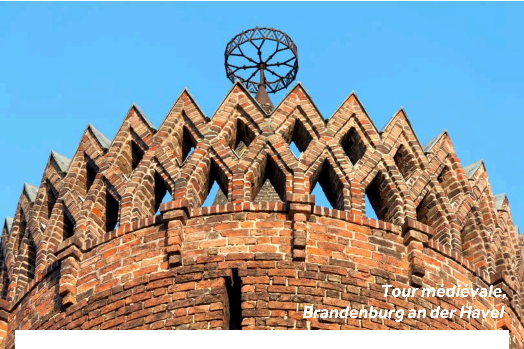
Tour médiévale, Brandenburg an der Havel

La jolie ville de Brandenburg an der Havel, a été façonnée par l'eau, et est un paradis pour les plaisanciers et les amateurs de sports nautiques. D'abord habitée par les Slaves au VIe siècle, Brandenburg donna son nom à toute la région. Vous serez surpris par la beauté de ses reliques médiévales et son centre historique, comptant plusieurs remarquables monuments gothiques en briques rouges. Découvrez également la cathédrale, plusieurs grandes églises de briques, l'ancien hôtel de ville et le monastère Paulikloster.