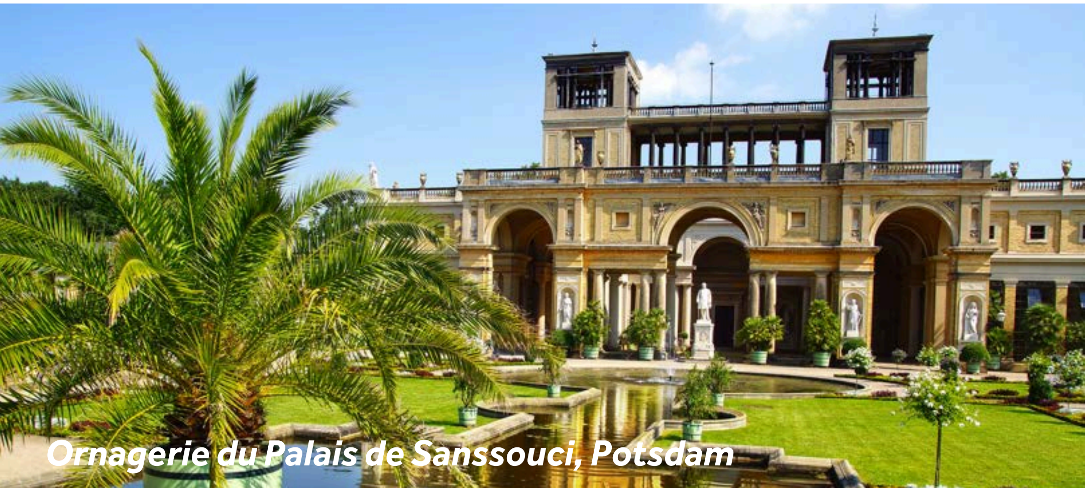
Ornagerie du Palais de Sanssouci, Potsdam

Potsdam, capitale de la région de Brandebourg, est construite sur un méandre du fleuve Havel. Splendeur et gloire de la Prusse, ville de grands architectes et scientifiques, zone sensible pendant la Guerre froide : Potsdam offre culture et histoire dans une dimension à couper le souffle. Plongez dans le siècle du baroque et partez visiter le Palais de Sanssouci, l'ancienne résidence d'été des empereurs prussiens et des kaisers allemands. La splendeur rococo du palais avec sa belle orangerie et son parc enchanteur était la réponse de Frédéric le Grand à Versailles. Puis baladez-vous à travers le centre historique de Potsdam. Découvrez l'impressionnante église St-Nicolai, l'ancien hôtel de ville et le Vieux marché - les anciennes étables hébergent aujourd'hui la 'Haus der Brandenburg-Preußischen Geschichte' (Maison de l'histoire de Brandebourg-Prusse). Si vous avez le temps, faites un tour dans le quartier hollandais avec ses 150 maisons de briques et son ambiance animée.