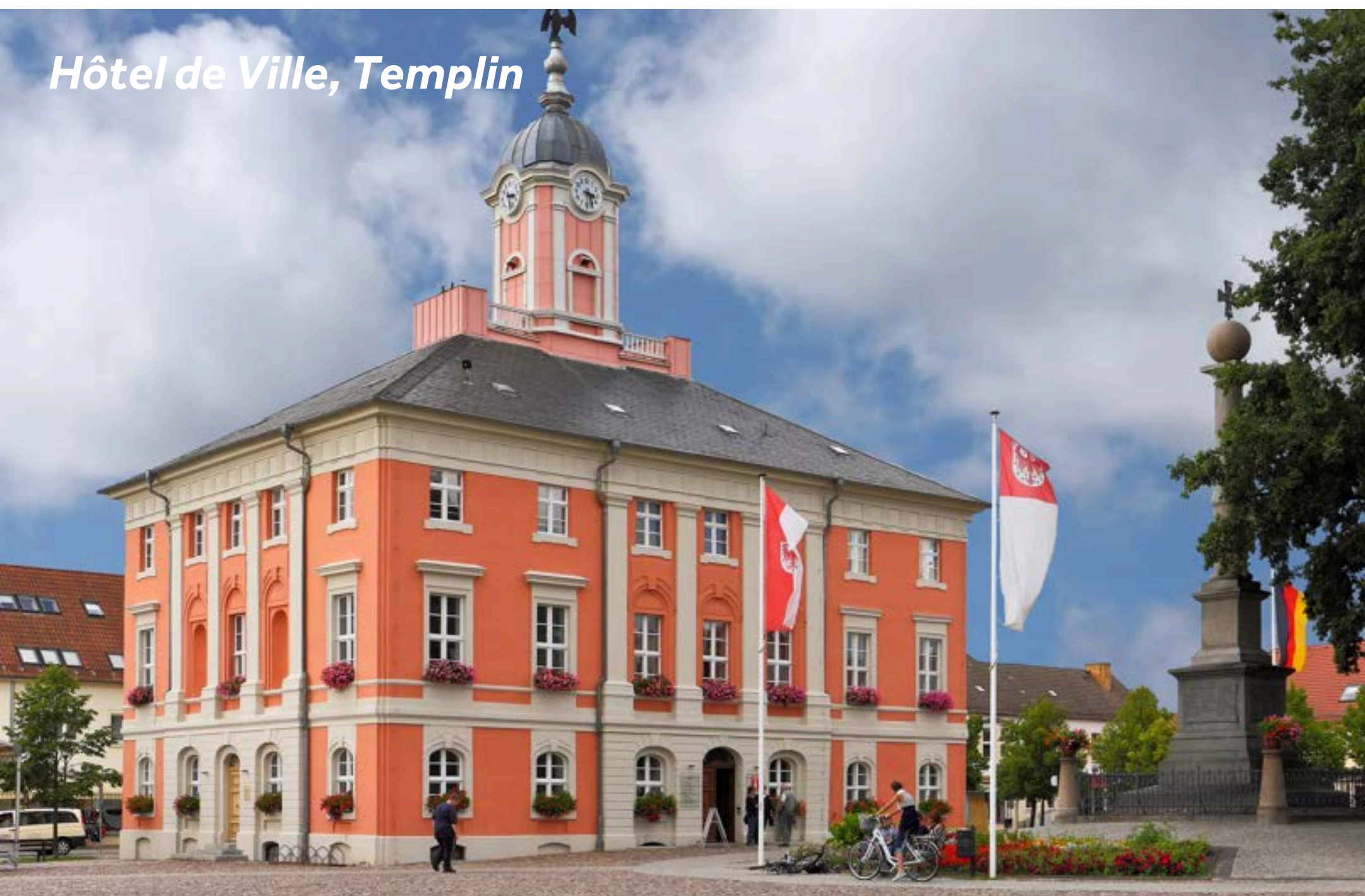
Hôtel de Ville, Templin