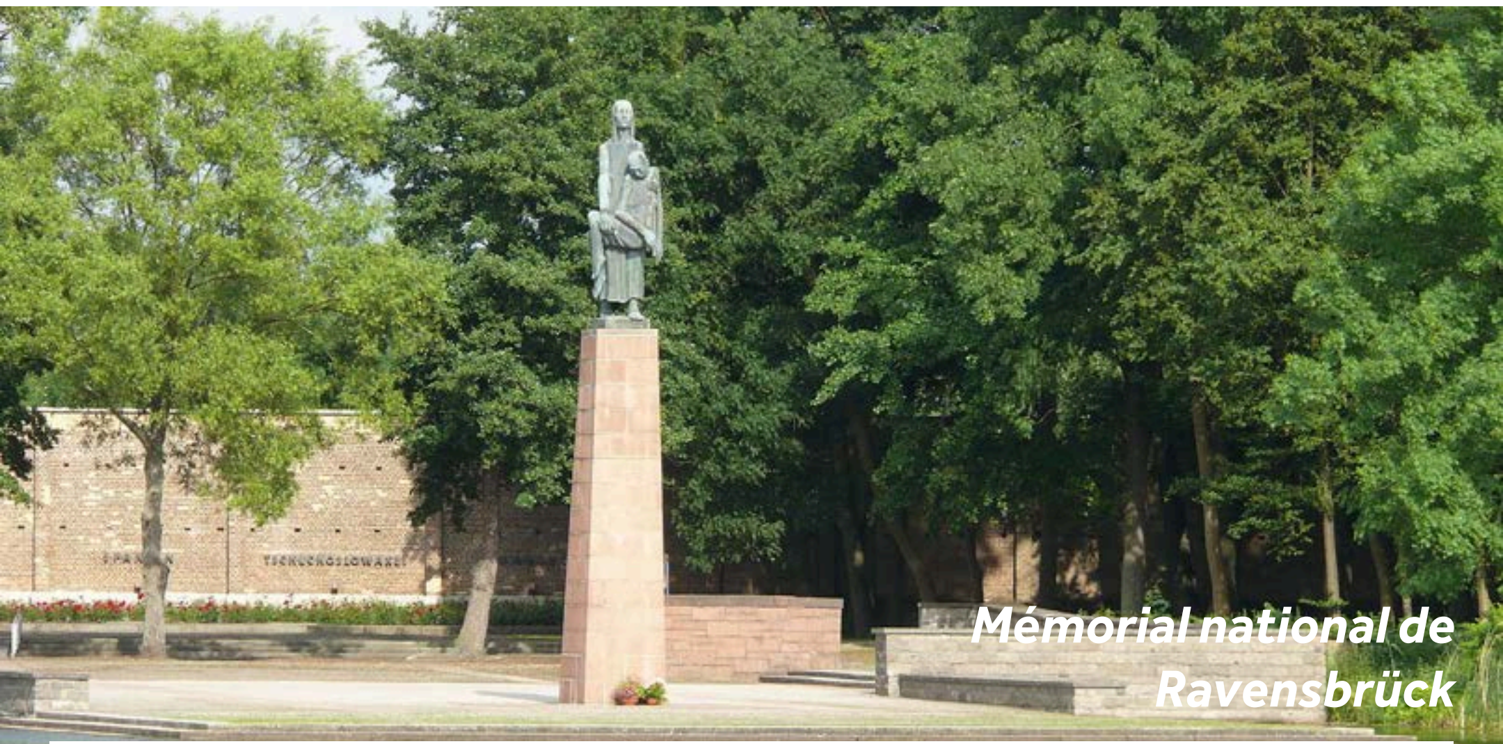
Mémorial national de Ravensbrück

Fürstenberg, ou 'Wasserstadt' (ville d'eau), doit son surnom à sa particularité unique en Allemagne : la ville est située sur trois îles entre les lacs Röblin, Baalen et Schwedt.