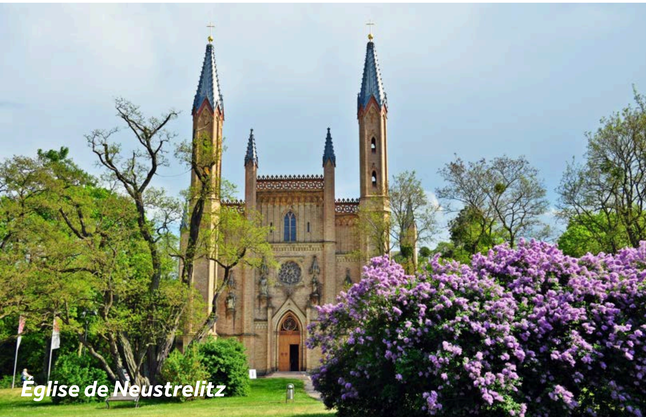
Église de Neustrelitz

Neustrelitz impressionne par son charmant centre-ville de style baroque et sa place du marché, unique en Europe, et à seulement cinq minutes à pied du port. Promenez-vous dans les magnifiques jardins du palais de Neustrelitz. Bien que le palais d'origine ait disparu, les jardins demeurent intacts avec ses sculptures, ses fontaines et ses différentes bâtisses allant du néo-classique au néo-gothique.