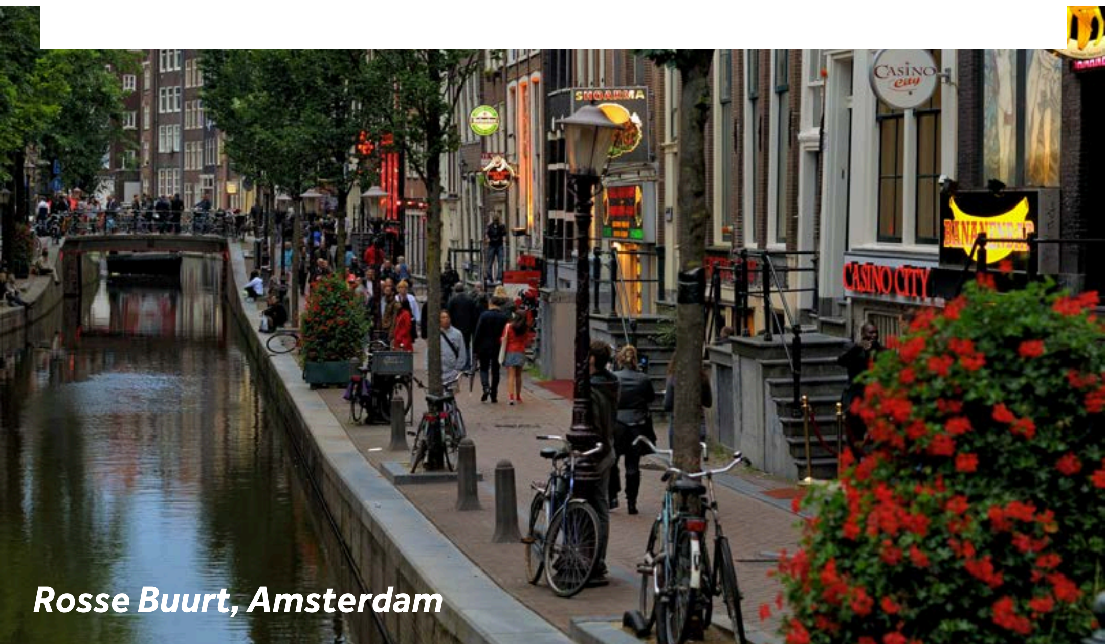
Rosse Buurt, Amsterdam

Das zentrale Rotlichtviertel Amsterdams ist das bekannteste der Stadt und zieht Besucher mit seiner einzigartigen Mischung aus Geschichte und Nachtleben an. Entlang der malerischen Grachten finden Sie hier eine besondere Kombination aus Bars, Erotikshops, Museen und historischen Sehenswürdigkeiten – ein faszinierender Einblick in die weltoffene und tolerante Seele Amsterdams.