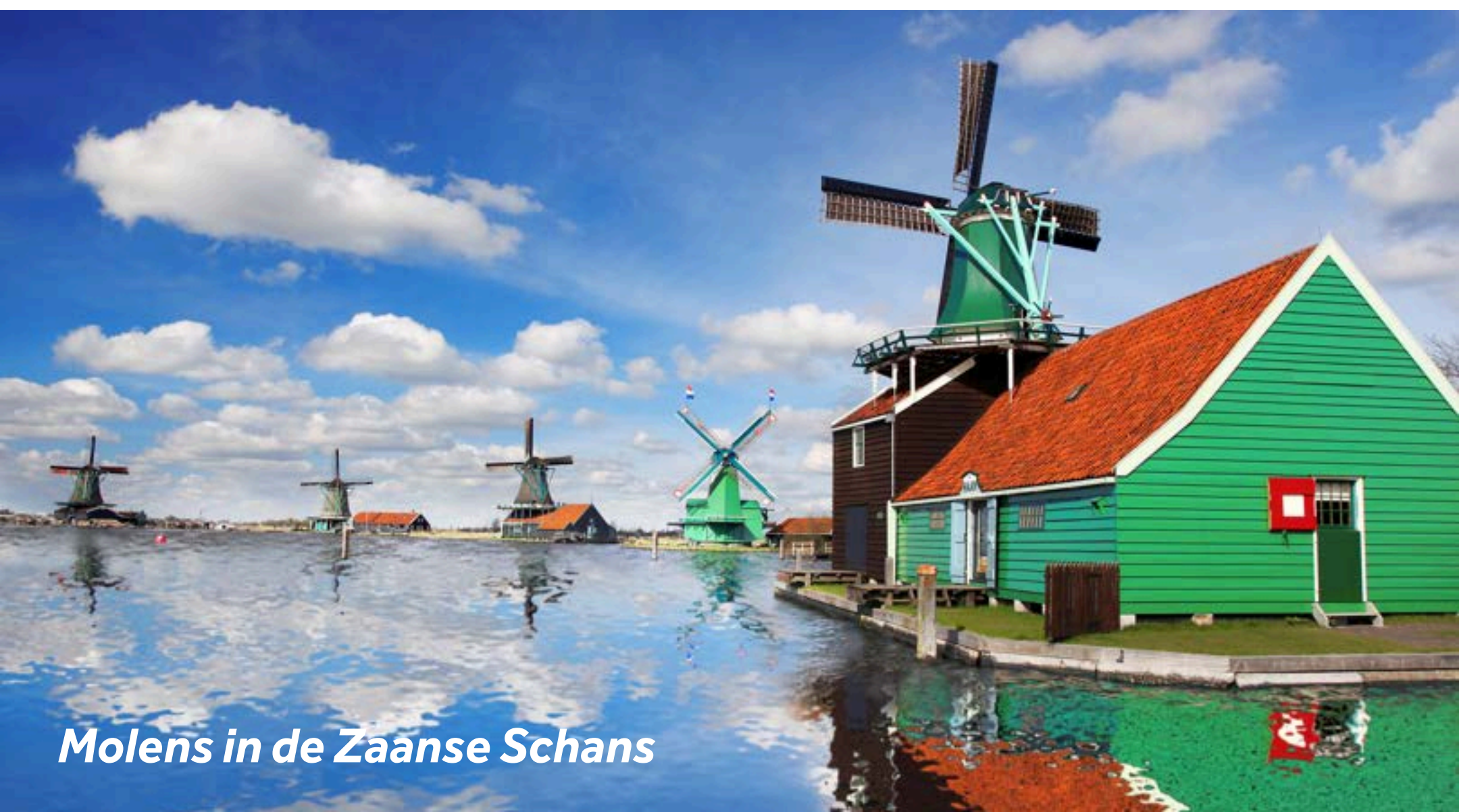
Molens in de Zaanse Schans