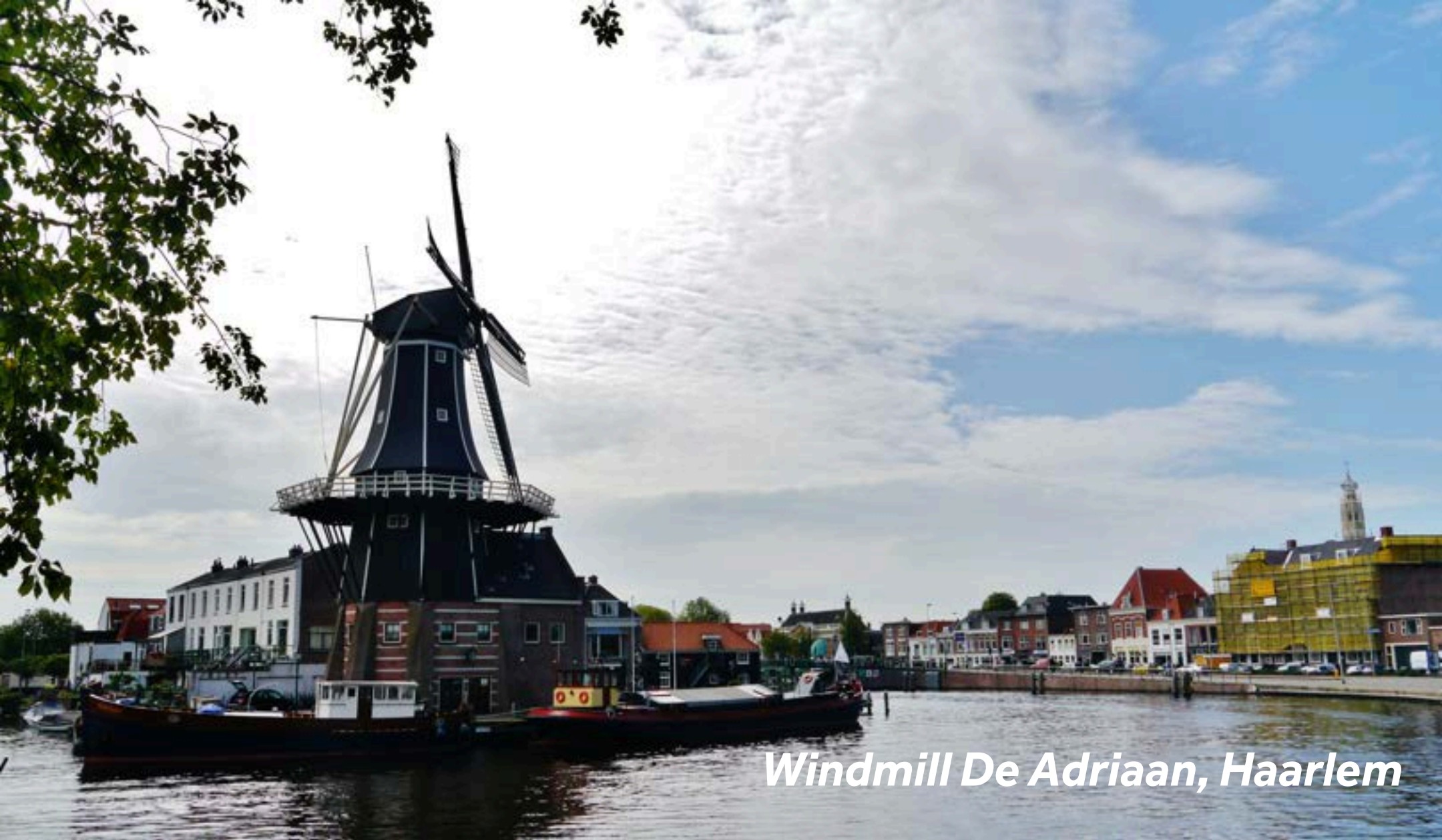
Windmill De Adriaan, Haarlem