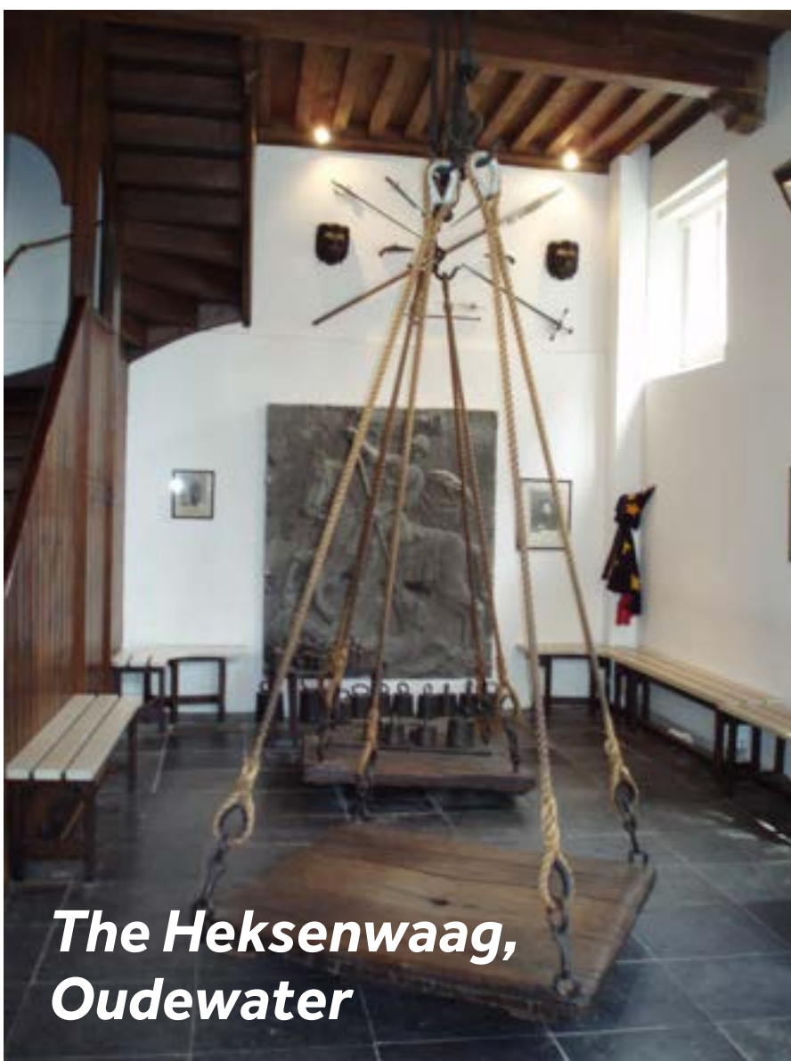
The Heksenwaag, Oudewater

Oudewater ist eine der ältesten Städte der Niederlande mit rund 250 denkmalgeschützten Gebäuden. Sie werden von den kleinen Boutiquen und Restaurants begeistert sein. Doch die Hauptattraktion des Ortes ist die Heksenwaag. Hier fanden im 16. Jahrhundert die Hexenprozesse statt.