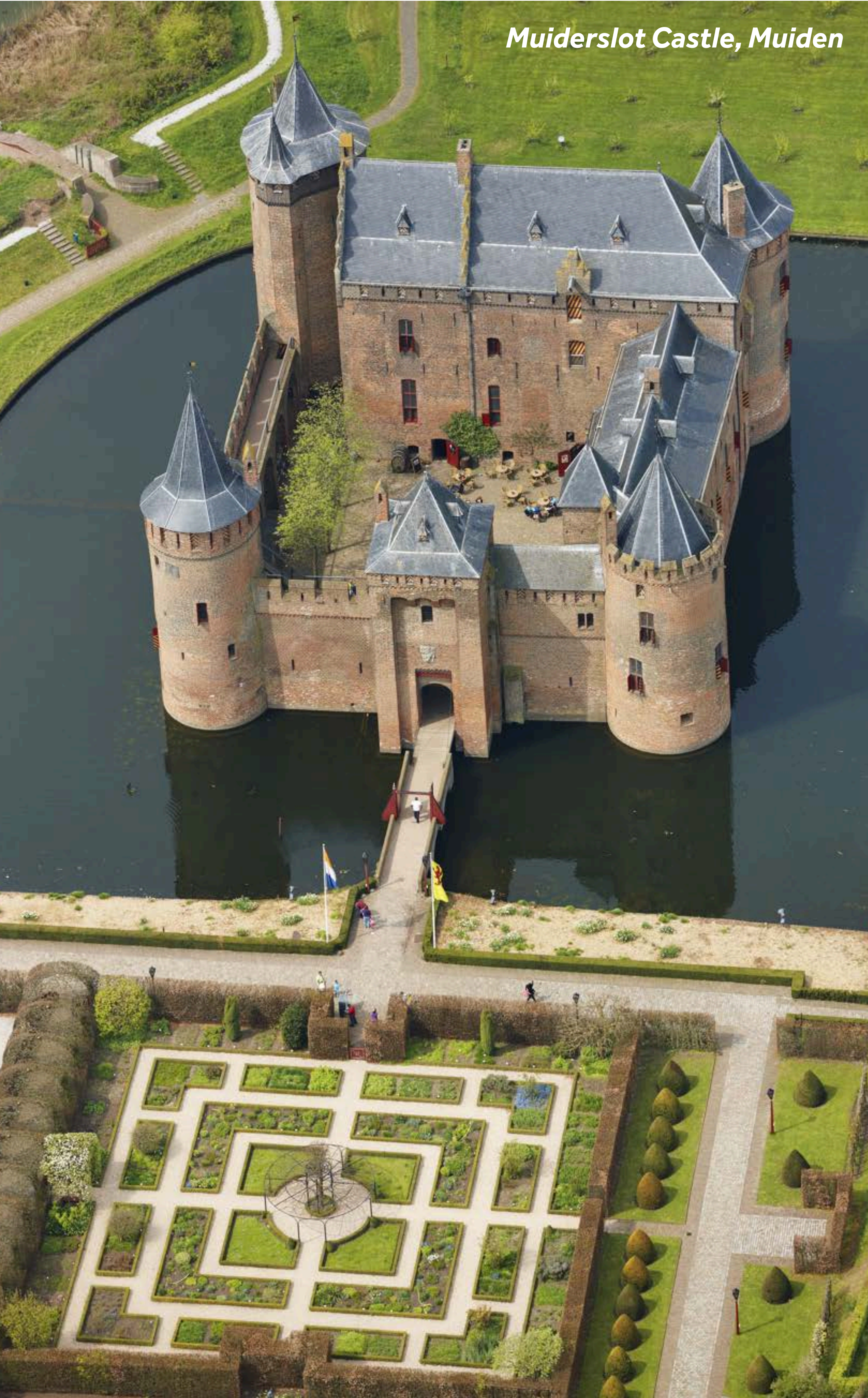
Muiderslot Castle, Muiden