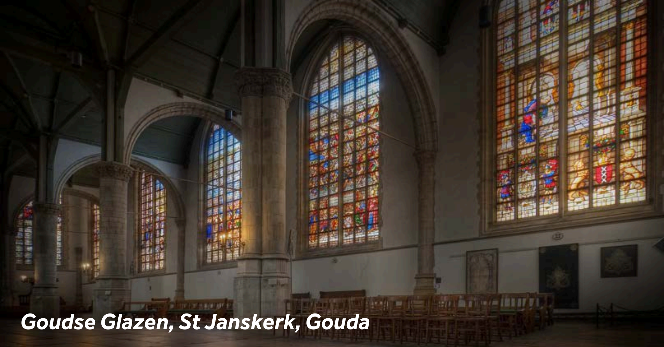
Goudse Glazen, St Janskerk, Gouda