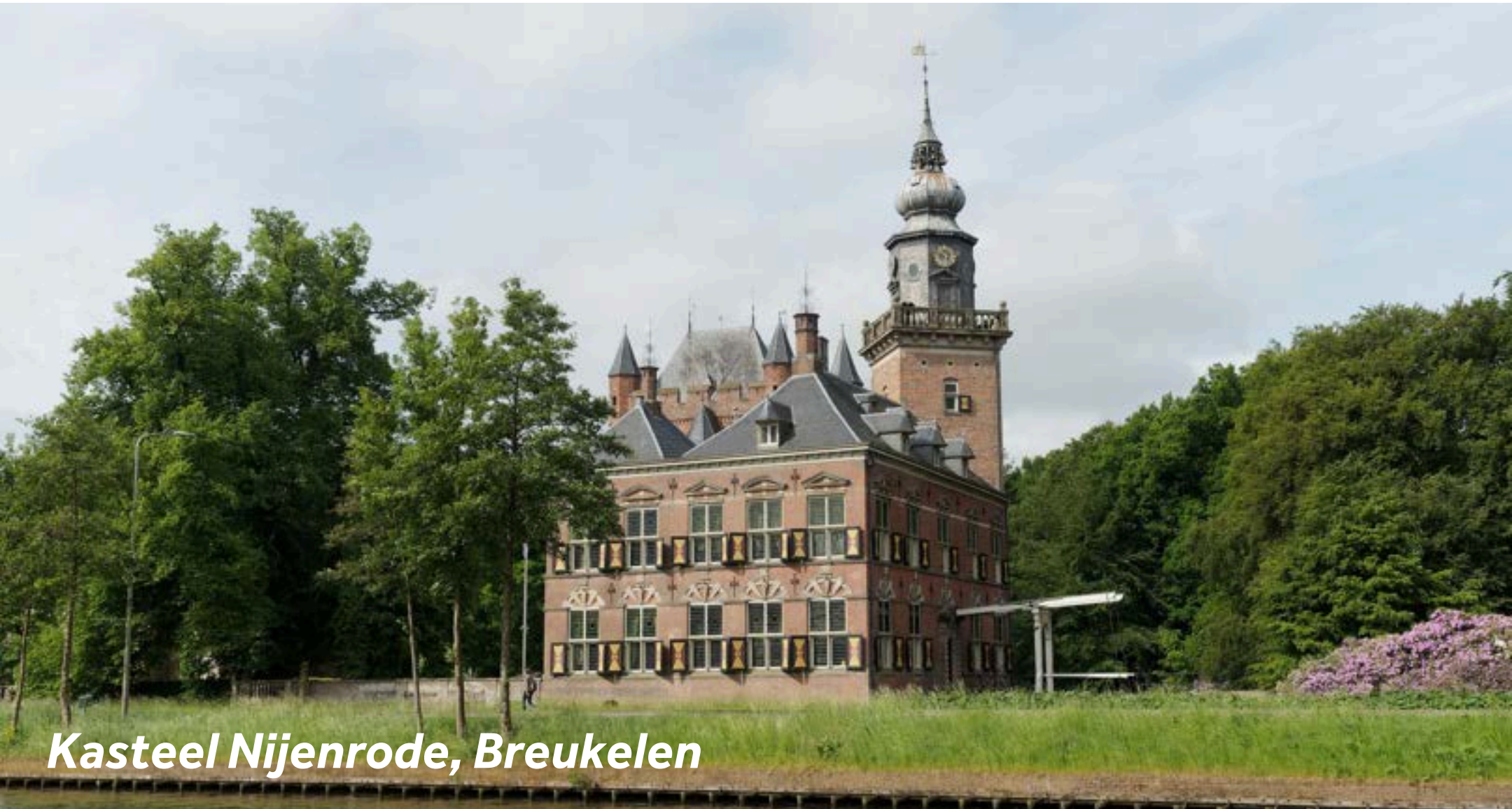
Kasteel Nijenrode, Breukelen

Breukelen ist eine bezaubernde Stadt im Herzen der Niederlande und bietet eine perfekte Mischung aus Geschichte, Kunst und Entspannung. Beginnen Sie Ihren Tag mit einem Spaziergang rund um das wunderschöne Schloss Gunterstein und seinen ruhigen Park – die historischen Anlagen sind der ideale Ort zum Abschalten. Für einen Hauch Kultur besuchen Sie die Galerie Peter Leen XL, in der zeitgenössische Werke lokaler Künstler ausgestellt werden. Lassen Sie den Tag entspannt in der Wine Bar 't Stichtse Pakhuis ausklingen – eine gemütliche Location mit exzellenter Weinauswahl in stimmungsvoller Atmosphäre.