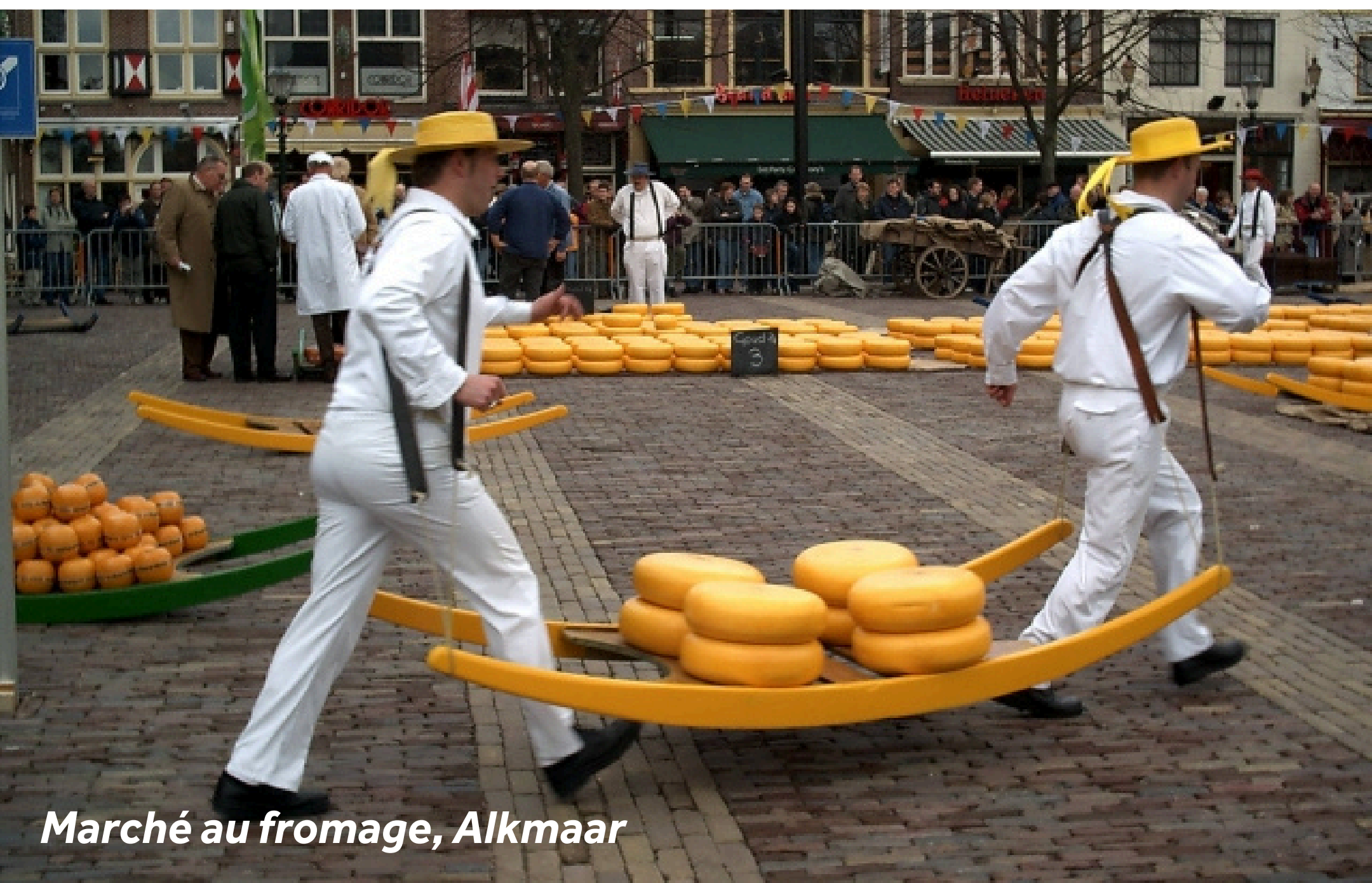
Marché au fromage, Alkmaar

Alkmaar offre aussi de magnifiques panoramas et un air frais côtier à apprécier à pied ou à vélo.