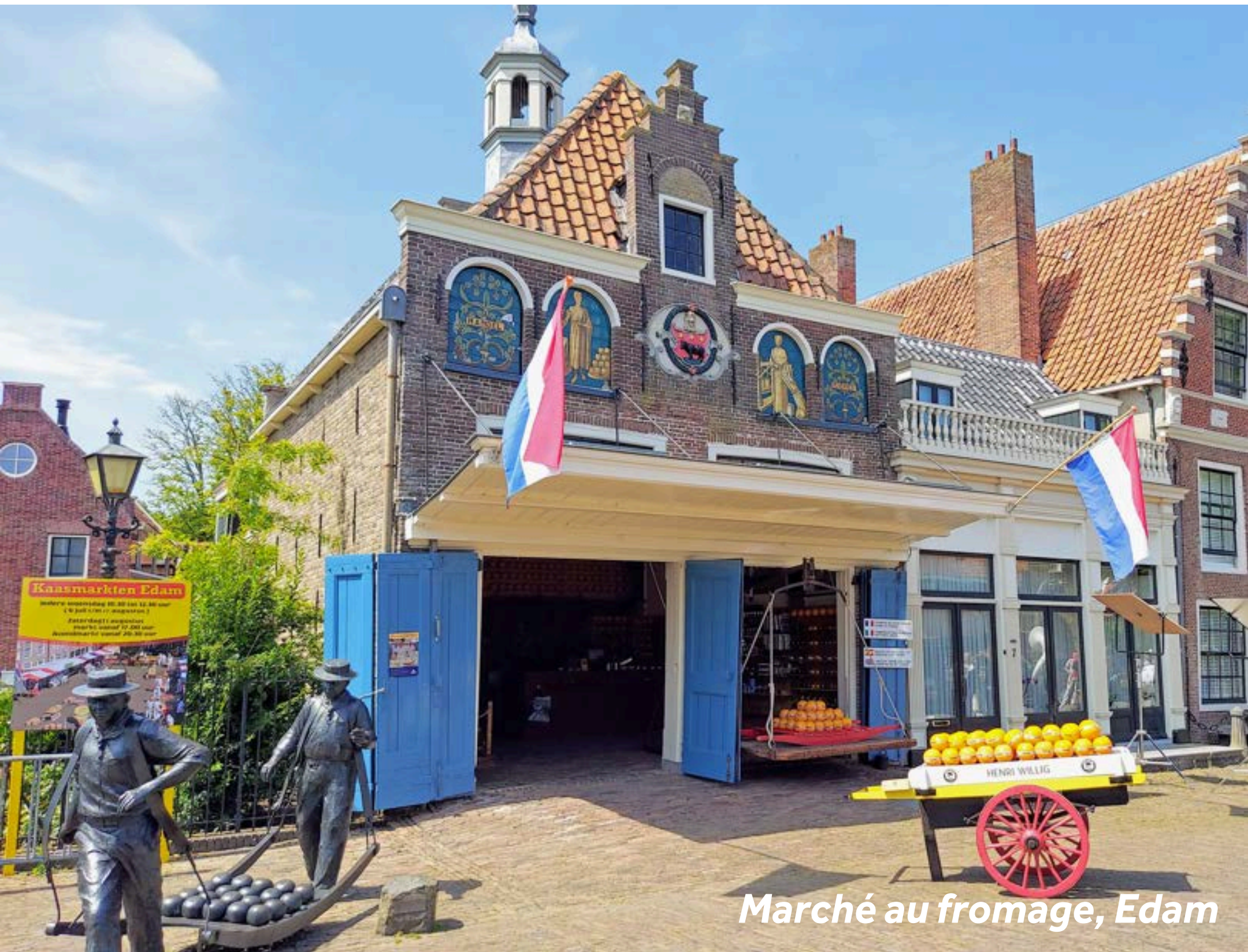
Marché au fromage, Edam

Célèbre dans le monde entier pour son délicieux fromage, cette charmante ville célèbre fièrement son héritage. Au cœur d'Edam se trouve Damplein, une petite place où vous trouverez le musée Edam, célèbre pour sa cave flottante. De là, faites quelques pas jusqu'à la Grote Kerk, la plus grande église à trois nefs d'Europe, où vous pourrez profiter d'une vue imprenable sur la région environnante. Si vous visitez en été, ne manquez pas le marché au fromage d'Edam, qui a lieu tous les mercredis en juillet et août. Pour compléter votre visite, explorez The Story of Edam Cheese, le musée du fromage d'Edam, où vous pourrez en apprendre davantage sur l'histoire fromagère de la ville lors d'une visite guidée avec dégustation. Réservez vos billets sur tickets.thestoryofedamcheese.com . Terminez votre journée avec un arrêt à l'élégante tour Speeltoren, tout ce qui reste de l'église médiévale du XVe siècle qui se trouvait autrefois sur ce site.