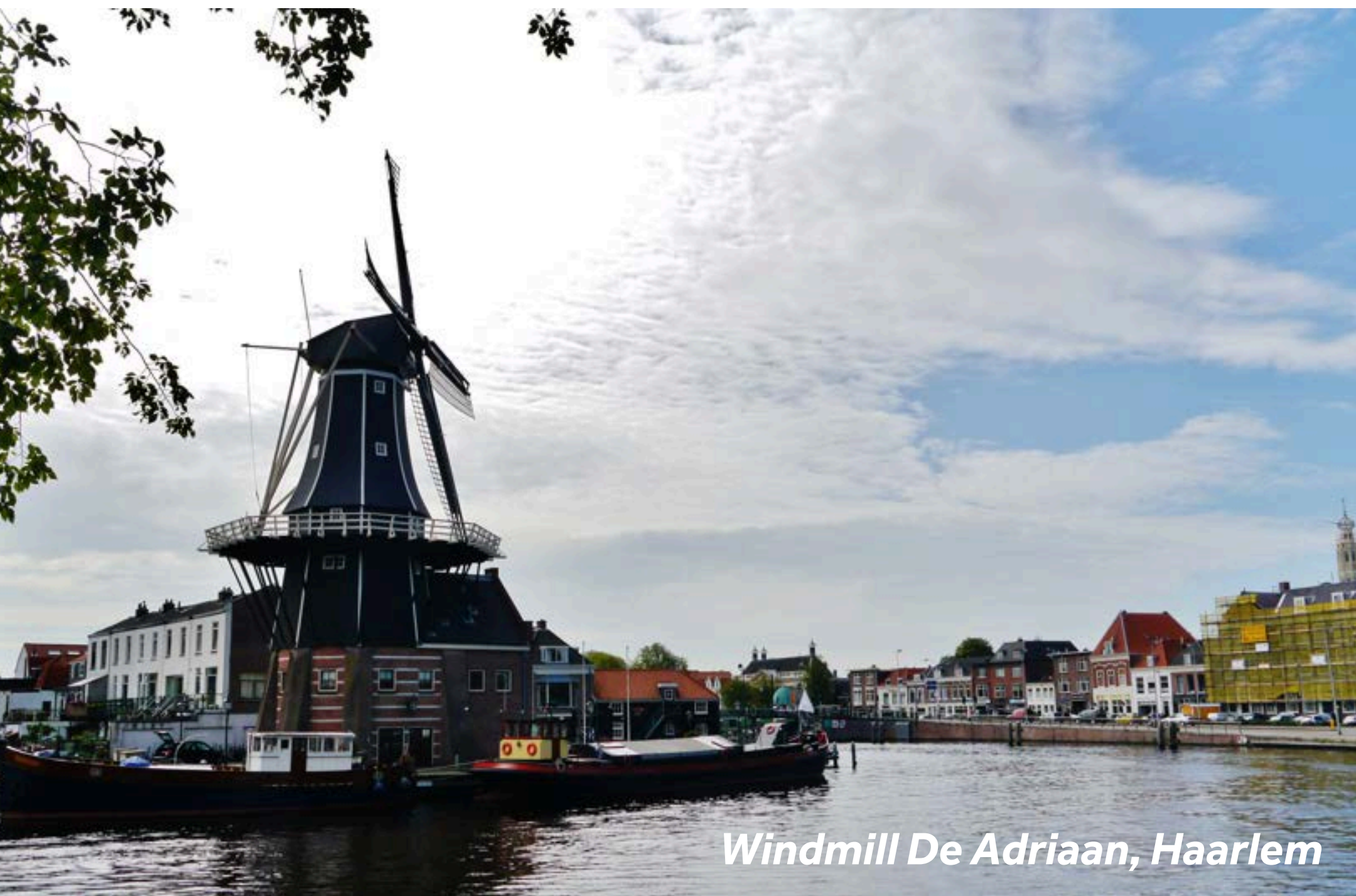
Windmill De Adriaan, Haarlem

Préparez votre itinéraire personnalisé à travers Haarlem, à pied ou à vélo, sur le site Visithaarlem.com/en/wandel-en-fietsroutes/ .