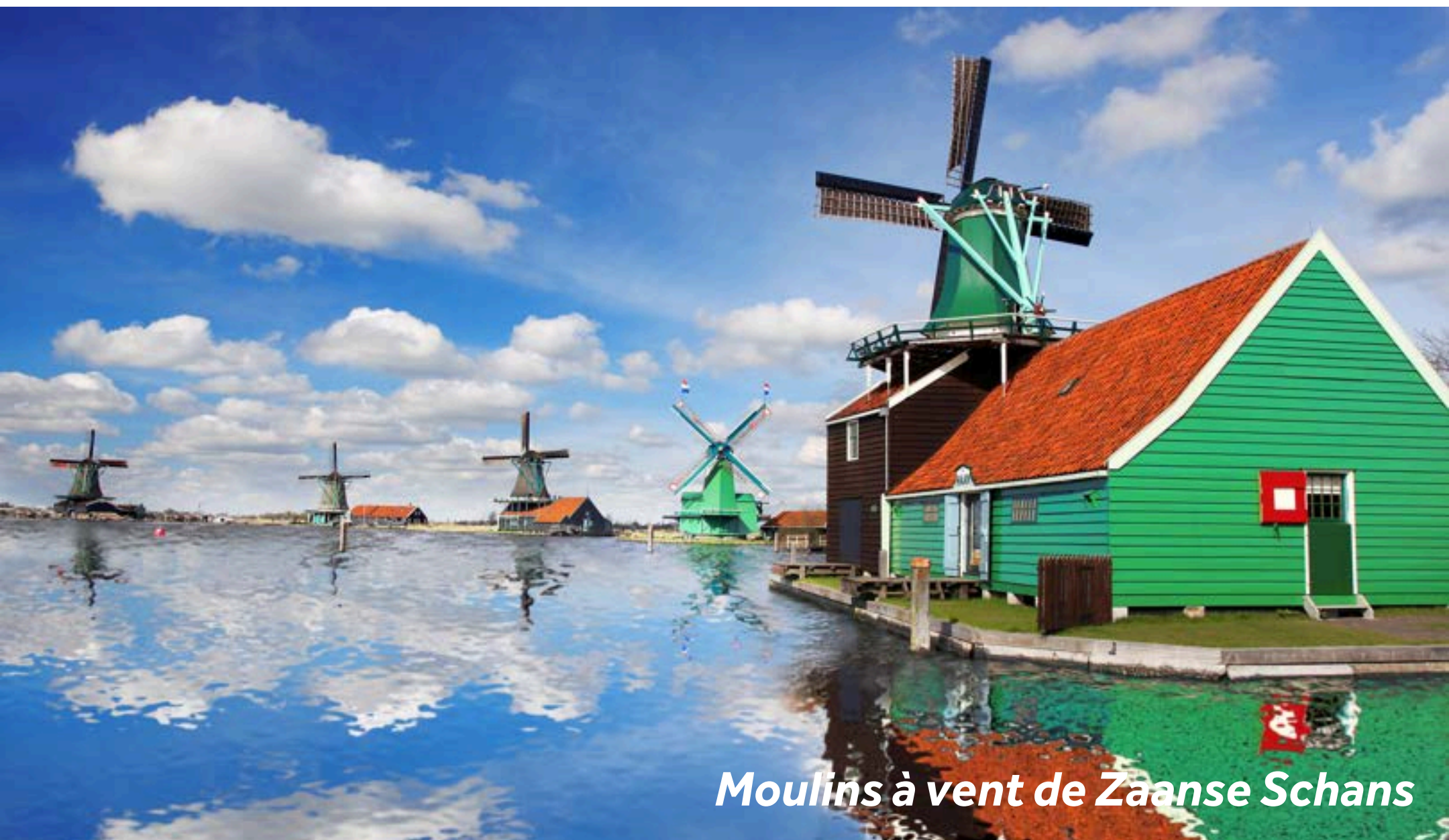
Moulins à vent de Zaanse Schans

Faites un pas dans un conte de fées en vous arrêtant à Zaanse Schans, un charmant village néerlandais célèbre pour ses 13 moulins à vent emblématiques. Le long de la pittoresque Kalverringdijk, les visiteurs peuvent découvrir des moulins historiques tels que De Huisman, De Kat et De Zoeker, témoins du savoir-faire traditionnel néerlandais. À proximité, le Musée Zaanse Schans enrichit l'expérience avec la fascinante Verkade Experience, où d'anciennes machines à chocolat et à biscuits prennent vie. Les amateurs de fromage apprécieront la ferme-fromagerie Catharina Hoeve, où vous pourrez assister à une démonstration traditionnelle de fabrication de fromage et découvrir la culture fromagère néerlandaise.