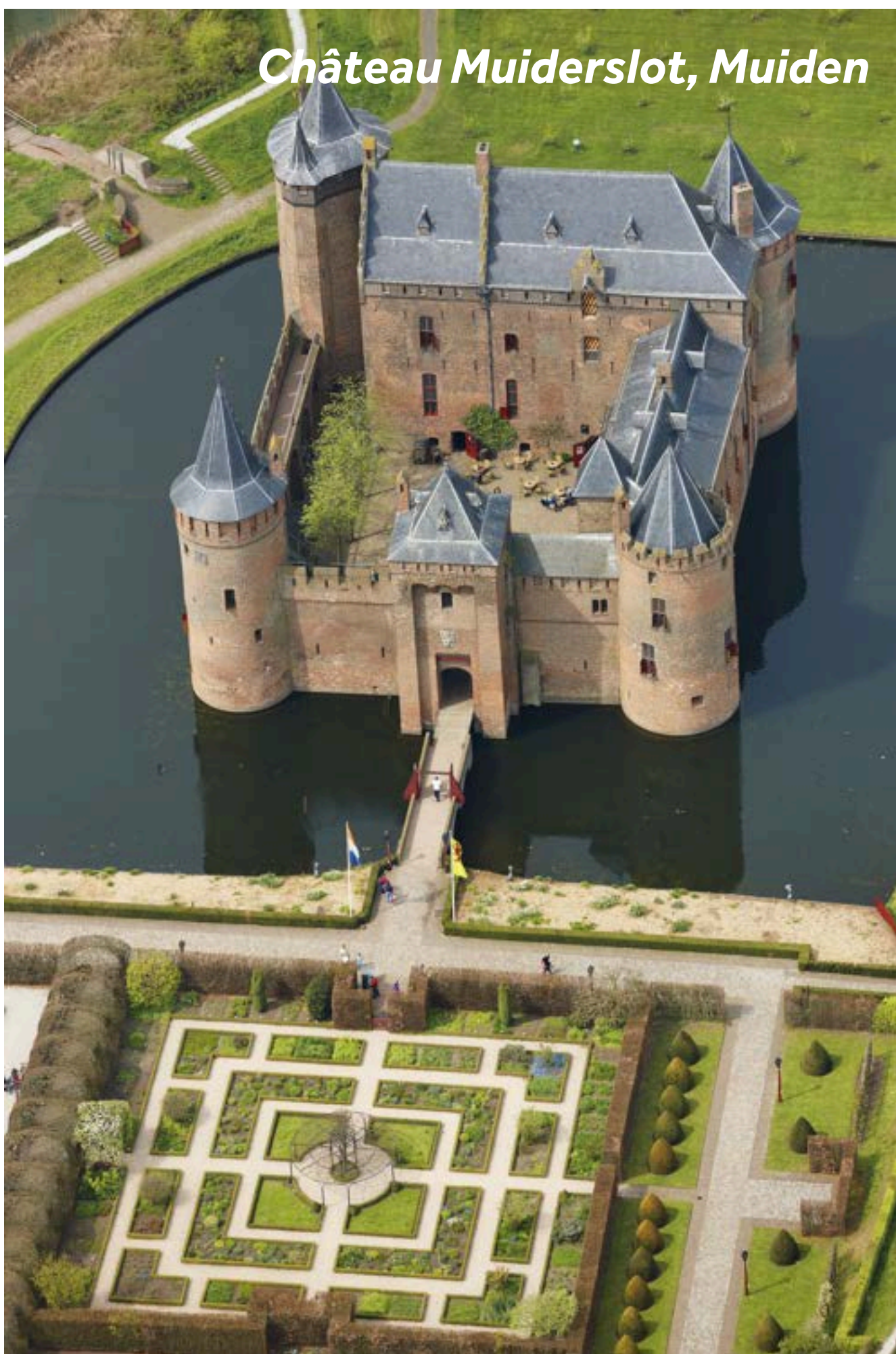
Château Muiderslot, Muiden

Faites une pause à Muiden, où vous pourrez vous détendre dans les cafés animés situés au bord de l'écluse ou profiter d'une agréable promenade jusqu'aux plages de l'IJmeer, à seulement 10 minutes à pied. Cette ville entourée de verdure, située