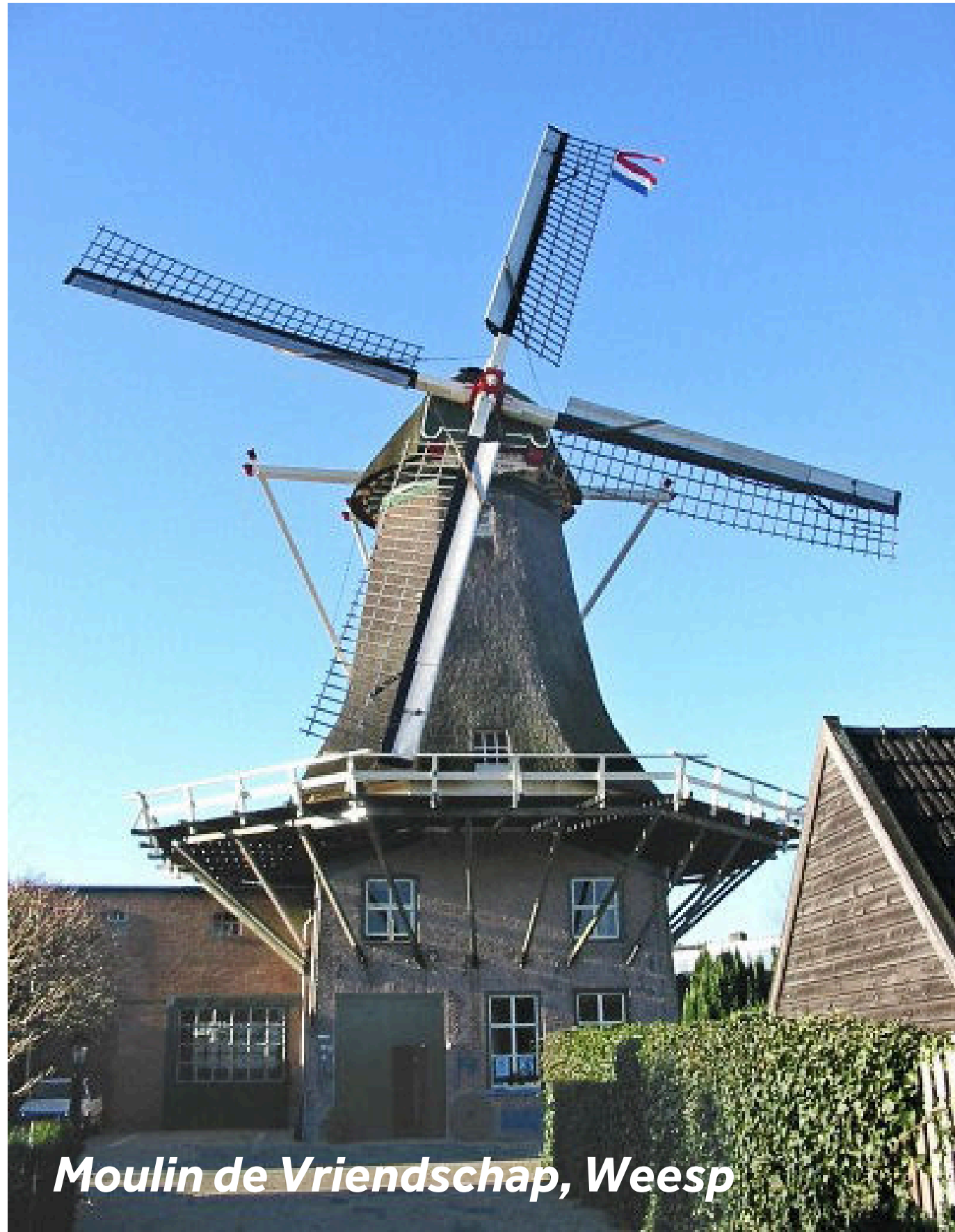
Moulin de Vriendschap, Weesp

Weesp offre une multitude de rues et d'attractions historiques (arrêtez-vous à l'office de tourisme pour prendre une carte) et est célèbre pour avoir produit la première porcelaine hollandaise, en 1759. De nos jours, la ville est renommée pour son chocolat Van Houten, dont l'usine était basée dans la ville jusqu'en 1970. Le musée municipal