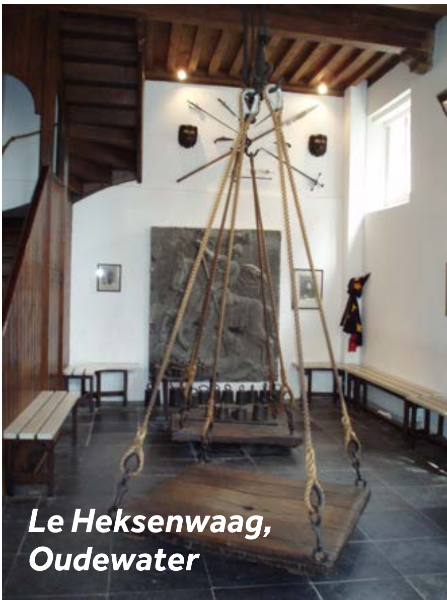
Le Heksenwaag, Oudewater

Oudewater est l'une des plus anciennes villes des Pays-Bas avec environ 250 bâtiments protégés dans la ville. Bien qu'elle abrite quelques petites boutiques et restaurants, l'attraction principale est le Heksenwaag, où des procès de sorcières ont eu lieu au XVIème siècle. Elles étaient pesées sur des