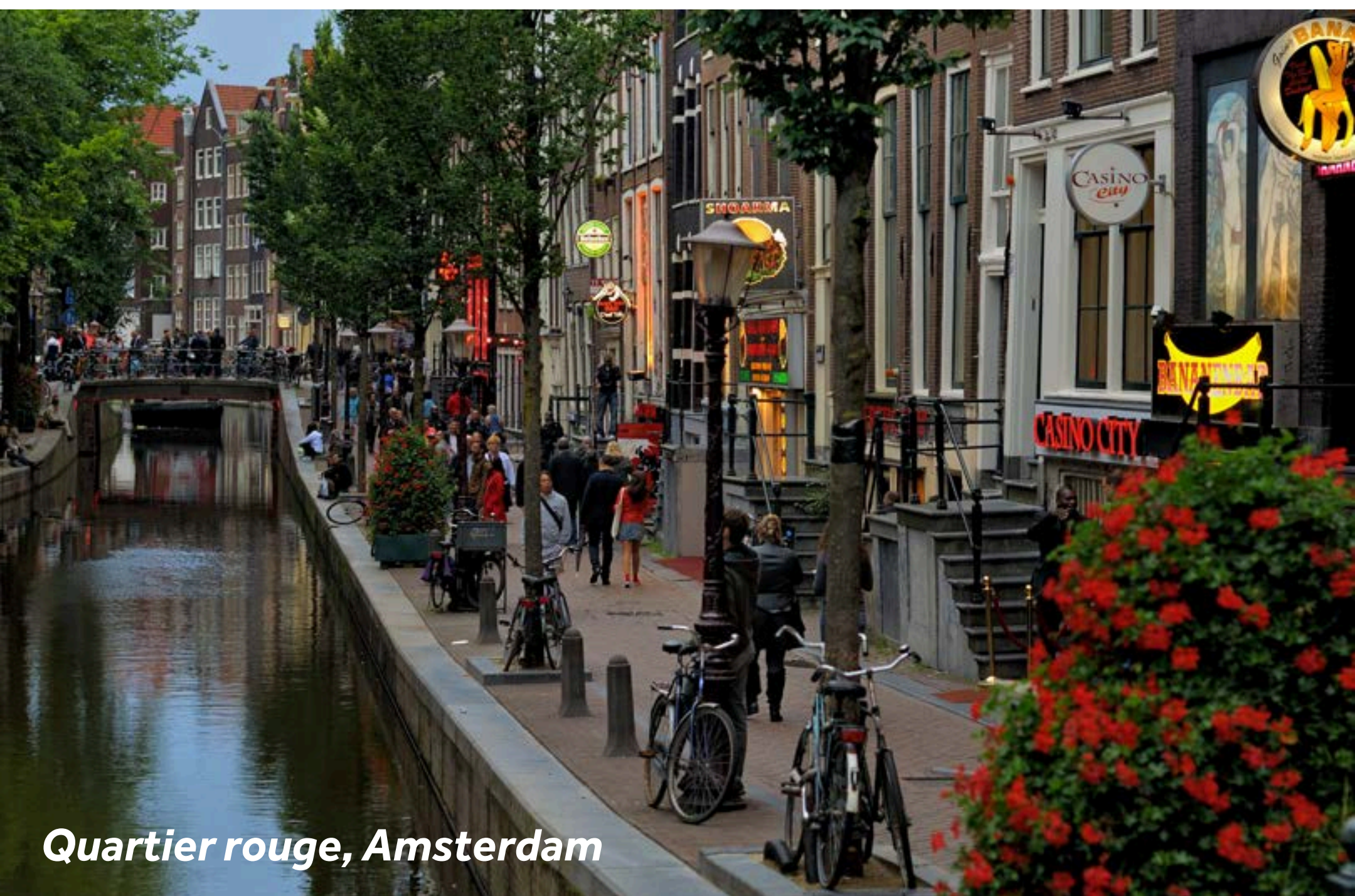
Quartier rouge, Amsterdam

Idéale pour une séance de lèche-vitrine et quelques rêves de grandes marques. Pour des trouvailles plus accessibles, direction la Kalverstraat. Le célèbre quartier rouge du centre d'Amsterdam est le plus connu des trois et attire les visiteurs par son mélange unique d'histoire et de vie nocturne. Le long de ses pittoresques canaux, vous découvrirez un mélange de bars, boutiques pour adultes, musées et sites historiques, offrant un aperçu unique de l'esprit ouvert d'Amsterdam.