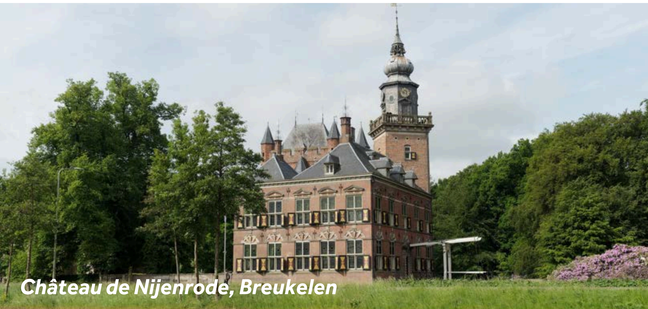
Château de Nijenrode, Breukelen

Breukelen est une charmante ville au cœur des Pays-Bas, qui allie parfaitement histoire, art et détente. Commencez votre journée par une promenade autour du magnifique château de Gunterstein et de son parc paisible : un cadre historique idéal pour se ressourcer. Ne manquez pas une visite au Kasteel Nijenrode, un château splendide chargé d'histoire, aujourd'hui siège d'une université de commerce, où vous pourrez découvrir ses jardins et son passé fascinant. Pour une touche culturelle, rendez-vous à la Galerie Peter Leen XL, qui met en lumière des œuvres contemporaines d'artistes locaux. Terminez votre journée par une soirée relaxante au Wine Bar 't Stichtse Pakhuis, un lieu cosy proposant une excellente sélection de vins dans une ambiance chaleureuse et intime.