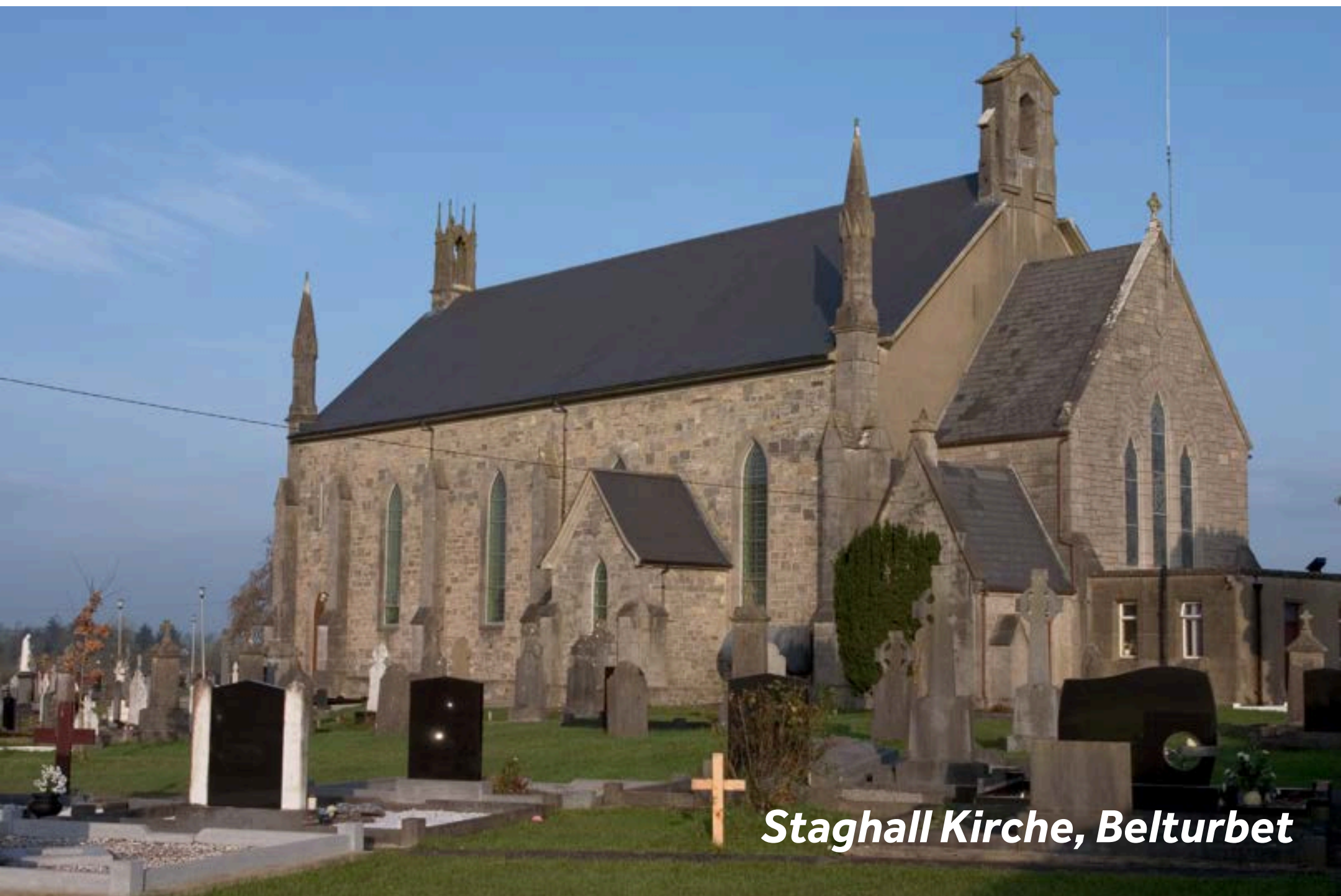
Staghall Kirche, Belturbet

Belturbet ist ein beschauliches und einladendes Städtchen am Kanal. Wenn Sie vom Ortseingang in Richtung Innenstadt gehen, stoßen Sie auf die wunderschöne Staghall Church.