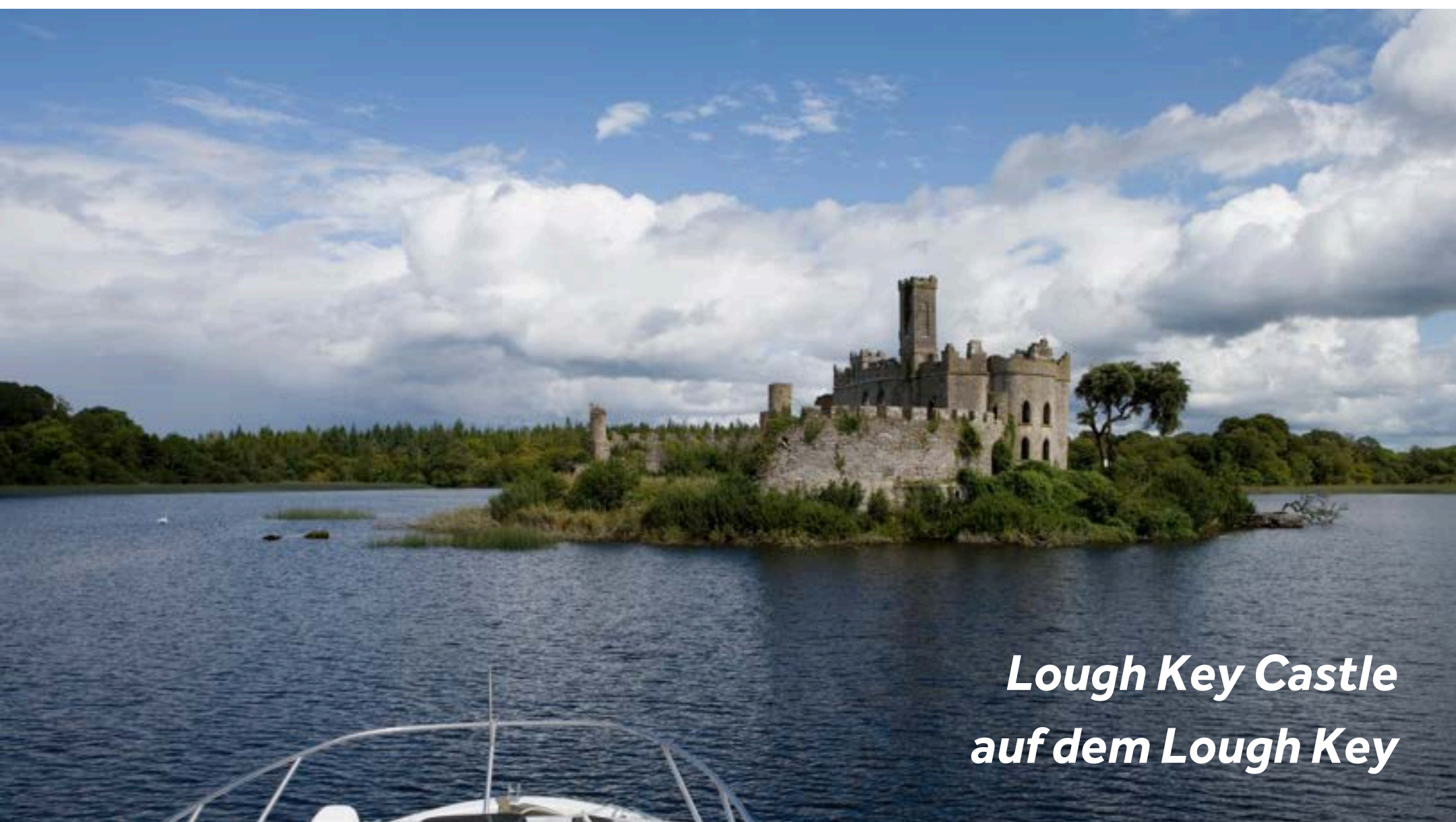
Lough Key Castle auf dem Lough Key