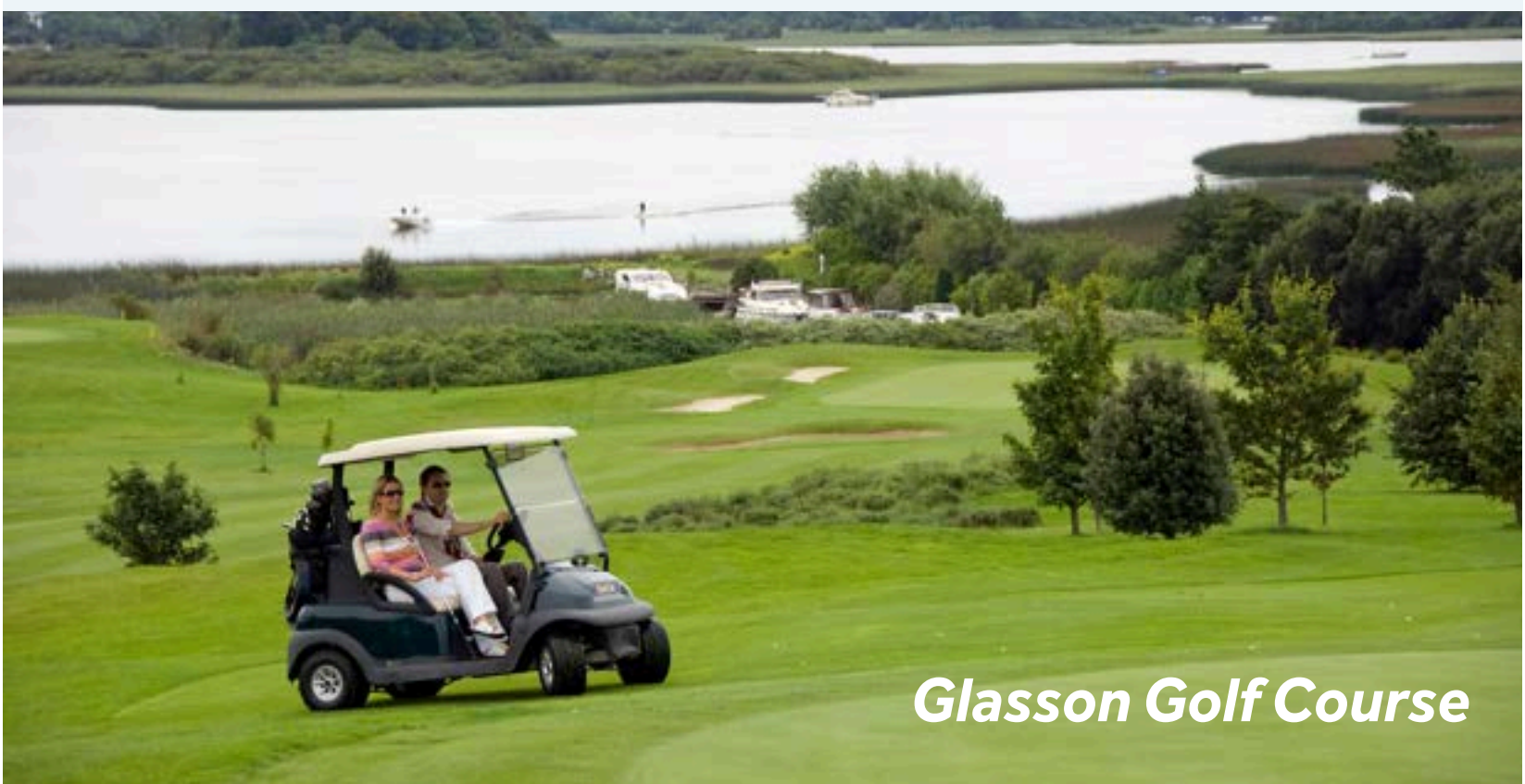
Glasson Golf Course

Am Südostufer von Lough Ree befindet sich der Glasson Golf Club mit Blick auf die herrliche Seenlandschaft. In nahen Hudson Bay gibt es den Athlone Golf Club, der bereits viele Male vom Irischen Golfverband für zahlreiche Turniere aller Leistungsklassen gewählt wurde.