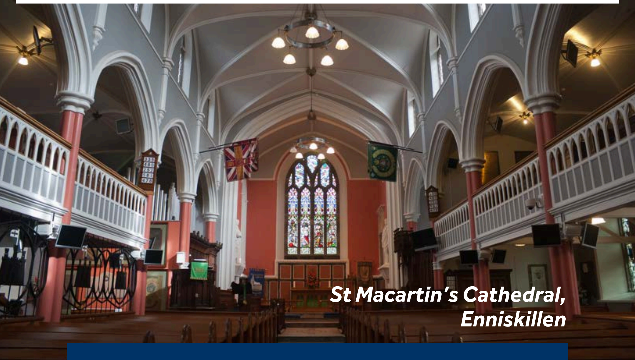
St Macartin's Cathedral, Enniskillen

Enniskillen ist die größte Stadt im County Fermanagh. Spazieren Sie durch die Innenstadt und besuchen Sie die beeindruckende anglikanische Kathedrale St Macartin. Planen Sie außerdem einen Besuch von Enniskillen Castle ein, ein Muss, das die reiche Geschichte der Stadt lebendig werden lässt. Am Stadtrand gibt es schöne Orte zum Anhalten und Genießen, darunter die Gärten nahe dem alten befestigten Herrenhaus Tully Castle. Besuchen Sie das imposante Castle Coole, ein prachtvolles Herrenhaus aus dem 18. Jahrhundert mit Landschaftspark, im Besitz des National Trust, perfekt für einen erfrischenden Spaziergang.