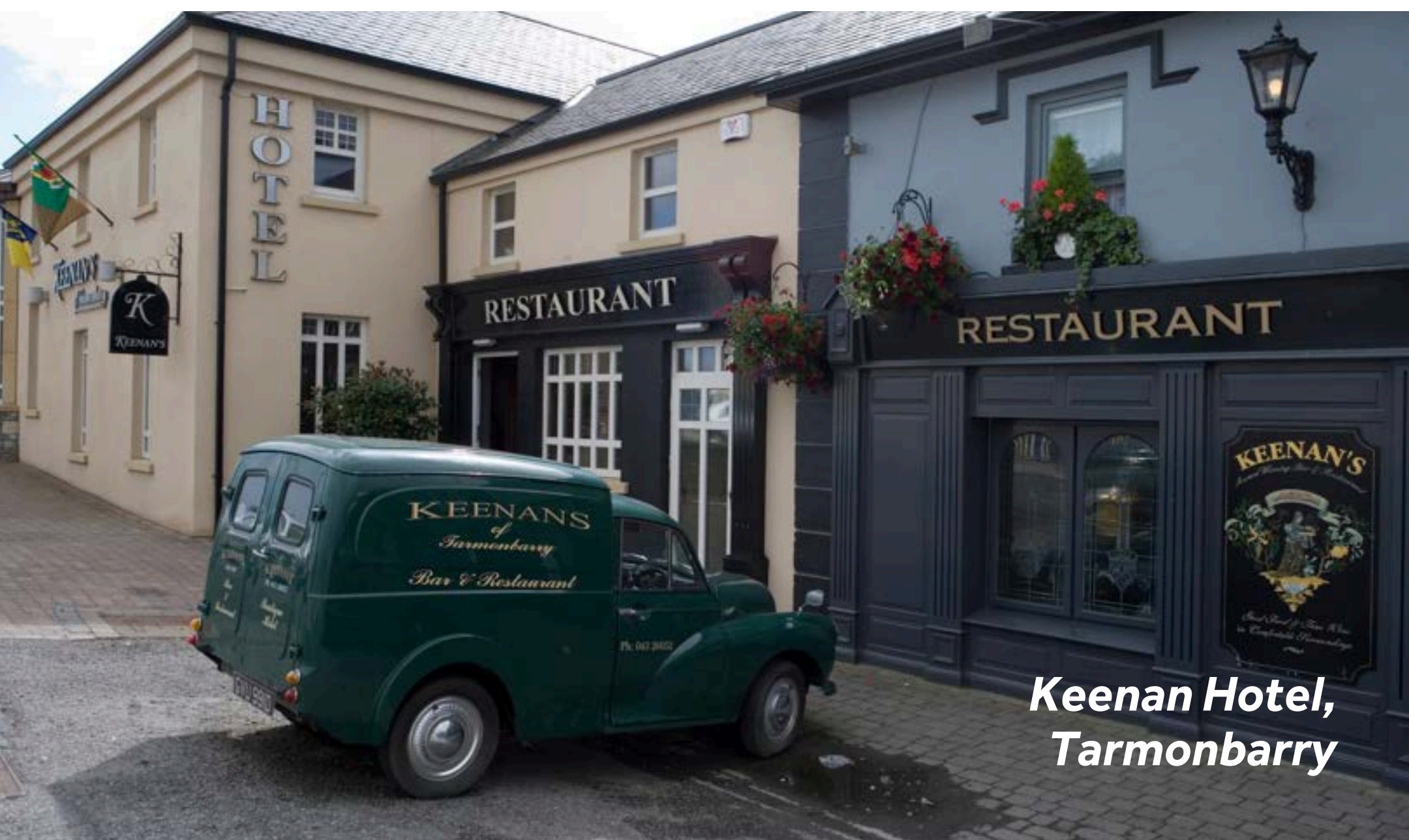
Keenan Hotel, Tarmonbarry