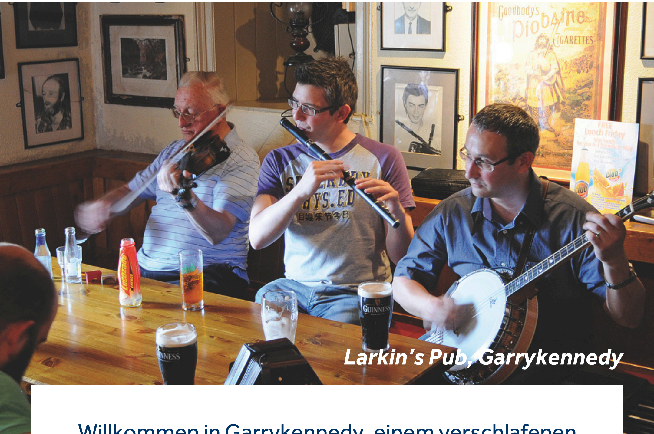
Larkin's Pub, Garrykennedy

Willkommen in Garrykennedy, einem verschlafenen Dorf, das einst als Residenz für die mächtige Kennedy Familie diente. Der Hafen war früher ein wichtiger Anlaufpunkt für den Transport von Waren auf dem Kanal, vor allem für Schiefer aus den nahegelegenen Minen. Besuchen Sie das alte Kennedy Castle, das im 15. Jahrhundert erbaut wurde, oder erkunden Sie den Waldweg am Ufer des Sees und die Wälder. Hier haben Sie zudem Zugang zum größten See Irlands, dem Lough Derg, um zu angeln oder verschiedenen Wassersportarten nachzugehen.