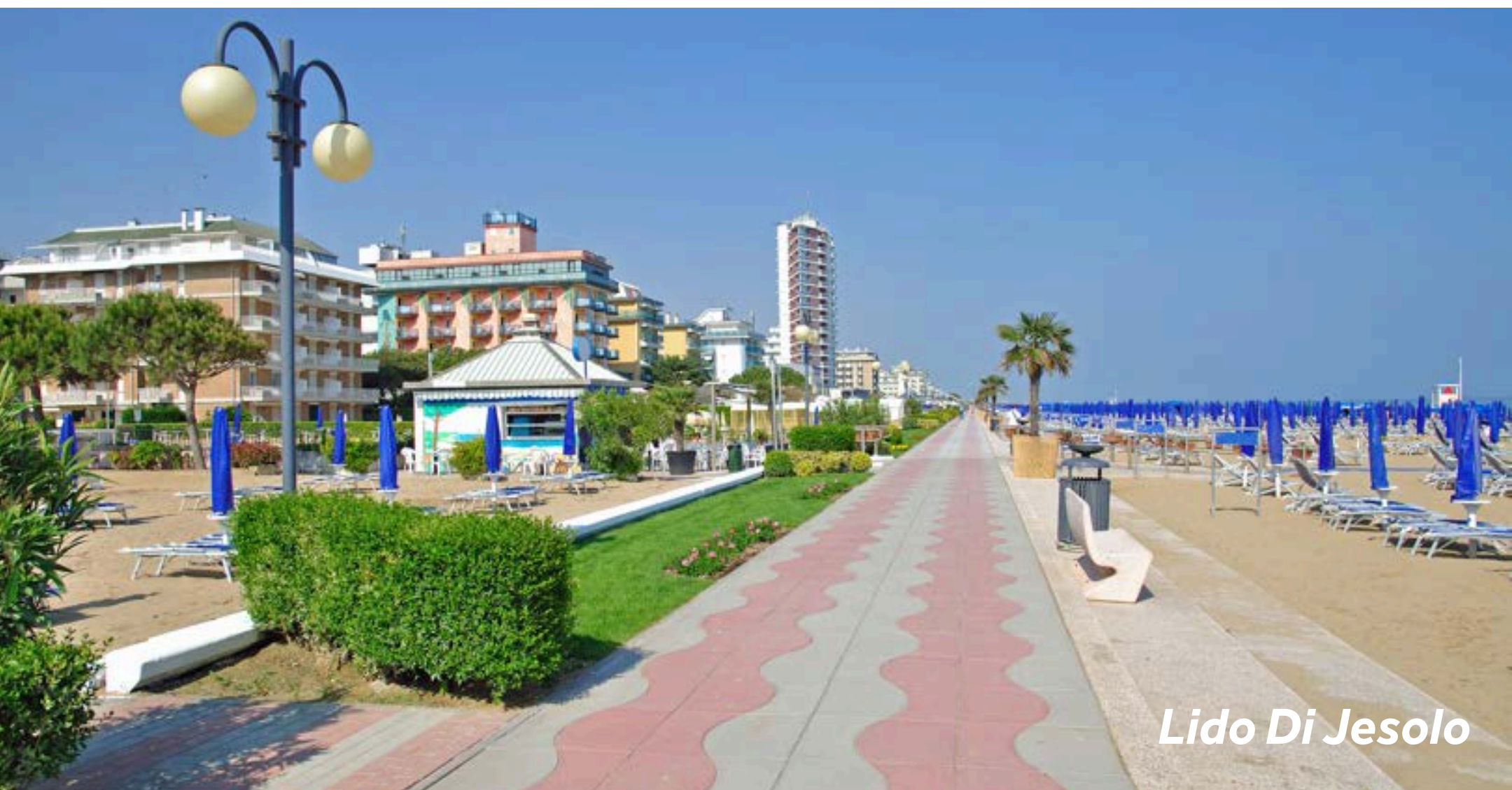
Lido Di Jesolo