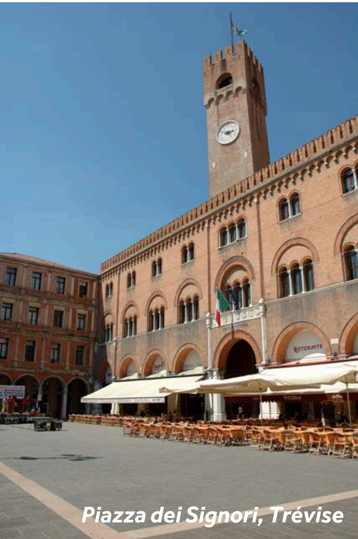
Piazza dei Signori, Trévis

Trévis est une belle ville fortifiée et les défenses de la ville, ses douves et ses passerelles imposantes en font un lieu majestueux. Trévis a une grande tradition gastronomique, et vous y trouverez de nombreux restaurants. La Piazza dei Signori est le cœur du centre historique de Trévis. Le plus grand bâtiment de la place, autrefois le siège du Grand Conseil de la ville, qui a été fortement bombardé pendant la Seconde Guerre mondiale. Sous sa loggia,