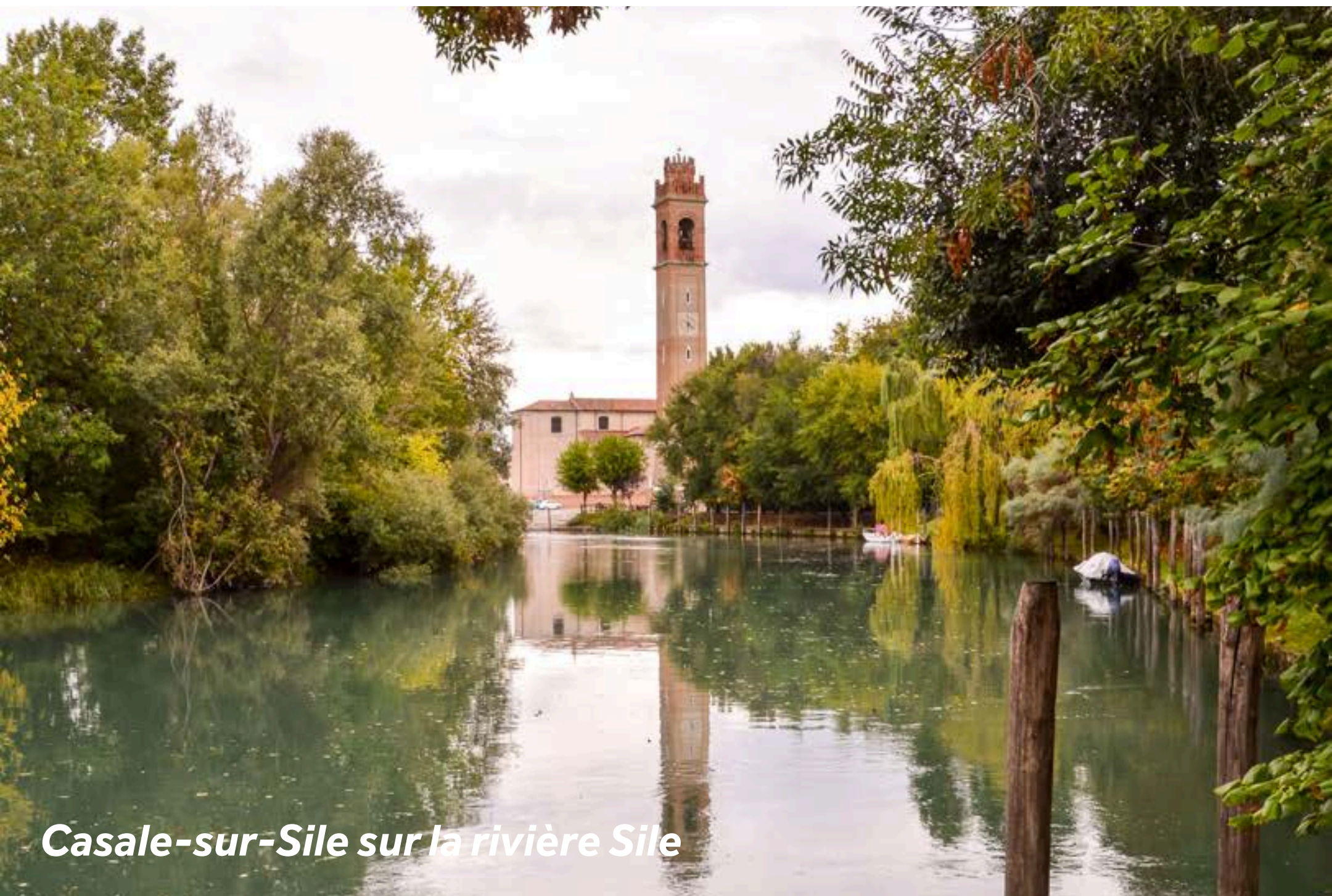
Casale-sur-Sile sur la rivière Sile

Casale-Sul-Sile est située au coeur de la réserve naturelle du Sile. Elle a été fondée en 1100 et fut habitée par les bateliers qui transportaient des marchandises et des personnes vers la lagune vénitienne.