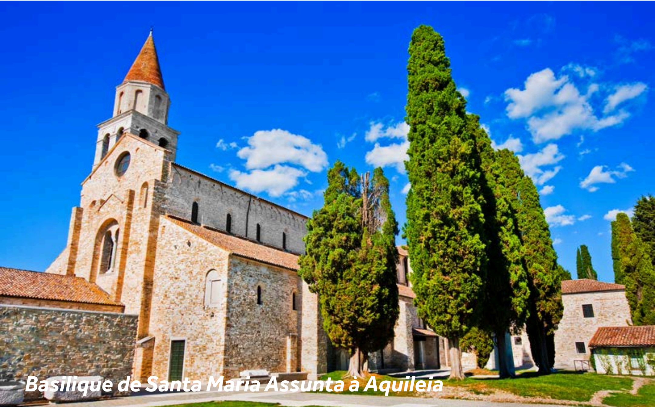
Basilique de Santa Maria Assunta à Aquileia

Aquileia a été fondée en 181 avant J.C., et fut l'une des bases de la puissance romaine dans cette partie de l'Europe. Elle fut autrefois une des plus grandes villes de l'Empire romain. La ville, stratégiquement située à des fins militaires et commerciales, est devenue l'une des plus grandes et des plus riches de l'ensemble de l'Empire romain, appelée la "deuxième Rome". Désormais classée au patrimoine mondial de l'UNESCO, il y a beaucoup à voir dans ce « musée en plein air » si vous aimez l'histoire, y compris deux musées, et son impressionnante basilique.