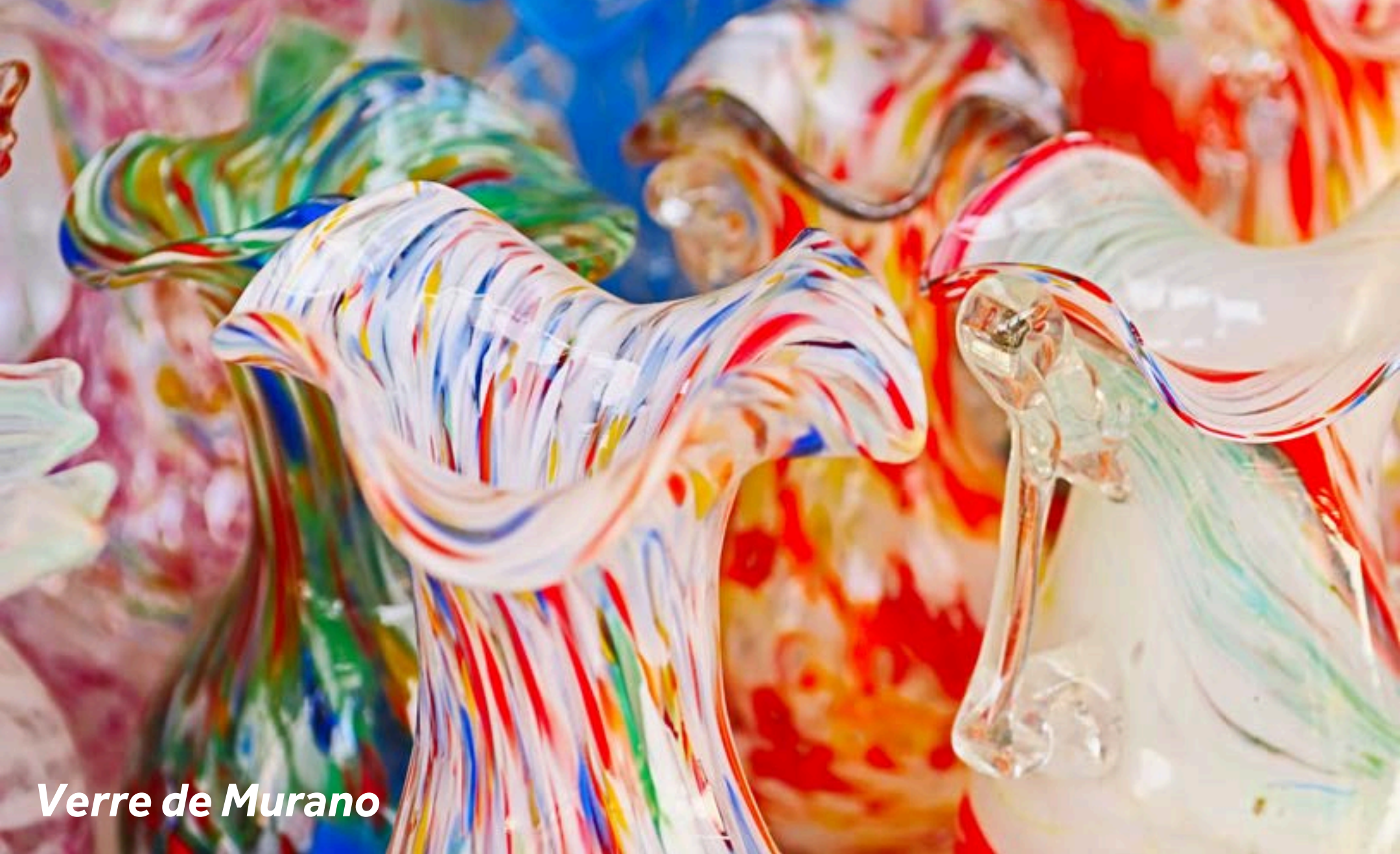
Verre de Murano