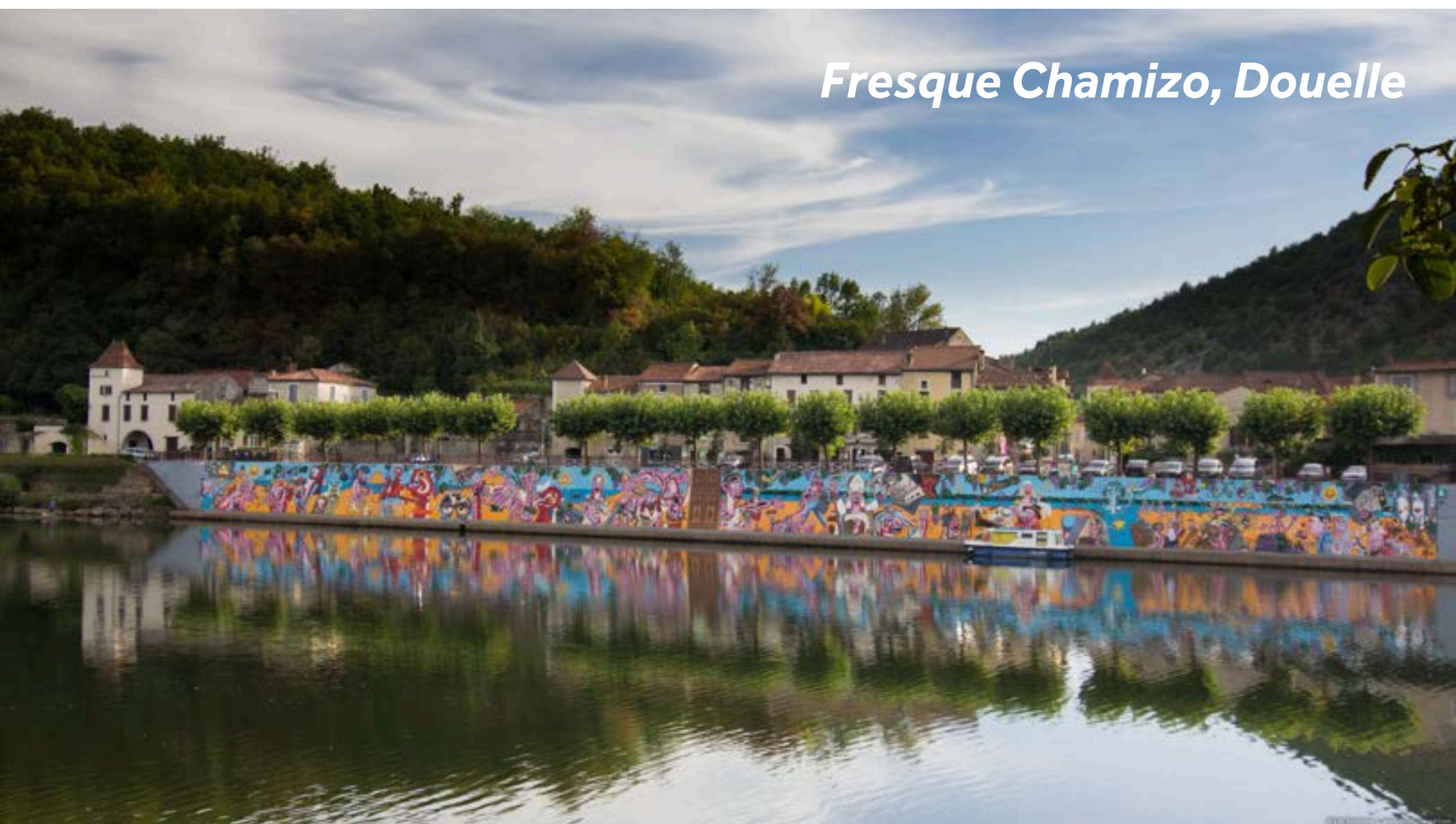
Fresque Chamizo, Douelle

Probieren Sie zum Nachtisch die traditionellen süßen Törtchen ‚Pastis‘, die Sie in der Patisserie Les Pastis d’Elise kaufen können. Sollten Sie Wein vorziehen, werden die örtlichen Winzer Ihnen gern alles über die Weine erzählen, die in den umliegenden Weinbergen produziert werden und Sie diese verkosten lassen. Eines dieser Weingüter ist Domaine Marcilhac, das sich seit vielen Generationen im Besitz der gleichen Familie befindetet (+33 565 309 032), und Le Passelys (+33 565 200 576).