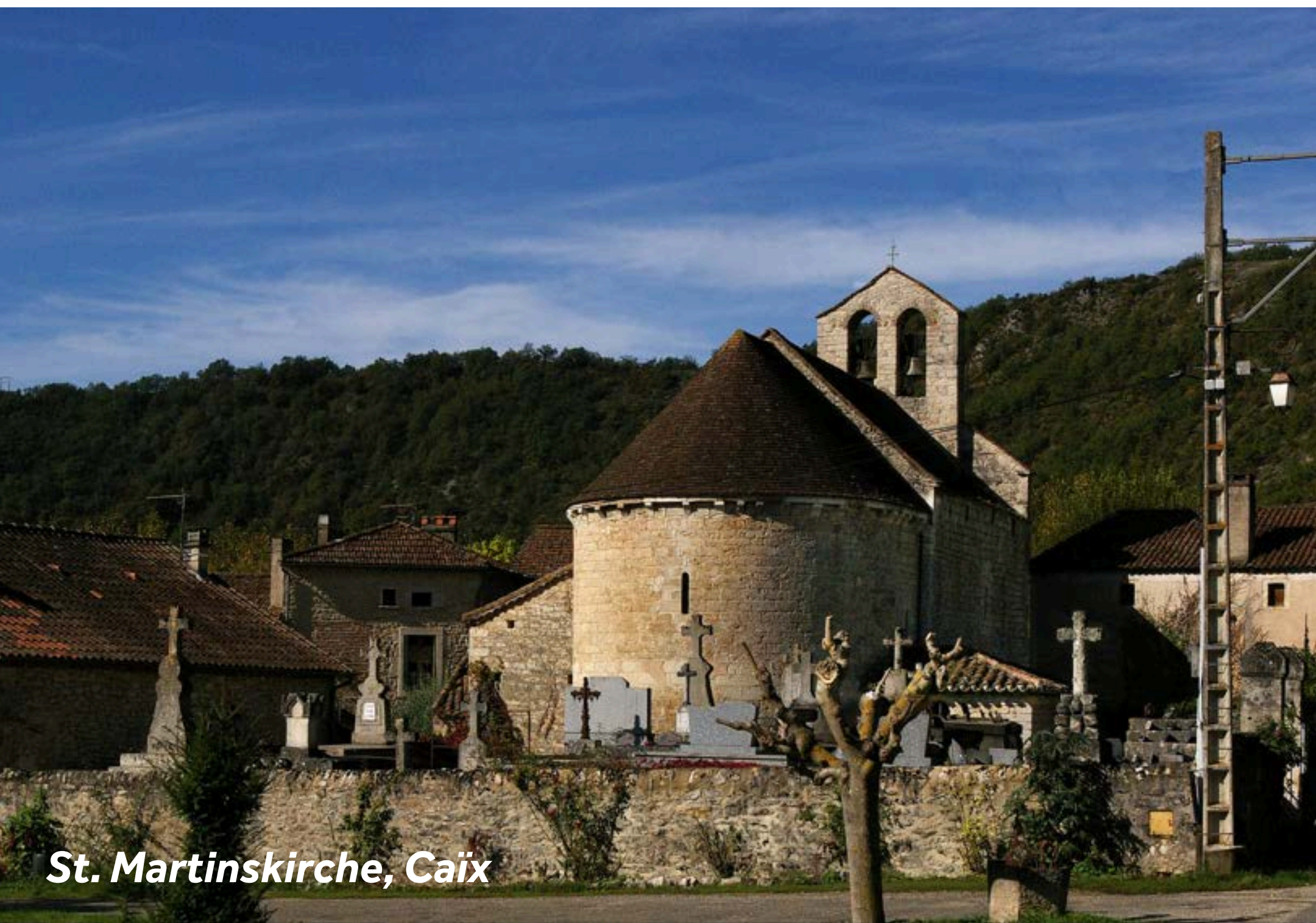
St. Martinskirche, Caix

Legen Sie vor dem Château de Cayx aus dem 15. Jahrhundert an, um in Ruhe die Aussicht zu genießen. Im Mittelalter diente das Château als Teil des Verteidigungssystems von Luzech. Heute befindet es sich im Besitz der dänischen Königsfamilie und wird als Sommerresidenz genutzt. Gärten und Weingut können bei einer Führung besichtigt werden, anschließend folgt eine Verkostung (+33 675 883 949), das Schloss ist privat.