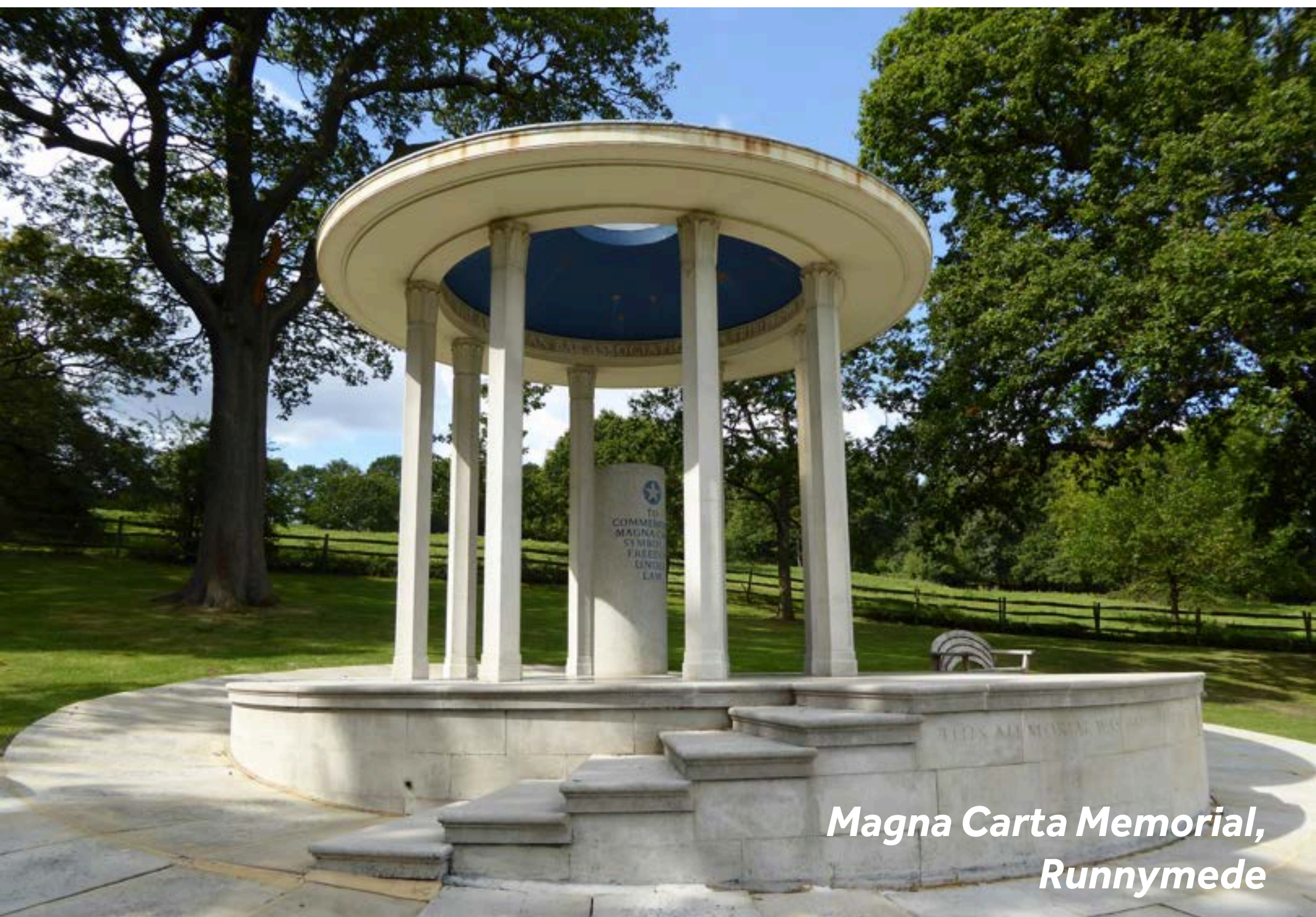
Magna Carta Memorial, Runnymede

König Johann traf sich vor fast 800 Jahren mit einer Gruppe von Baronen auf Magna Carta Island in Runnymede. Hier unterzeichnete er die Magna Carta, die von vielen als symbolischer erster Schritt auf dem Weg zur modernen Demokratie angesehen wird. Legen Sie an den Ufern direkt vor dem Runnymede Vergnügungspark an (eine geringe Gebühr fällt an). Vom Boot aus können Sie das Magna Carta Memorial in der Ferne erkennen. Achten Sie beim Überqueren der belebten Straße auf den Verkehr und gehen Sie über das Feld in Richtung Denkmal. Eingebettet in eine ruhige Umgebung auf einem sanften Hang mit Blick auf die Themse ist das Denkmal ein idealer Ort, um innezuhalten und über den fortwährenden Kampf für Freiheit nachzudenken.