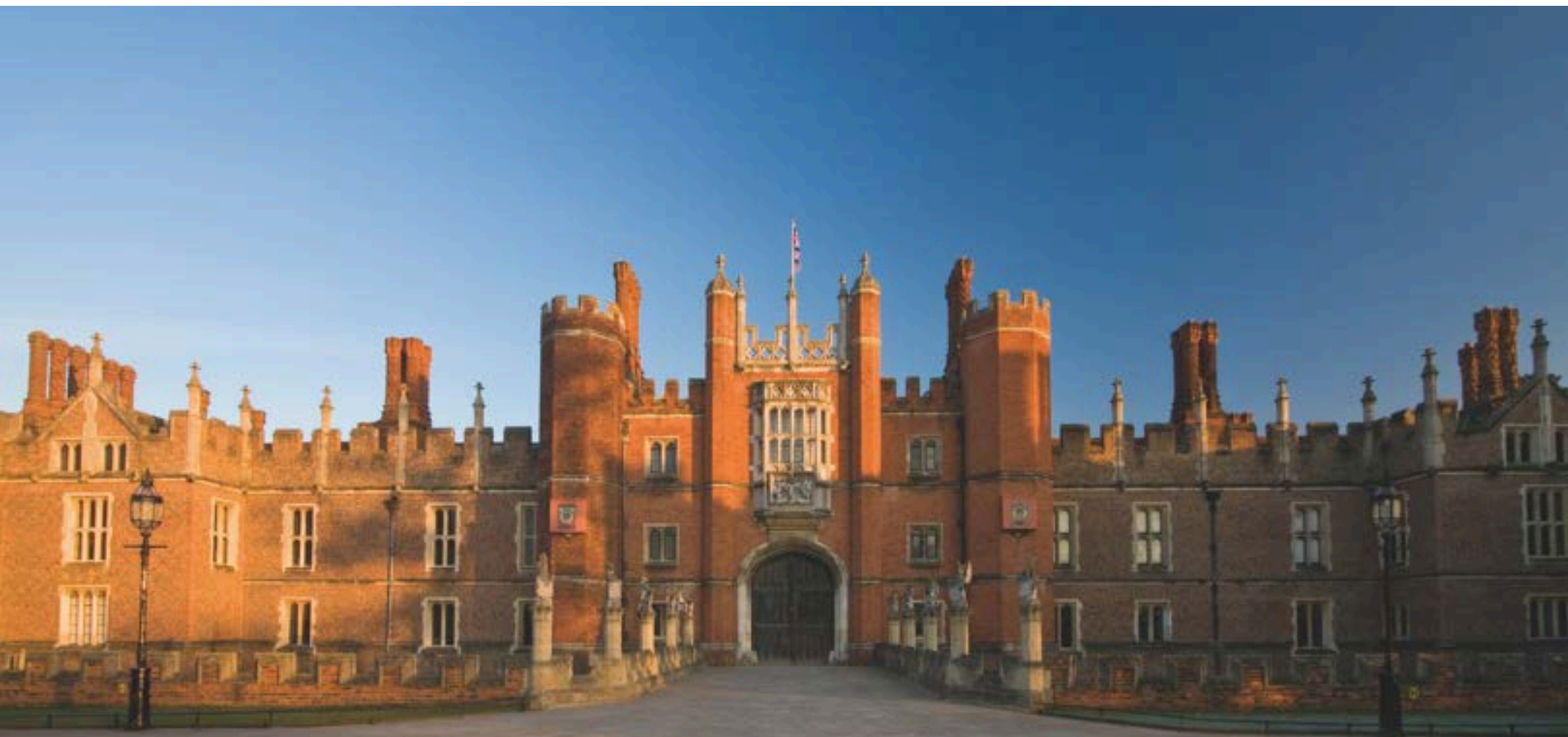
Hampton Court Palace

Hampton Court Palace gilt als „großartigster Palast in Großbritannien“ und bietet eine magische Reise durch 500 Jahre königliche Geschichte. Zu den ehemaligen Bewohnern zählen Heinrich VIII, William III. und Queen Mary, die jeweils Teile des Palastes erweiterten und modernisierten. Königin Victoria öffnete Hampton Court Palace und die umliegenden 600 Morgen Parkland im Jahre 1838 für die Öffentlichkeit. Besichtigen Sie die Prunkgemächer und die größten Küchen von Tudor-England; verlaufen Sie sich im ältesten noch stehenden Heckenlabyrinth des Vereinigten Königreichs (das eine Fläche von über 4.000 qm 2 umfasst) und entspannen Sie sich in den über 60 Morgen großen Gärten des Hampton Court Palace, mit glitzernden Springbrunnen und prächtigen Blumenbeeten mit über 200.000 Blütenknollen. Besuchen Sie auch Bushy Park, die zweitgrößte der königlichen Parkanlagen Londons. Er erstreckt sich über knapp 450 Hektar und beherbergt Rot- und Damwild, das in den Wäldern und auf den Wiesen umherläuft.