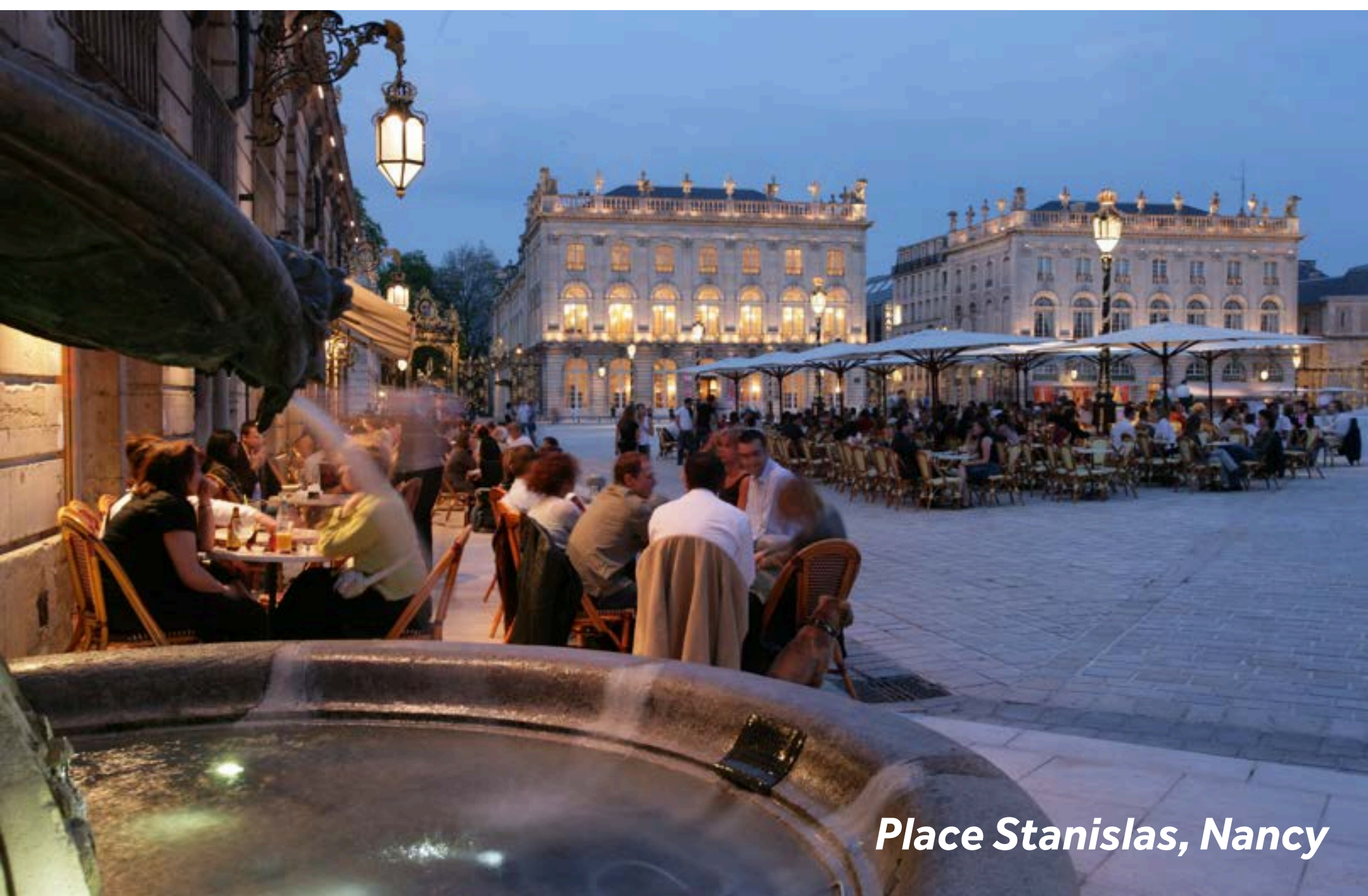
Place Stanislas, Nancy