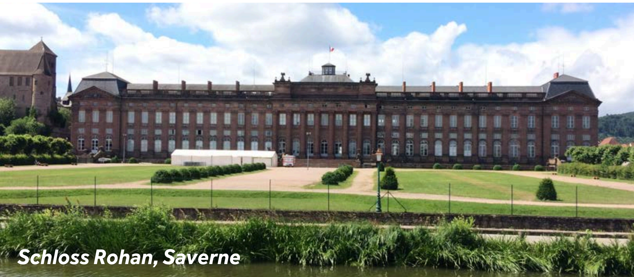
Schloss Rohan, Saverne

Die strategische Lage in den Vogesen zwischen dem Lothringer Plateau und der elsässischen Ebene macht Saverne zu einem außergewöhnlichen Ort. Saverne lässt sich bestens mit dem Boot erreichen, wo Sie vor dem Schloss „Château des Rohans“ anlegen können. Der Ort ist eine typische elsässische Stadt mit feiner Küche und schönen Geschäften sowie bedeutsamen Spuren der Vergangenheit, wie den alten Festungen, einer römischen Kirche und einer mit Fachwerkhäusern gesäumten Fußgängerzone. Der Rosengarten mit seinen ca. 8.500 Rosen besteht seit 1898 und ist vor allem im Juni einen Besuch wert, wenn das alljährliche Rosenfestival abgehalten wird.