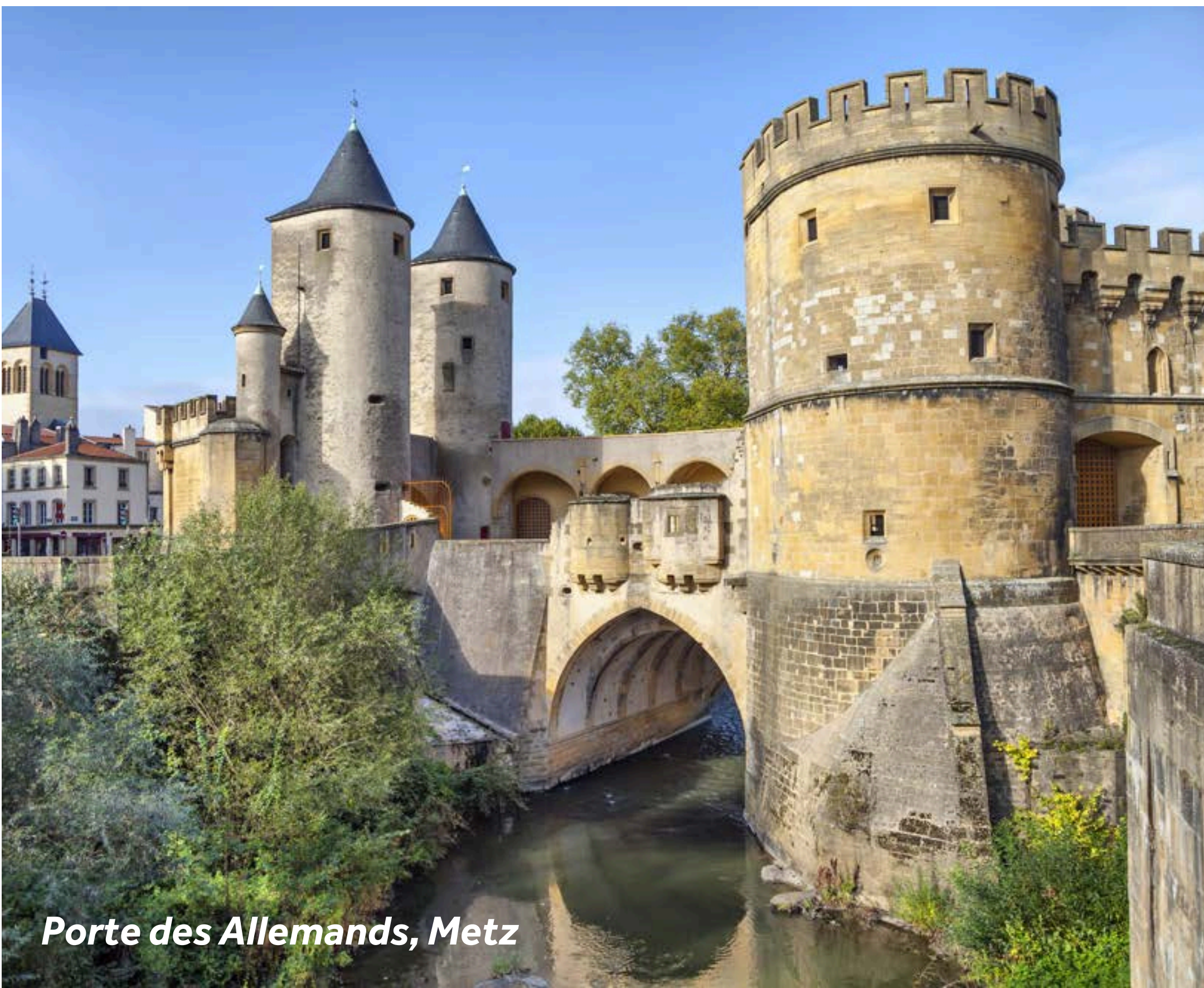
Porte des Allemands, Metz