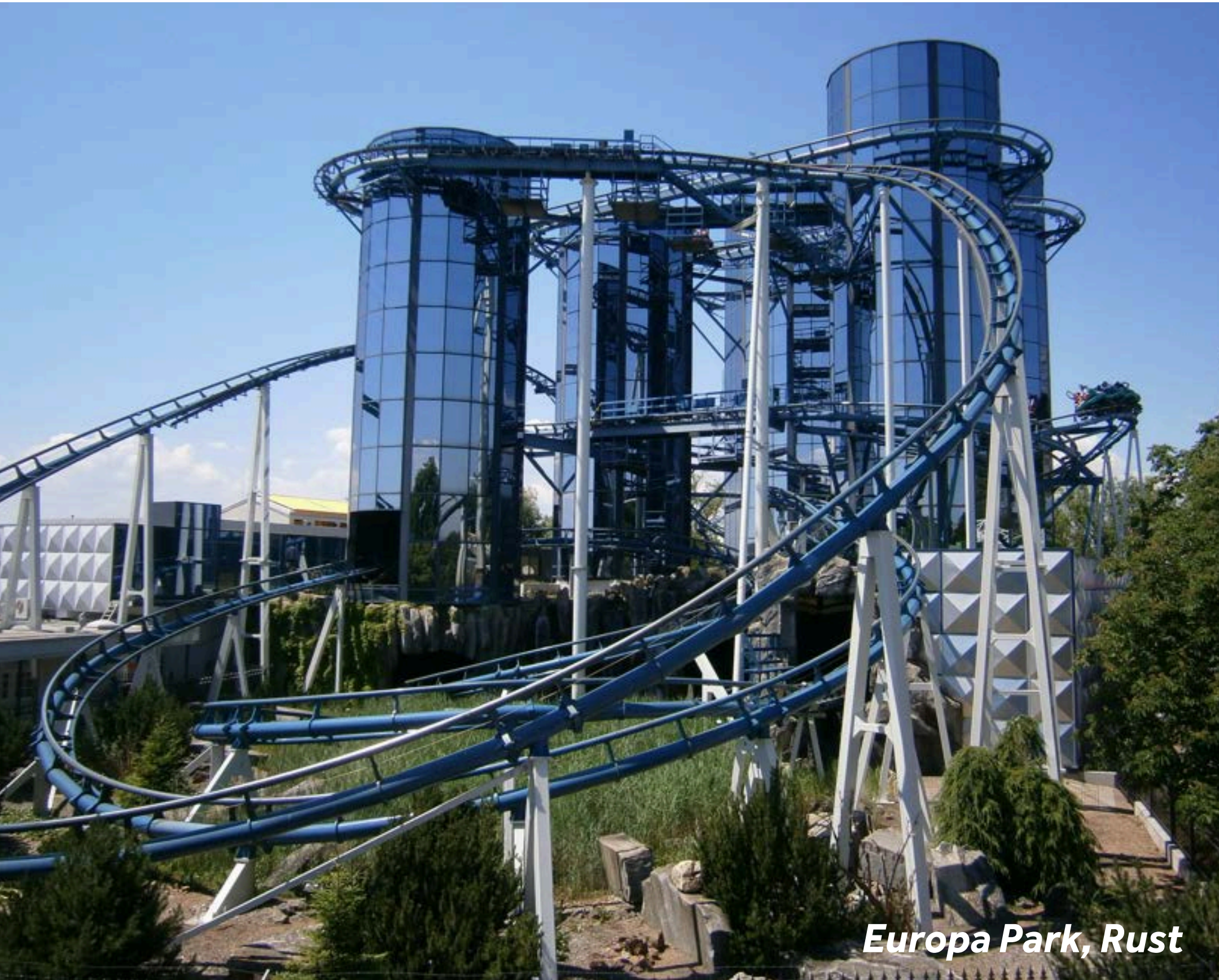
Europa Park, Rust

Boofzheim liegt im Herzen des „Ried“, einem großen Sumpfgebiet. In dem Dorf finden Sie zahlreiche Fachwerkhäuser aus dem 17. und 18. Jahrhundert sowie die Kirche St-Etienne aus dem 13. Jahrhundert.