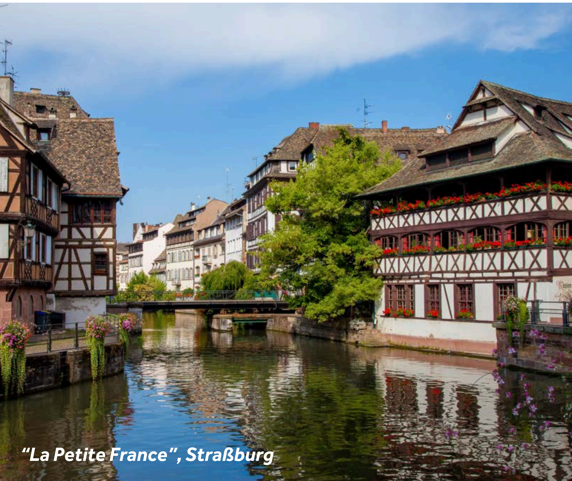
“La Petite France”, Straßburg