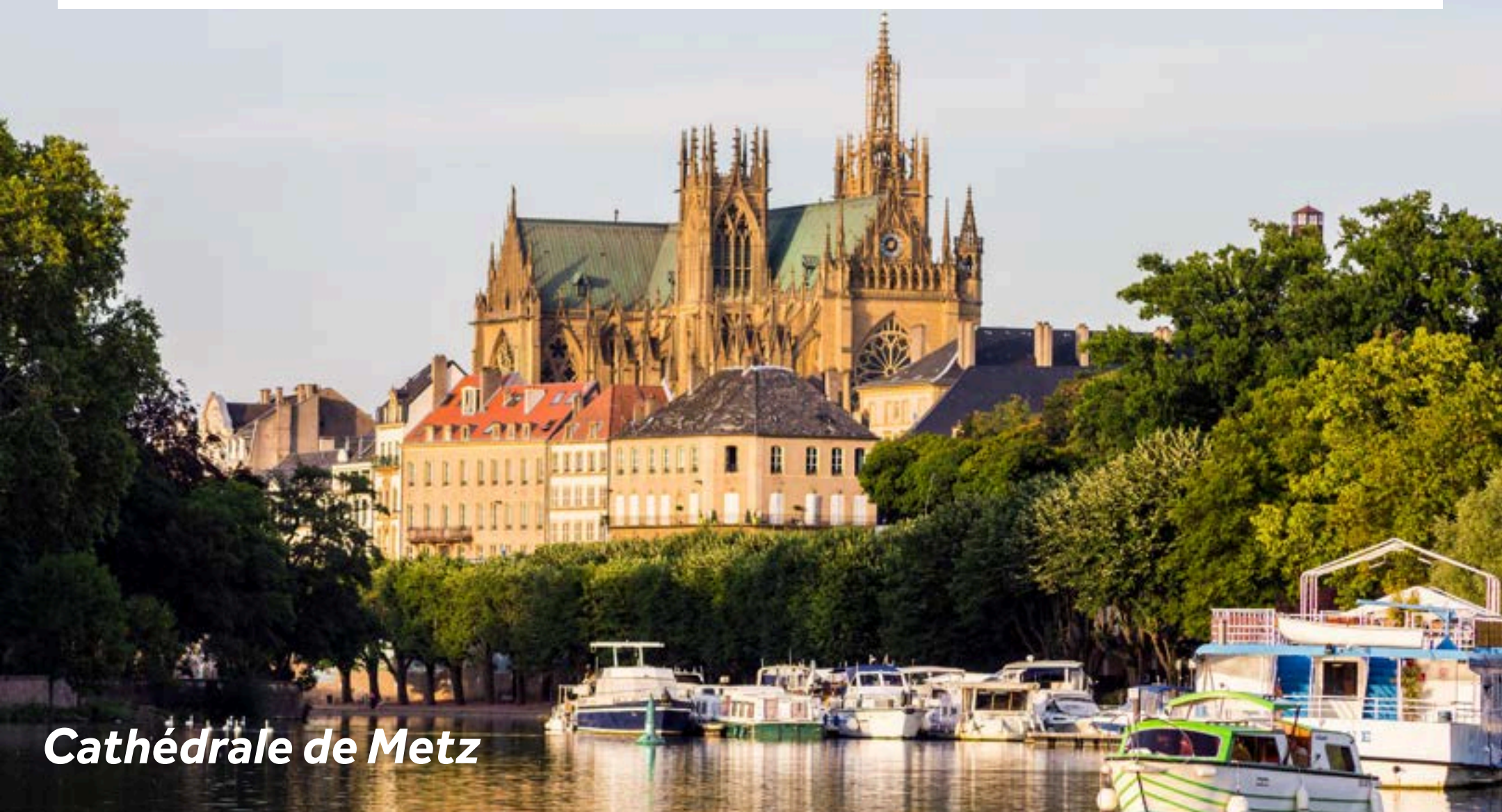
Cathédrale de Metz

Metz verkörpert ein Mosaik verschiedener Stile, Materialien und Farben. Es ist eine geschichtsträchtige Stadt mit einzigartigem Charakter, in der es viel zu entdecken gibt: von gallorömischen Funden und Thermalbädern im Museum La Cour d'Or, der atemberaubenden Kathedrale St. Etienne mit ihren 6500m 2 Buntglasfenstern bis hin zur letzten noch bestehenden Burgbrücke in Frankreich, der Porte des Allemands. Besuchen Sie für moderne Kunst das Centre Pompidou-Metz, ein Meisterwerk der zeitgenössischen Architektur - inspiriert von einem Chinesenhut- mit drei Ausstellungsräumen und einem gewagten Dach.