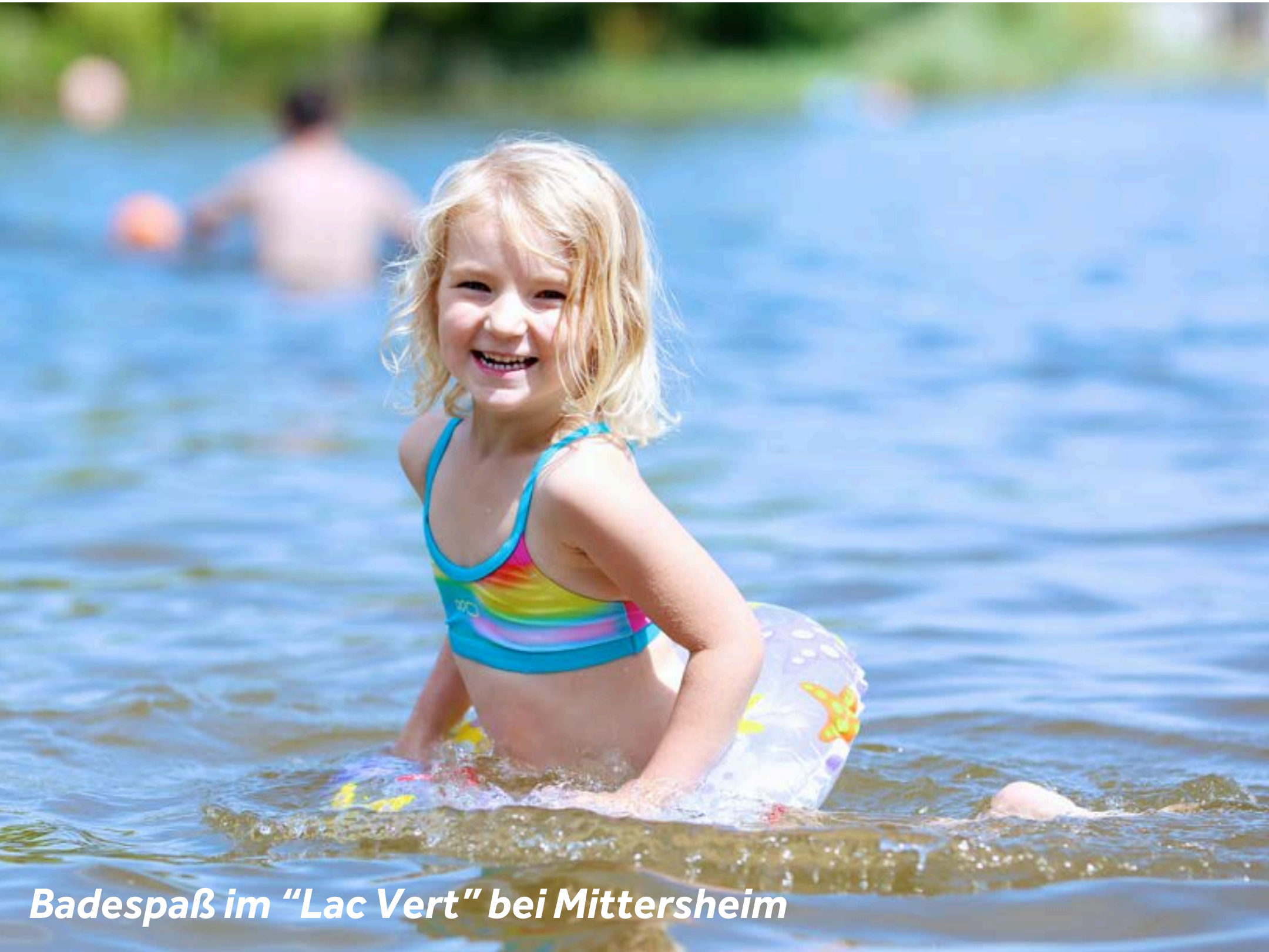
Badespaß im „Lac Vert“ bei Mittersheim

Das im Herzen des Pays des Etangs (Land der Seen) gelegene Mittersheim ist ein traditionelles Dorf in Lothringen, mit Anlegeplätzen in der Nähe des „Lac Vert“ (Grüner See), einem idealen Ort zum Schwimmen, Angeln und für Wassersport. Der See kann nicht mit dem Boot erreicht werden, ist jedoch nur wenige Meter vom Ufer des Kanals entfernt.