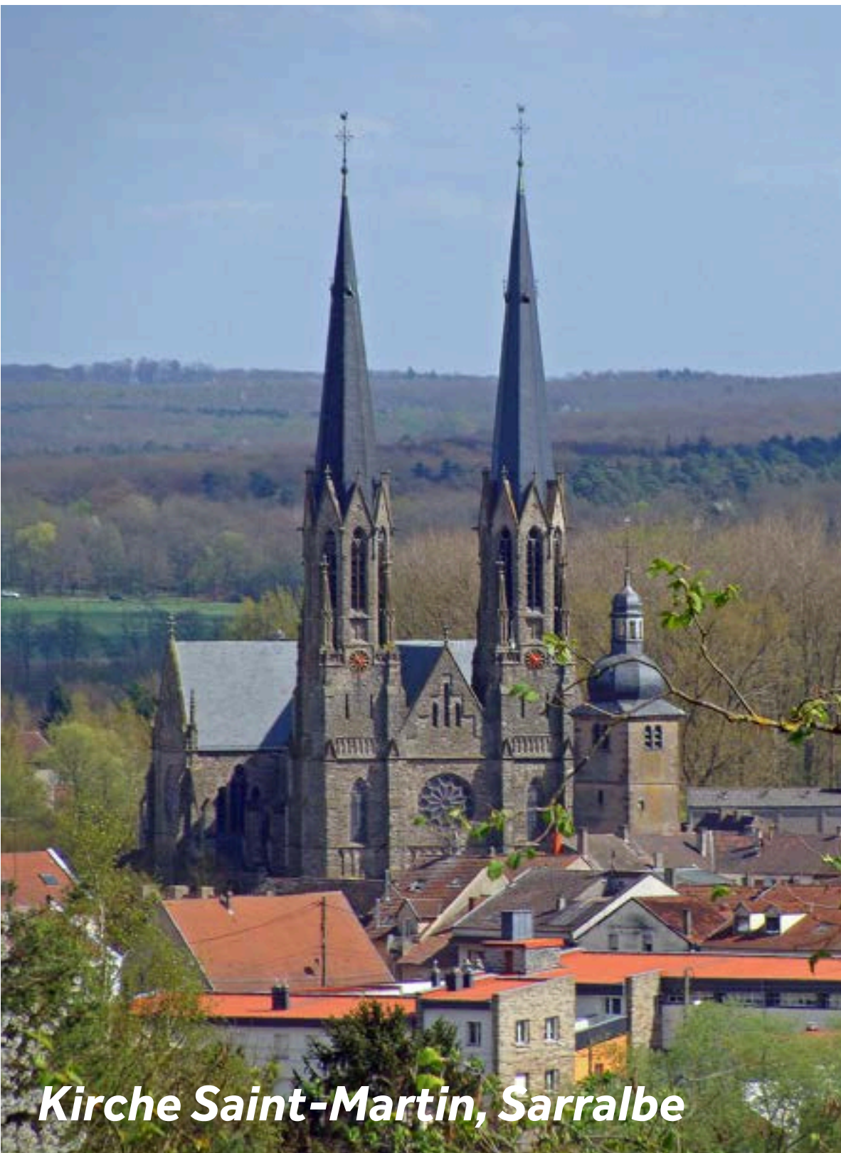
Kirche Saint-Martin, Sarralbe

Sarralbe liegt an der Stelle, an der die Albe in die Saar fließt. So kam der Ort zu seinem Namen. Der Canal de la Sarre kreuzt hier den Fluss Albe auf einer 1867 erbauten Brücke. Hierbei handelt es sich um die erste Metallbrücke ihrer Art, die in Frankreich gebaut wurde. Die Architektur des Dorfes